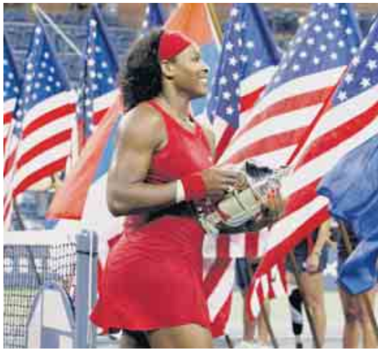
Più sorridente che mai: ecco la (di nuovo) grandissima Serena.

Intanto, nel corso di questa nottata, Roger Federer ha sfidato in finale del torneo maschile lo scozzese Andy Murray, capace di battere in semifinale Rafa Nadal al termine di una partita epica (6-2 7-6 4-6 6-4) giocata nel corso di due differenti serate. L'iberi-