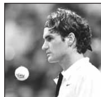
Federer: en promenade?

La fragilité de Baghdatis. Adversaire malheureux de Nieminen l'an dernier en demi-finale, Marcos Baghdatis (ATP 43) traverse l'une des périodes les plus noires de sa carrière. Défait 6-2 4-6 6-2 par l'Espagnol Marcel Granollers (ATP 52), le Chypriote collectionne, en effet, les désillusions cette année. Blessé au poignet après Wimbledon, Baghdatis avait été contraint à l'abandon lors de ses deux tournois de rentrée avant de s'aligner à la Halle St-Jacques, au Challenger d'Orléans et à Metz. A 23 ans, est-il devenu un joueur trop fragile pour supporter les contraintes