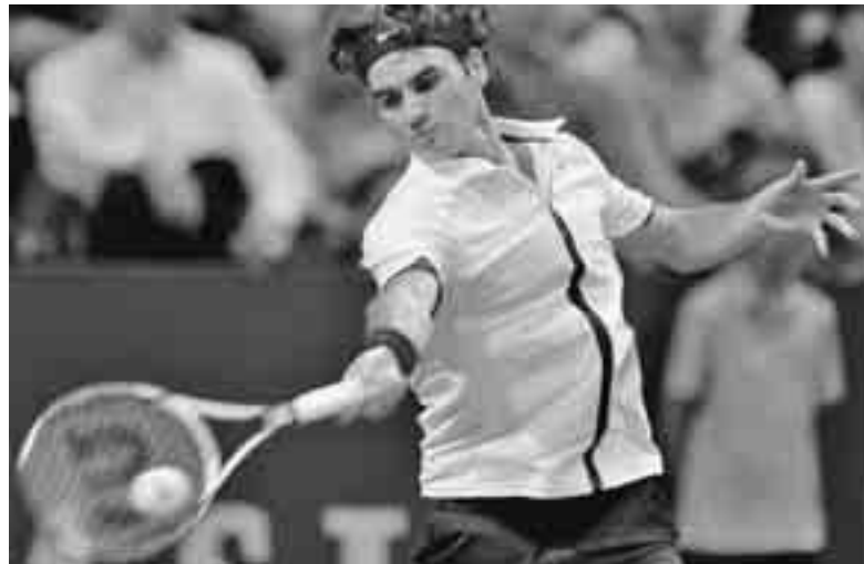
Oggi Federer sfiderà Nieminen negli ottavi di Basilea.

Federer e Nieminen si sono incontrati per la prima volta nel 2002 negli ottavi di finale del torneo di Mosca, dove l'elvetico si era imposto 6-1 6-4. Una sola volta Jarkko Nieminen è riuscito a portare il basilese al tie-break, nel 2004 nel primo set della semifinale disputata a Dubai e che il rossocrociato aveva vinto 9-7 dopo aver cancellato tre palle di set.