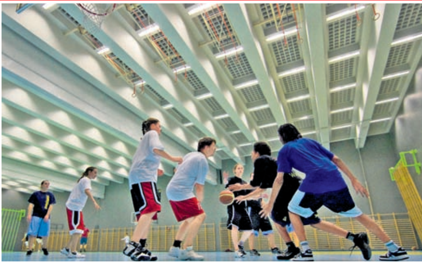
Frauenpower. Beim ersten Spielabend in dieser Saison fanden sich auch viele junge Basketballerinnen ein.