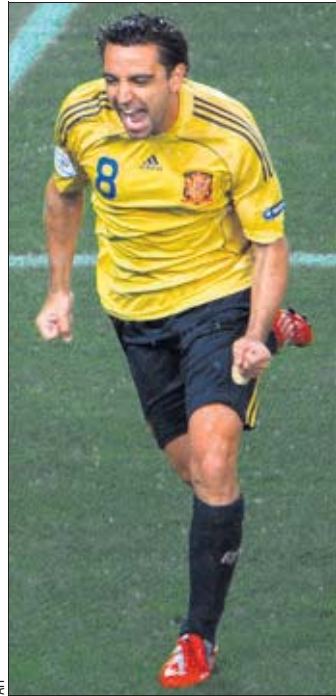
Xavi a joué un rôle essentiel dans le succès espagnol à l'Euro.

Bien sûr, la concentration des meilleurs joueurs se fait sur les principaux championnats européens, là où les clubs ont les plus gros moyens économiques. Angleterre, Espagne, Italie, Allemagne, France dans une moindre mesure, c'est là qu'on