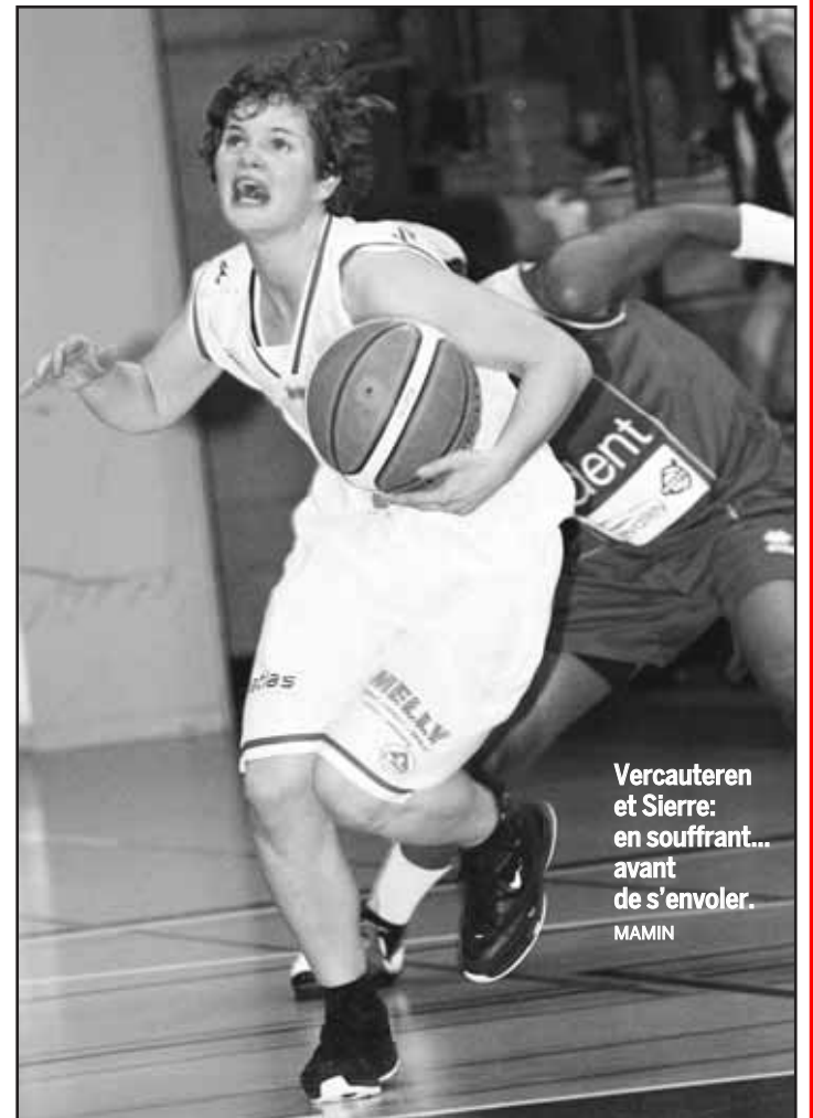
Vercauteren et Sierre: en souffrant... avant de s'envoler. MAMIN