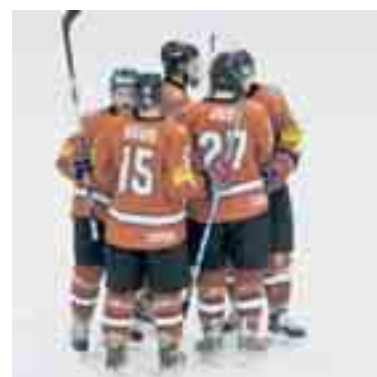
I giovani svizzeri ancora vittoriosi.

Ai Mondiali U20 la Svizzera ha centrato il suo secondo successo in altrettanti incontri. La selezione