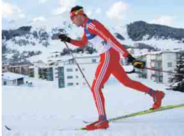
A Davos, Dario Cologna è balzato in testa alla generale di Coppa del mondo.

plio campione del mondo U23, vincitore della Maratona engadinese nel 2007, bronzo ai Mondiali juniores nel 2006, tre piazzamenti nei top-10 questo inverno in appena sei corse di Coppa del mondo e a completare il tutto il pettorale di leader della classifica generale, che un rossocrociato non aveva mai portato finora. Risultati che permettono di ipotizzare un'entrata duratura di Cologna tra i grandi della disciplina per i prossimi anni. Ma Swiss-Ski resta paziente. Cologna non andrà a difendere la sua prima posizione il weekend prossimo nelle gare sprint di Düsseldorf. Questione di risparmiare le forze in vista del "Tour de Ski" che terrà banco durante le feste di Natale. Questa nuova prova da disputarsi su più giorni, con tappe su tutte le distanze e nei diversi stili, sembra oltretutto tagliata su misura per il prodigio della Val Mustair. In effetti Cologna, pur avendo una predilezione per lo skating, è capace di mettersi in evidenza anche a stile classico e su tutte i chilometraggi, dallo sprint alla 50 km. Il grigionese poi può affidarsi a una salute eccezionale: «Questo ragazzo non è mai ammalato», esclama Albert Manhart, l'allenatore che lo segue sin dagli juniores. Cologna sa perfettamente ascoltare i segnali del suo corpo, dosando i suoi allenamenti. I test