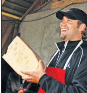
Roethlisberger lors de sa venue dans l'Emmental, en mai 2006.

Il possède sa marque de sauce barbecue, un hamburger porte son nom et il a signé un contrat de 40 millions de dollars. A 27 ans, le quarterback des Pittsburgh Steelers, d'origine emmentaloise, jouera sa troisième finale du championnat de football américain dans la nuit de dimanche à lundi. Portrait de ce solide gaillard de 110 kg.