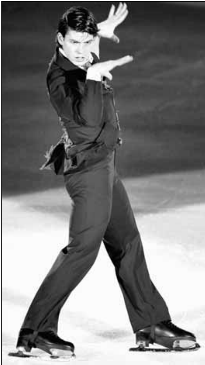
Stéphane Lambiel, qui peut enfin laisser parler toute sa créativité lors des galas, ne regrette pas la compétition.

Je suis plus libre. Il n'y a plus de règlement. J'ai besoin de cette liberté pour créer et élaborer de nouvelles chorégraphies (réd: Lambiel an-