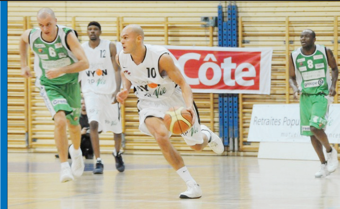
Archives Nathalie Racheter

Alors que le Forum de Davos s'ouvre sur fond de morosité économique et de crise mondiale, certains prônent les temps de la décroissance. Un concept soumis à l'analyse de quelques personnalités régionales. p.3