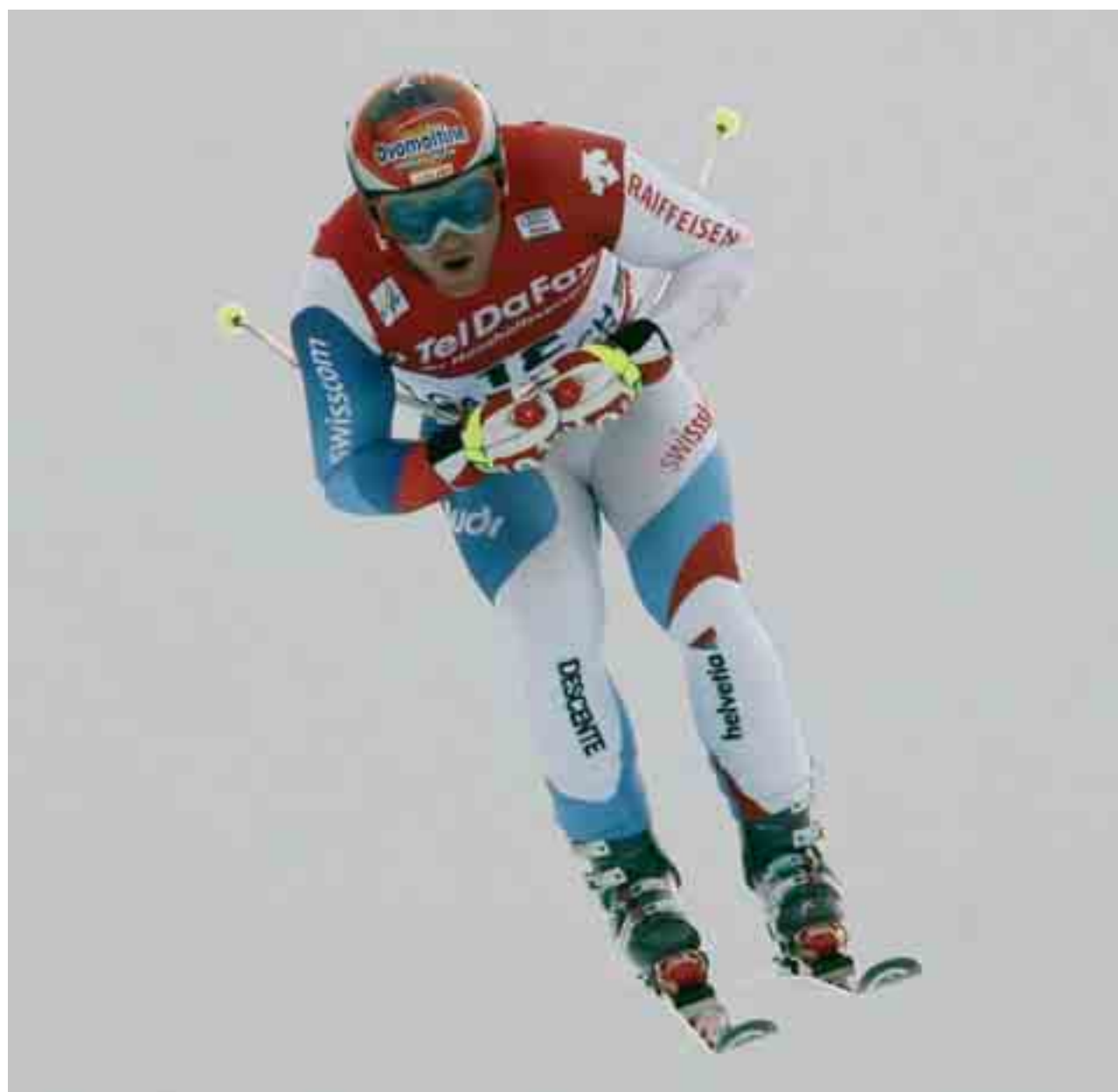
Didier Cuche ieri è stato il più veloce nelle prove di discesa di Garmisch.