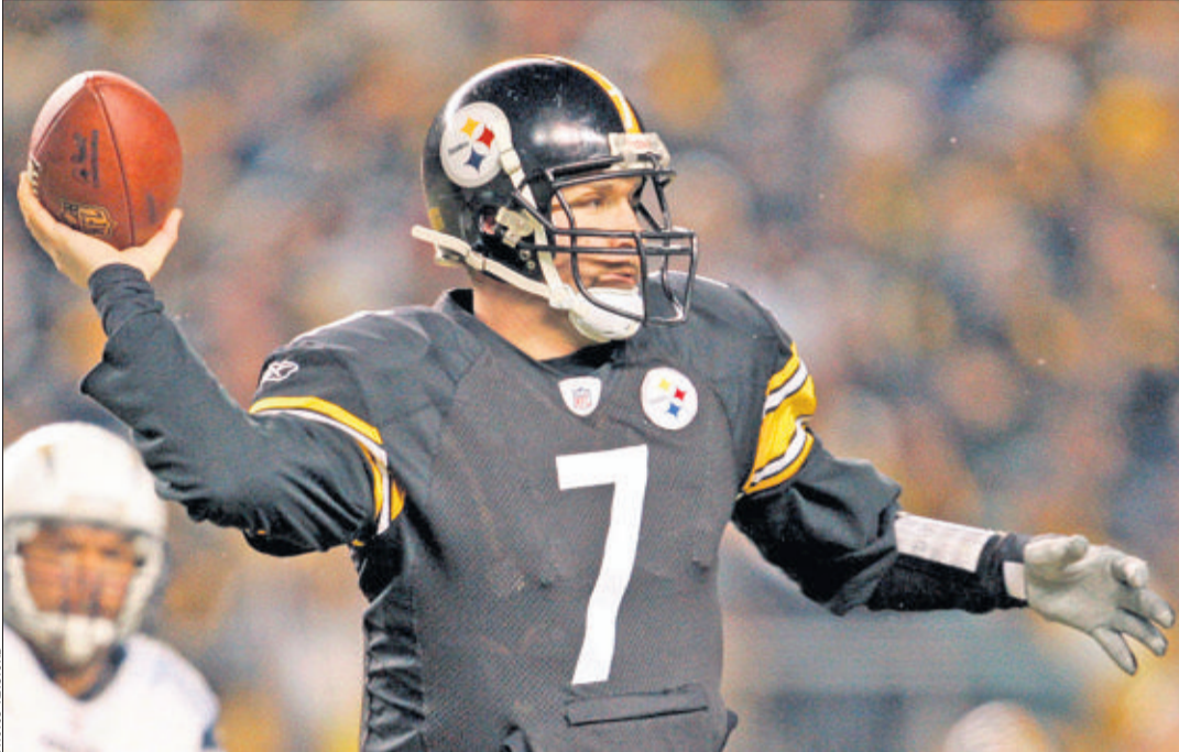
IMPOSANT Le No 7 de l'équipe des Pittsburgh Steelers, Ben Roethlisberger, espère bien remporter sa deuxième finale du championnat NFL, dans la nuit de dimanche à lundi.

Ben Roethlisberger, c'est le stratège de Pittsburgh qui affrontera dans la nuit de dimanche à lundi les Arizona Cardinals, lors du 43e Superbowl. Il y a trois ans, notre «Emmenta-