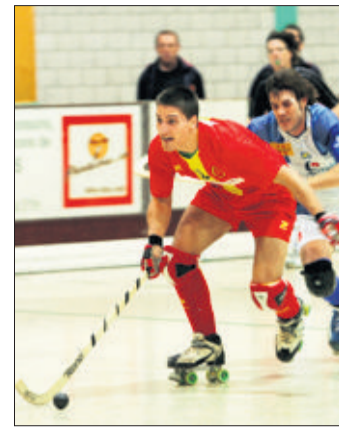
Jimenez et les Genevois doivent reprendre confiance. (G. CABRERA)

Cette cascade d'échecs n'a pourtant pas érodé l'esprit de corps de l'équipe: «Au contraire, je dirais qu'elle a resserré les rangs et provoqué une prise de conscience. L'ambiance est