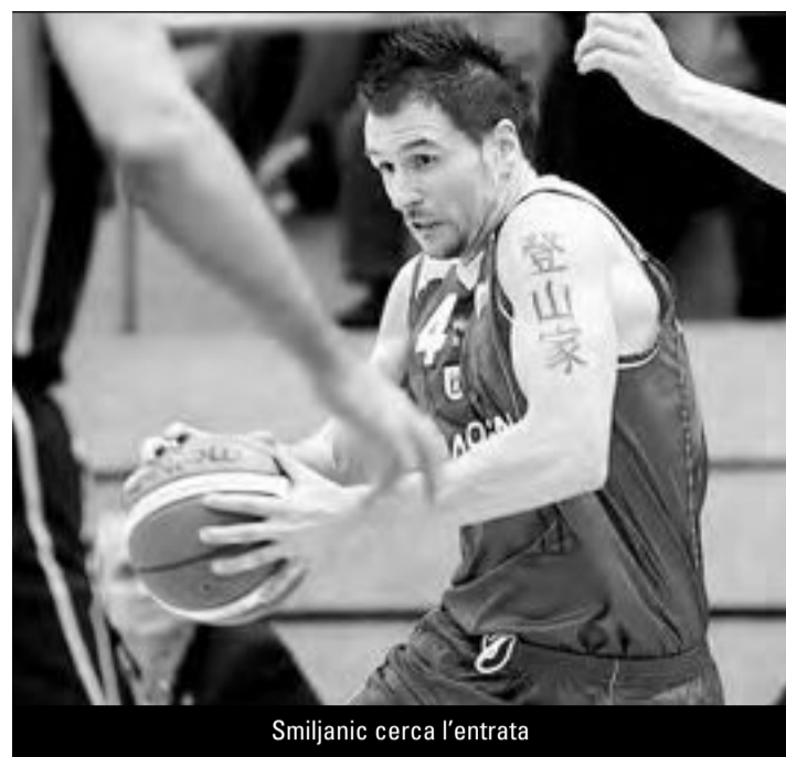
Smiljanic cerca l'entrata