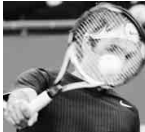
Federer passa il turno a Indian Wells.