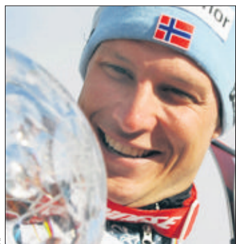
Aksel Lund Svindal succède à Bode Miller au palmarès.

Le globe du géant dames est revenu à Tanja Poutiainen. La Finlandaise, 2e de l'ultime épreuve, l'a soufflé à l'Autrichienne Kathrin Zettel (8e). Dans le camp suisse, la satisfaction est une fois de plus venue de Fabienne Suter, qui a réussi le meilleur résultat de sa carrière dans la discipline en prenant la 5e place. SI