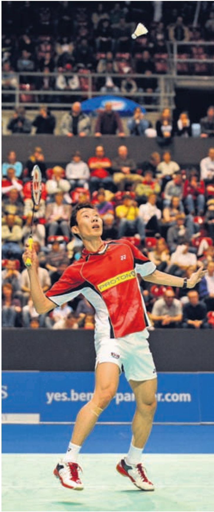
Lee Chong Wei. Spitzenbadminton vor vollen Rängen.

Malaysias Volksheld Lee Chong Wei gewinnt am Swiss Open den Titel im Männer-Einzel