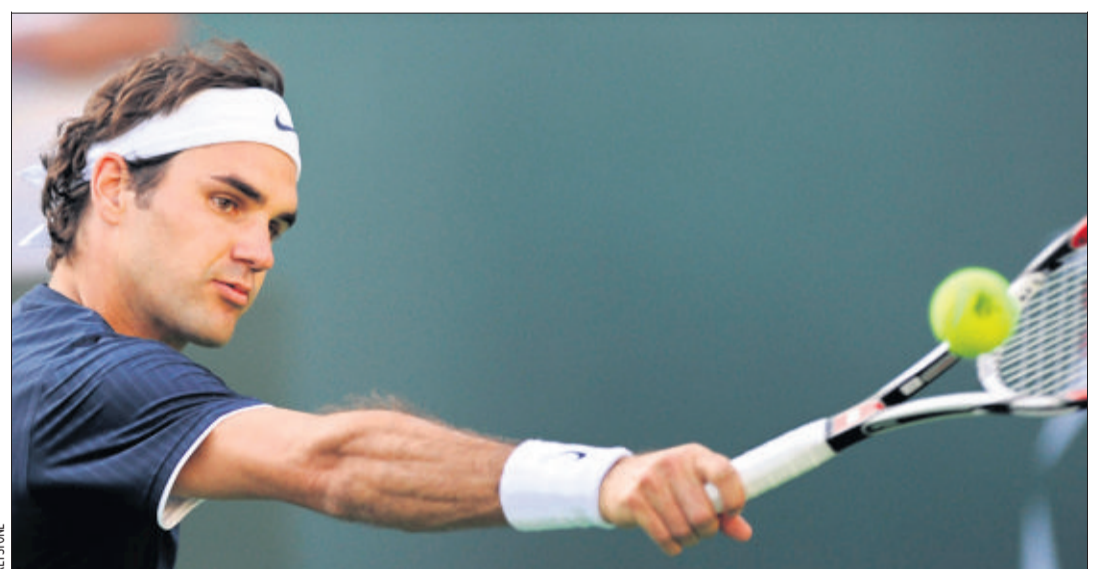
Roger Federer a dû longtemps patienter avant de passer l'épaule.

Roger Federer s'est finalement imposé 7-6 6-4. Le Bâlois a dû attendre 1 heure et 13 minutes de jeu pour signer enfin un break. Il n'avait pas bénéficié de la moindre ouverture lors d'un premier set bien indécis jusqu'à 4-4 dans le jeu décisif. «J'attendais un tel match, soulignait Roger Federer. Mais l'essentiel est là: j'ai gagné et je n'ai