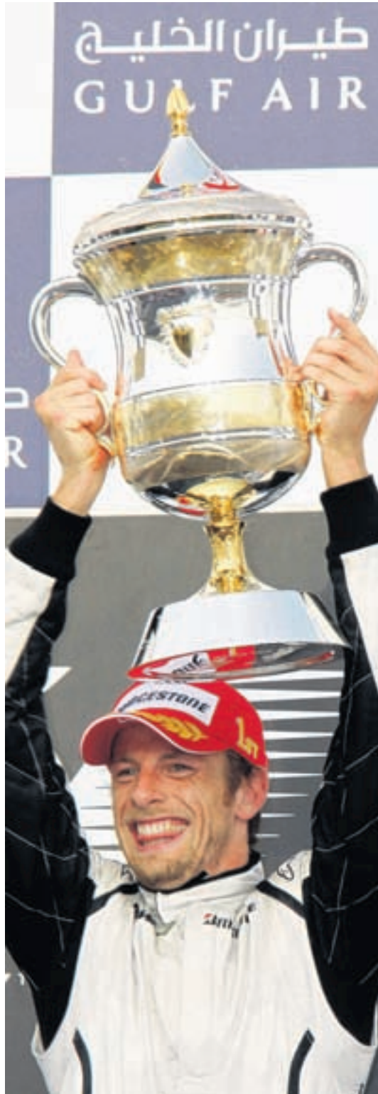
Dritter Saisontriumph. «Das war der beste Sieg in diesem Jahr», jubelte der britische WM-Leader Jenson Button.

Buemi (17.) war in Manama so chancenlos wie BMW-Sauber