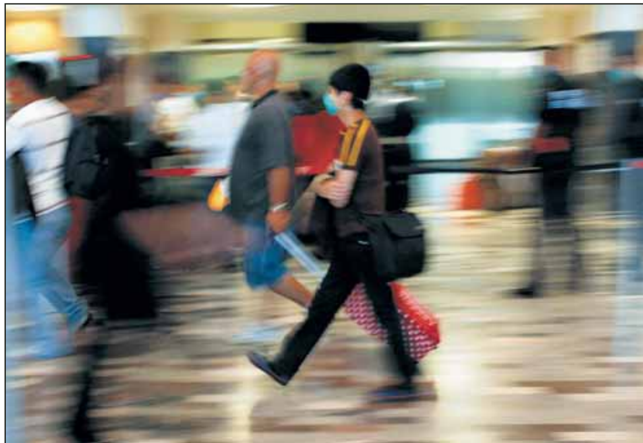
Le nouveau virus A/H1N1 est transmissible d'homme à homme. Il est en conséquence difficile à contenir.

VIRUS • Le Mexique et les Etats-Unis ont décrété l'état d'urgence sanitaire ce week-end suite à l'éclatement de la grippe porcine. Le virus a tué au moins 20 personnes au Mexique et plus de 1300 sont contaminées. Aux USA, une vingtaine de personnes ont contracté la maladie. Tandis que des cas suspects inquiètent l'Europe. En Suisse, l'Office fédéral de la santé publique affirme que le pays est paré pour faire face à une éventuelle pandémie. Berne a en effet constitué des réserves de Tamiflu, médicament destiné à soigner la grippe aviaire, également efficace contre la grippe porcine. > 3