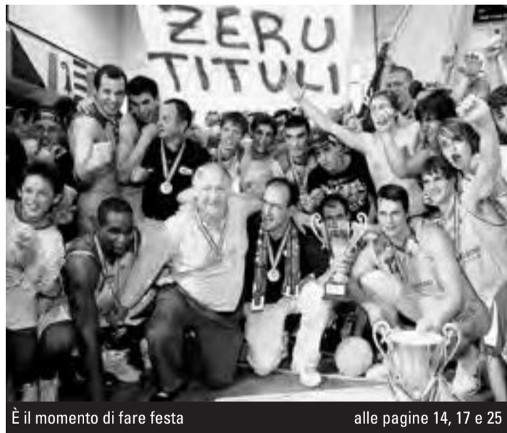
È il momento di fare festa