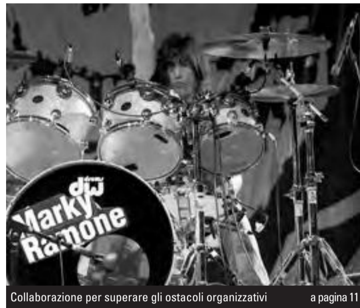
Collaborazione per superare gli ostacoli organizzativi