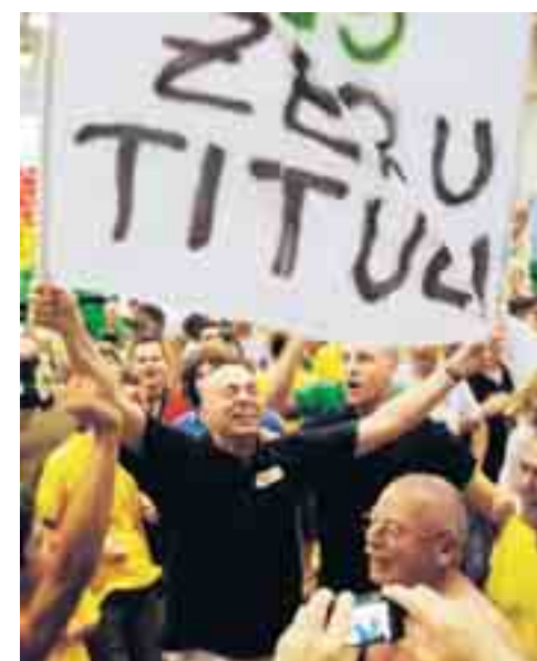
E ci sta anche qualche sffottò...

ovvero l'altra faccia della finale-derby