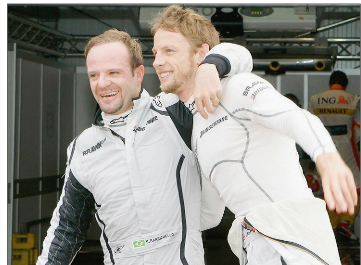
ENCORE EUX Rubens Barrichello (à gauche) et Jenson Button ont signé leur troisième doublé de la saison à Monaco.