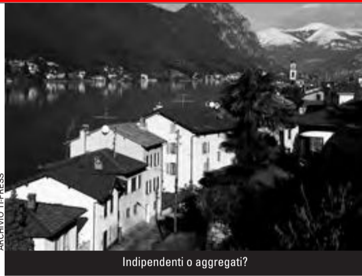
Indipendenti o aggregati?

Gli aspetti che potrebbero caratterizzare l'aggregazione di Brusino con la Nuova Mendrisio devono essere approfonditi ulteriormente. «La partecipazione alla seconda fase dello studio è auspicabile, a condizione, da farci confermare dal Municipio di Mendrisio e dal Consiglio di Stato, di poter in ogni momen-