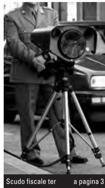
Scudo fiscale ter

La Finanza italiana pronta a riesumare i 'Fiscovelox'