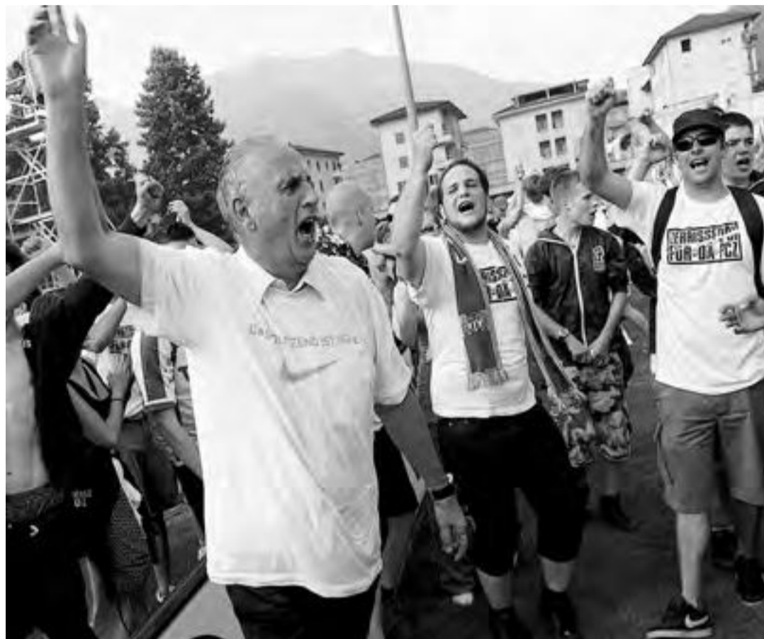
Grande soddisfazione per Challandes e lo Zurigo

Per la formazione della Limmat si tratta del dodicesimo successo Stasera Lugano-San Gallo, poi sarà spareggio con il Lucerna