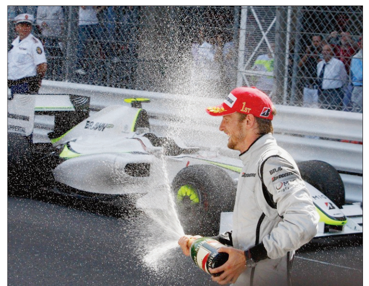
Jenson Button s'est une nouvelle fois imposé en 2009. Le Britannique s'est arrogé la couronne à Monaco.

tué que dix tours, avant de harponner le Brésilien Nelson Piquet par l'arrière en bout de ligne droite et de finir dans une pile de pneus à Sainte Devote. Il était ralenti par Vettel. J'étais dans son sillage et quand j'ai essayé de le doubler, il a freiné. Je n'ai pas pu l'éviter et j'en suis vraiment désolé. Je suis d'ailleurs allé m'excuser auprès de lui, a-t-il simplement expliqué.