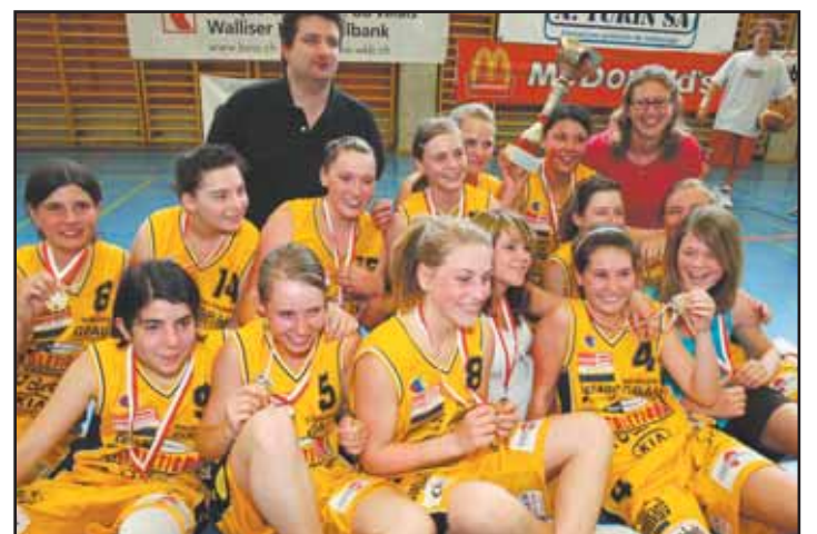
CHABLAIS L'équipe des U15 filles. MSB