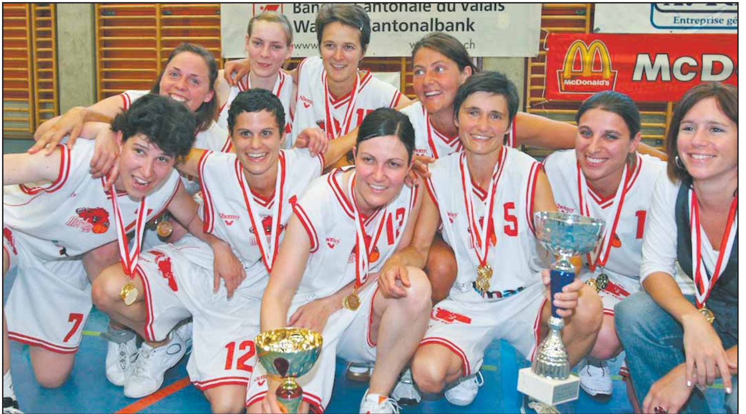
MARTIGNY L'équipe de 2 e ligue féminine. MSB