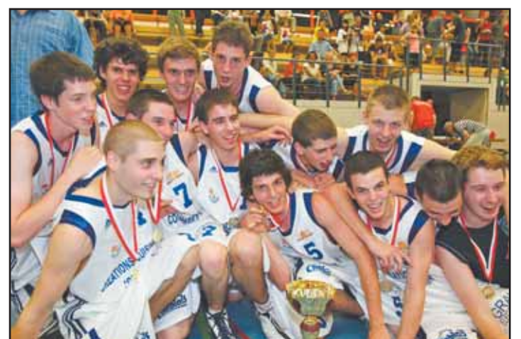
COLLOMBEY L'équipe des U19 garçons. MSB