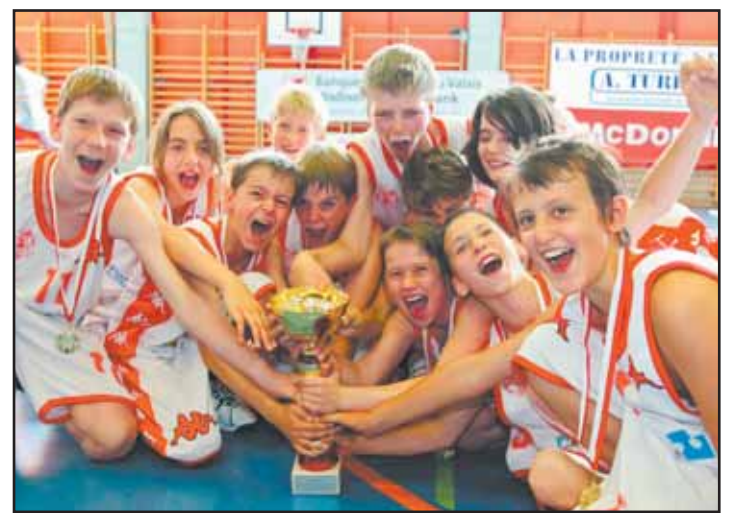
MARTIGNY L'équipe des U13 filles. MSB