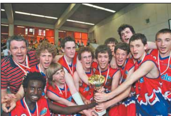
AGAUNE L'équipe des U17 garçons. MSB