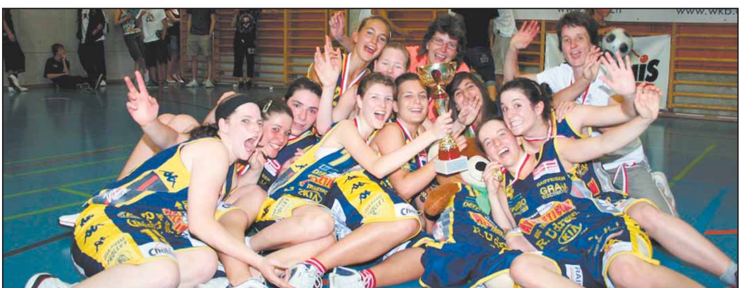
CHABLAIS L'équipe des U17 filles. MSB