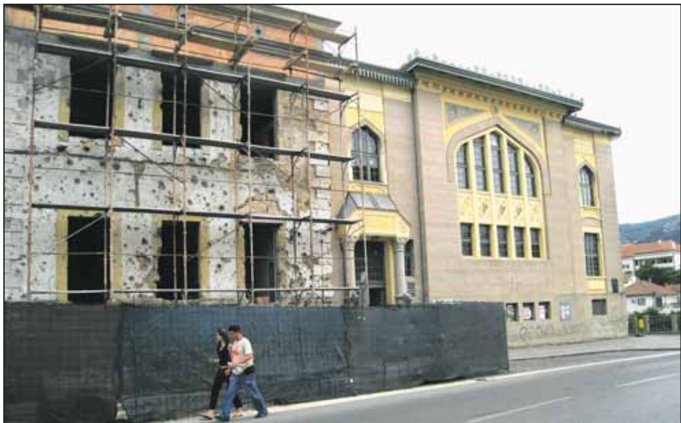
A l'image de Mostar (Bosnie), les Balkans restent partagés entre les «traces» du passé et la modernité.