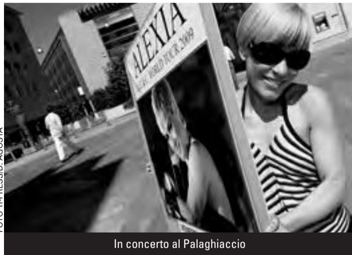
In concerto al Palaghiaccio

Un binomio che non sembra essere campato in aria quello tra Alexia, che nel 2003 ha vinto il Festival di Sanremo, e la tematica della droga. La cantante spezzina, ieri, durante la conferenza di presentazione del concerto, ha infatti evidenziato che non può esimersi dal mettere in guardia le giovani generazioni dal consumo di sostanze che hanno effetti particolarmente nocivi sul funzionamento del cervello: «I giovani di oggi, come quelli della mia epoca sono confrontati con le sostanze stupefacenti. Ciò che voglio fare da artista e da madre è fare capire a chi