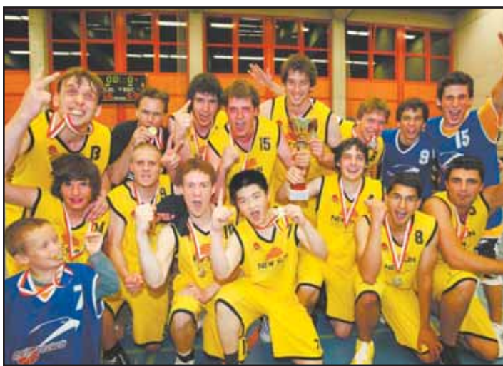
BRIGUE L'équipe de 2 e ligue masculine. MSB