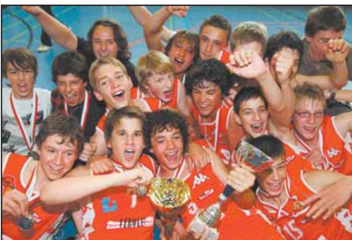
MARTIGNY L'équipe des U15 garçons. MSB