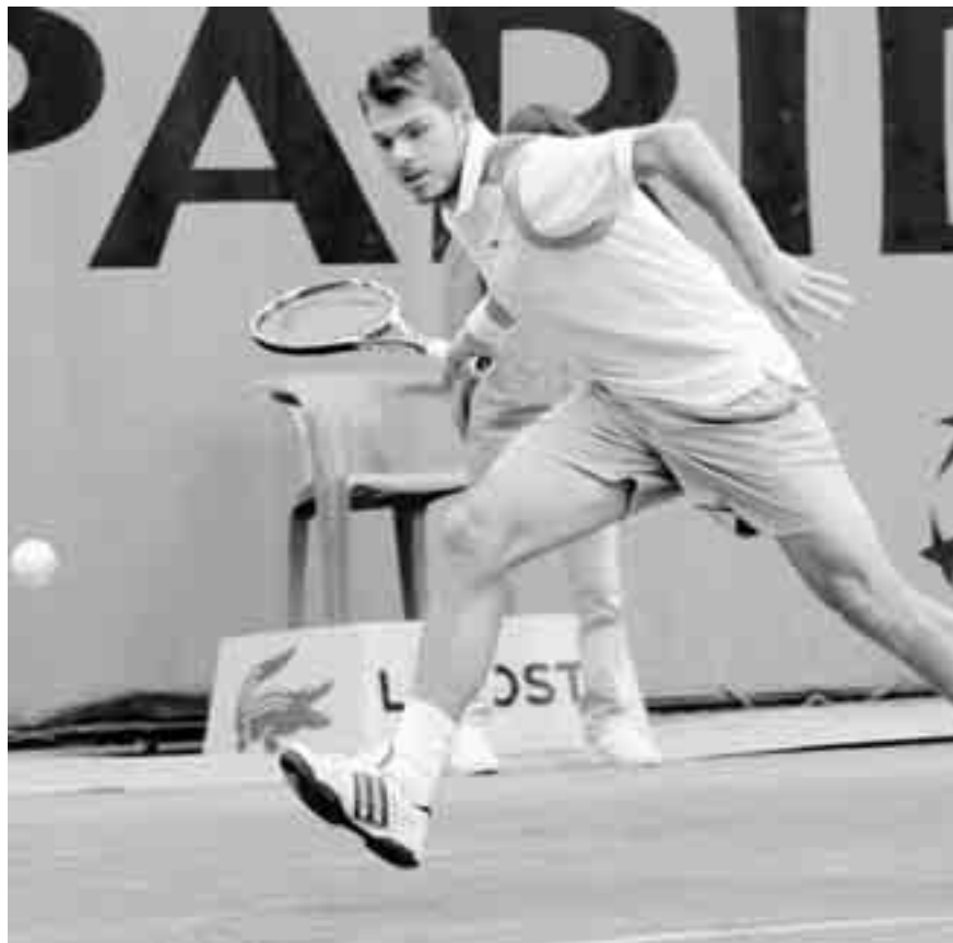
Davvero una prova autoritaria per Stanislas Wawrinka.