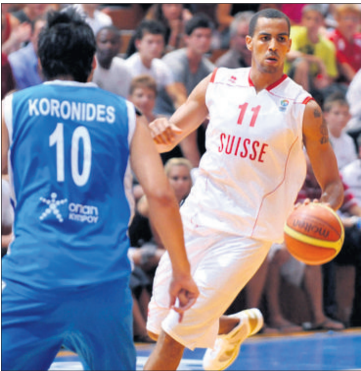
Thabo Sefolosha. «Cette victoire nous fait du bien moralement.»