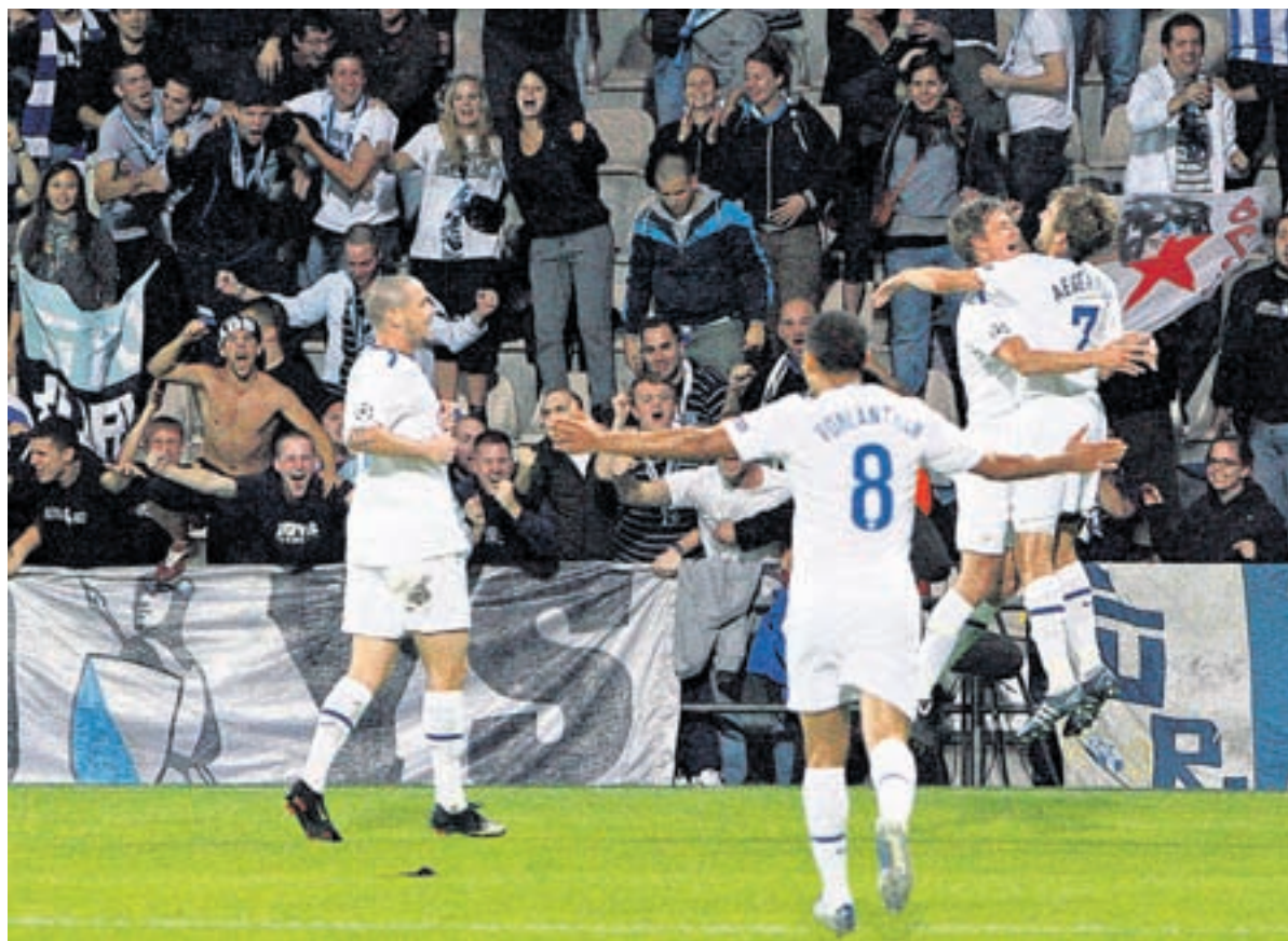
Kollektiver Jubel. Die FCZ-Spieler feiern zusammen mit den mitgereisten Supportern den Auswärtserfolg.

In Dortmund. Borussia Dortmund-Real Madrid 0:5. - Tore: 3. Granero 0:1. 48. Robben 0:2. 73. Higuain 0:3. 76. Kaka (Foulpunkt) 0:4. 89. Raul 0:5. - Bemerkung: Anlass des Spiels war das 100-Jahr-Jubiläum von Borussia Dortmund.