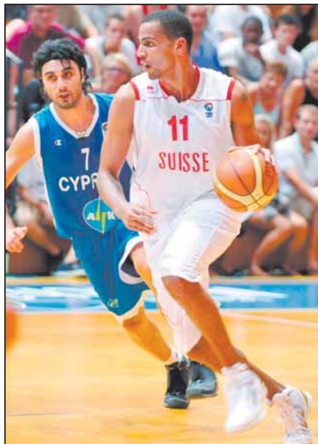
Sefolosha n'est pas trop inquiet par Sizopoulos.

Championnat d'Europe de Division B. Groupe B, 6e journée: Suisse-Chypre 55-54 (24-25). Roumanie - Biélorussie 70-78 (37-46). Classement: 1. Biélorussie 5 matches/5 victoires. 3. Suisse 5/3. 4. Suisse 5/2. Albanie 5/2. 5. Roumanie 6/2.