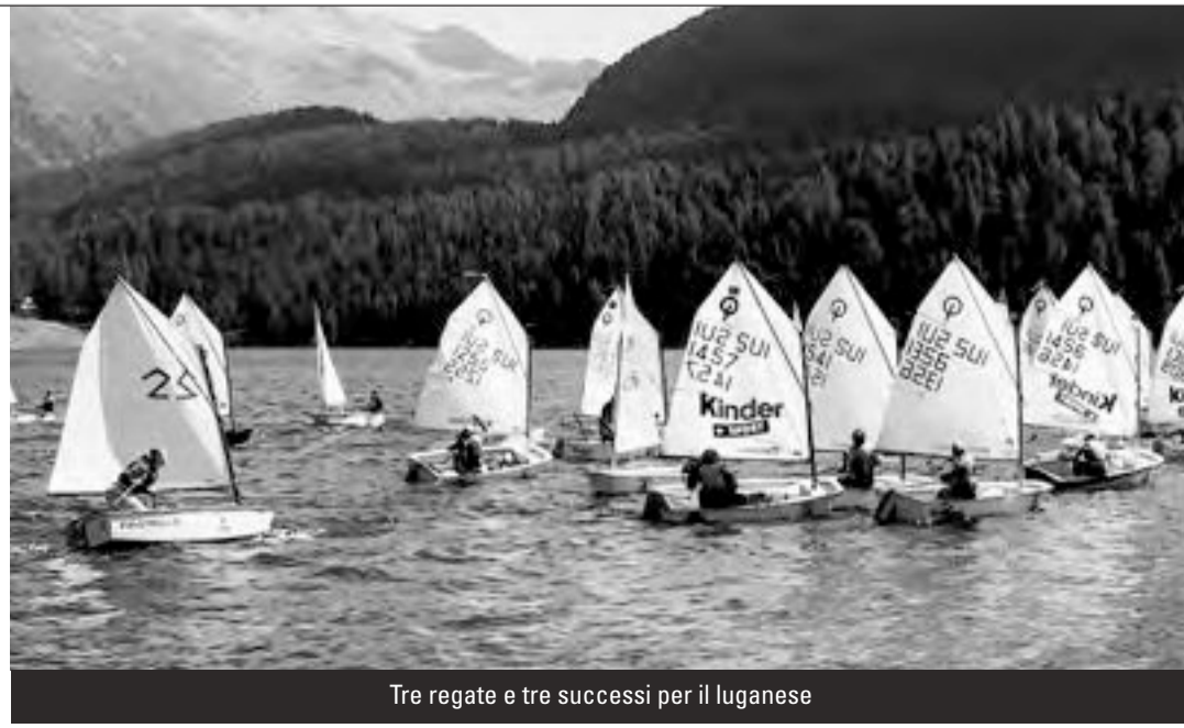
Tre regate e tre successi per il luganese

Domenica le condizioni meteo non favorevoli (vento levato solo dopo il tempo limite) hanno indotto all'annullamento delle prove in programma, rendendo definitiva la classifica dopo la prima giornata.