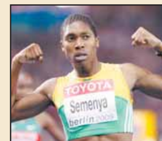
Caster Semenya. Une femme ou... un homme?

100 m haies (+0,2 m/s): 1. Brigitte Foster-Hylton (Jam) 12"51. 2. Priscilla Lopes-Schliep (Can) 12"54. 3. Delloreen Ennis-London (Jam) 12"55. 4. Derval O'Rourke (Irl) 12"67. 5. Sally McLellan (Aus) 12"70.