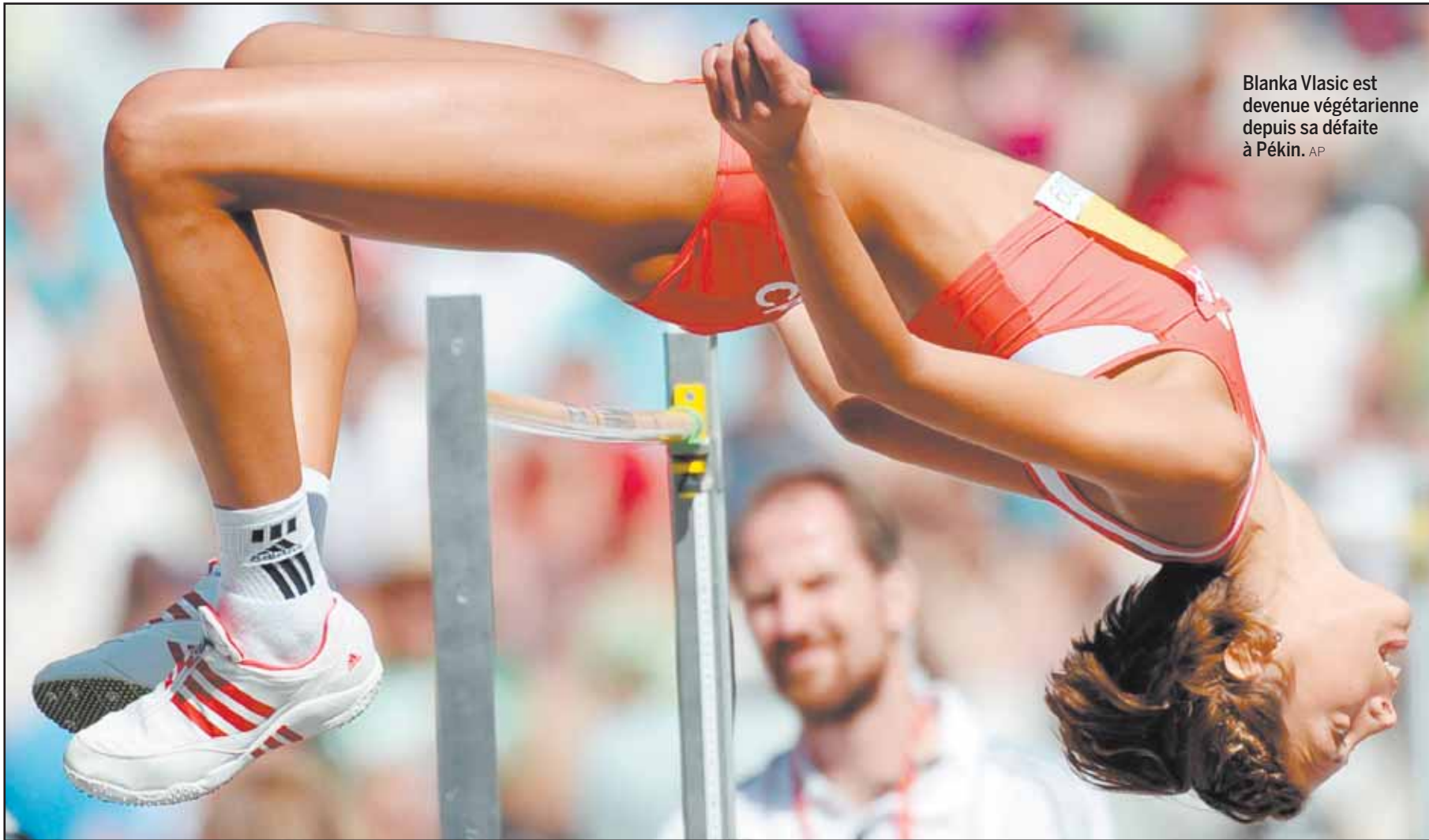
Blanka Vlasic est devenue végétarienne depuis sa défaite à Pékin. AP