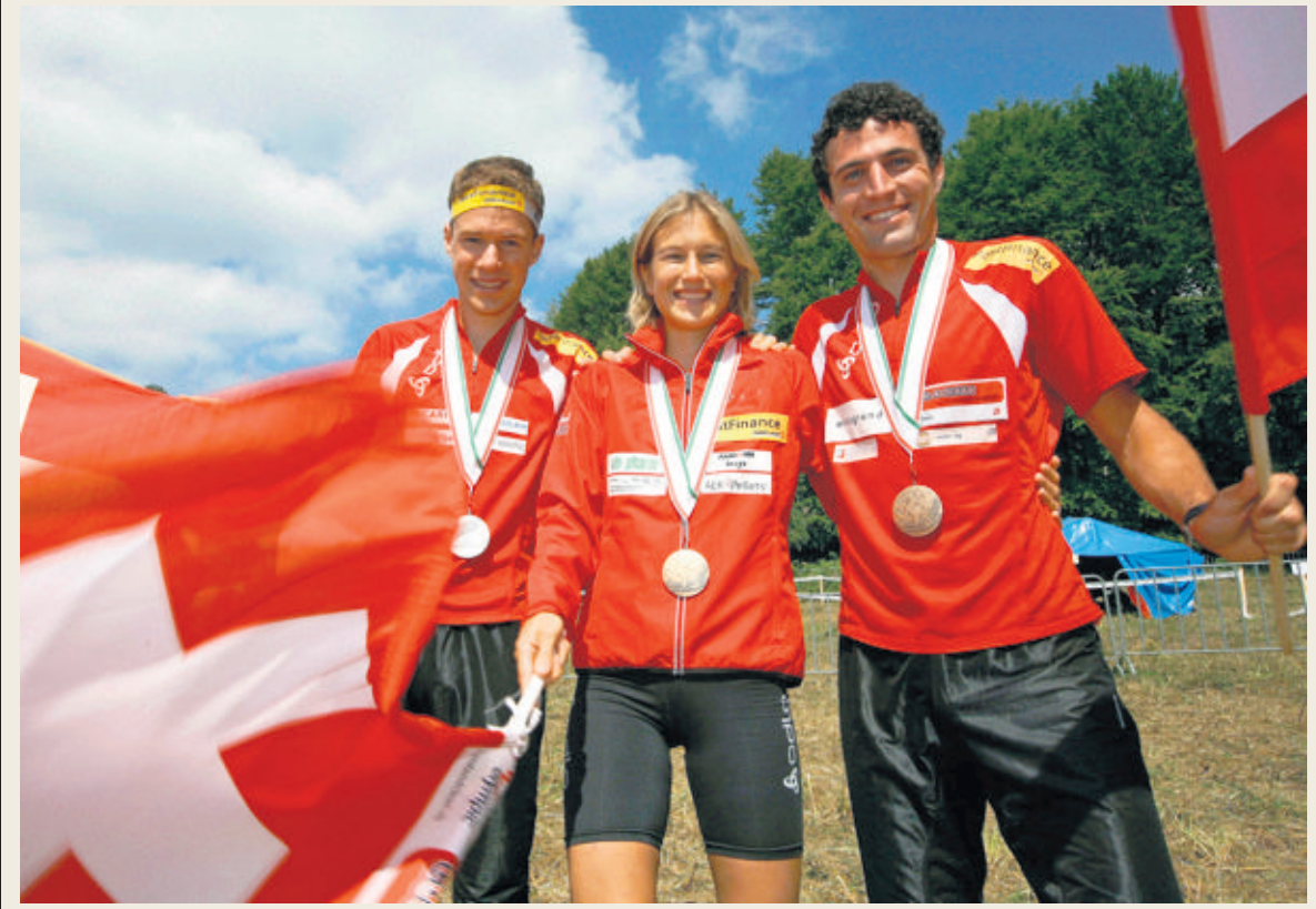
De gauche à droite: Daniel Hubmann, Simone Niggli et Matthias Merz.