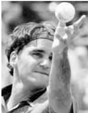
Federer ora troverà Ferrer.

Roger Federer ha gestito al meglio la sua entrata in materia nel Masters 1000 di Cincinnati. In Ohio, il numero uno mondiale ha infatti battuto l'argentino Jose Acasuso (ATP 51) 6-3 7-5. Il prossimo avversario, negli ottavi di finale, però non sarà altrettanto tenero, visto che si tratta dello spagnolo David Ferrer (ATP 19). Federer ha dato l'idea di aver digerito al meglio la frustrante sconfitta della scorsa settimana, a Montréal, contro Tsonga, e infatti di fronte ad Acasuso non ha mai davvero tremato. Unica piccola eccezione quando il suo avversario si è procurato una palla di break sul 2-3 nel secondo set. Il basilese ha allungato dapprima sul 4-3 del primo set, poi sul 5-5 del secondo. Con 14 ace, Federer si è dunque imposto in un'ora e 10' contro un argentino che gli aveva offerto molti più problemi in occasione dell'ultimo Roland Garros: lì Roger si affermò solo dopo 3h25' col risultato di 7-6 5-7 7-6 6-2. Ora quindi sotto con Ferrer, che al primo turno aveva eliminato Stanislav Wawrinka e poi il croato Marin Cilic.