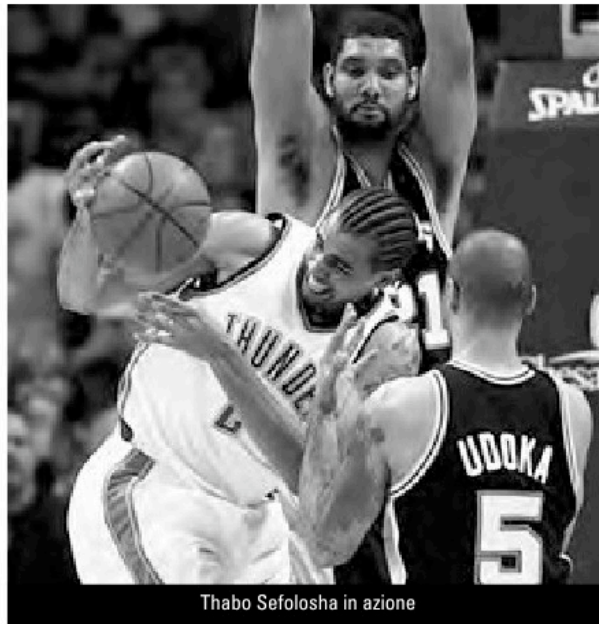
Thabo Sefolosha in azione

In questa stagione, il Thunder punta a maturare, lentamente ma sicuramente. «I dirigenti non hanno fissato degli obiettivi precisi. È piacevole poiché avremo il tempo di progredire, visto che solo tra qualche anno tutti avranno pienamente raggiunto il loro potenziale. Ognuno sa di possedere un grande margine di progressione e che lavorando ci possiamo arrivare. A partire da questo, bisogna dunque impegnarsi di conseguenza».