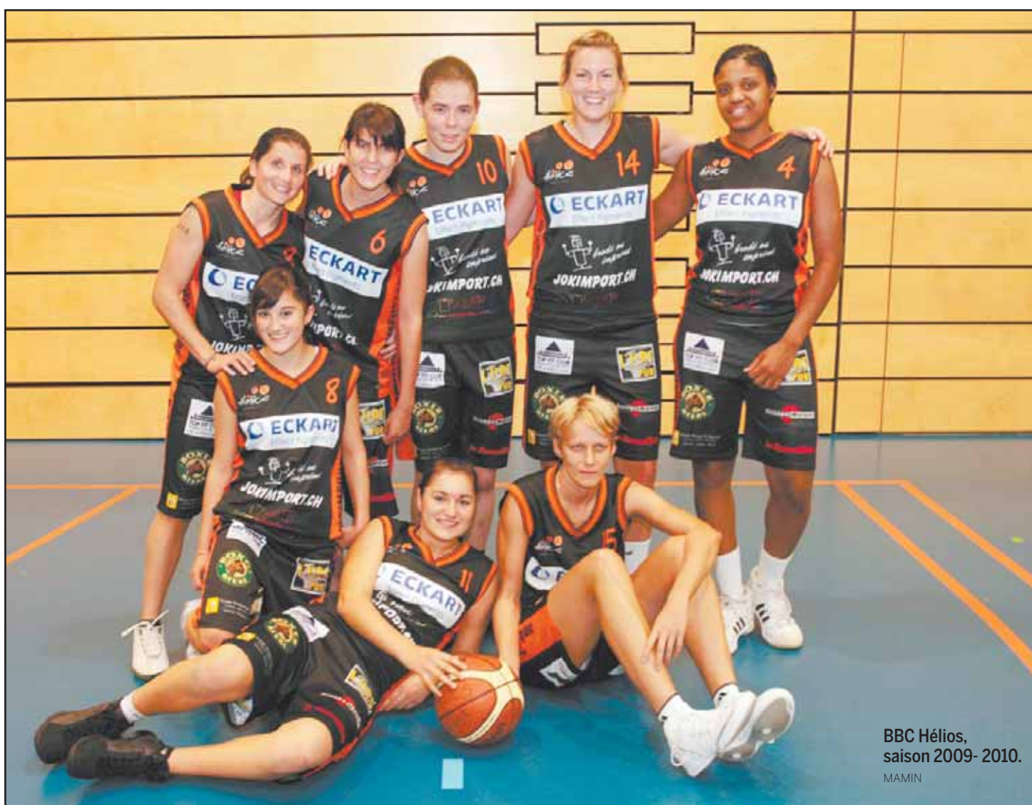
BBC Hélios, saison 2009-2010.

Autre objectif avoué, intégrer au mieux les jeunes joueuses. « Il est important de bien les encadrer. Nous souhaitons aussi qu'elles s'identifient au club, qu'elles soient motivées à venir s'entraîner et qu'elles restent le