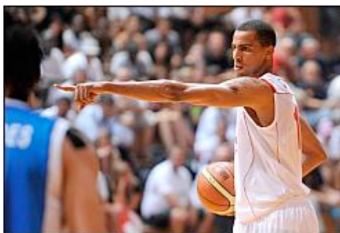
L'ailier international veut briller pour sa nouvelle franchise.

Outre les deux Américains, Sefolsha est tout spécialement proche du Congolais Serge Ibaka. «J'ai déjà passé beaucoup de temps avec lui. Comme il ne parle pas encore très