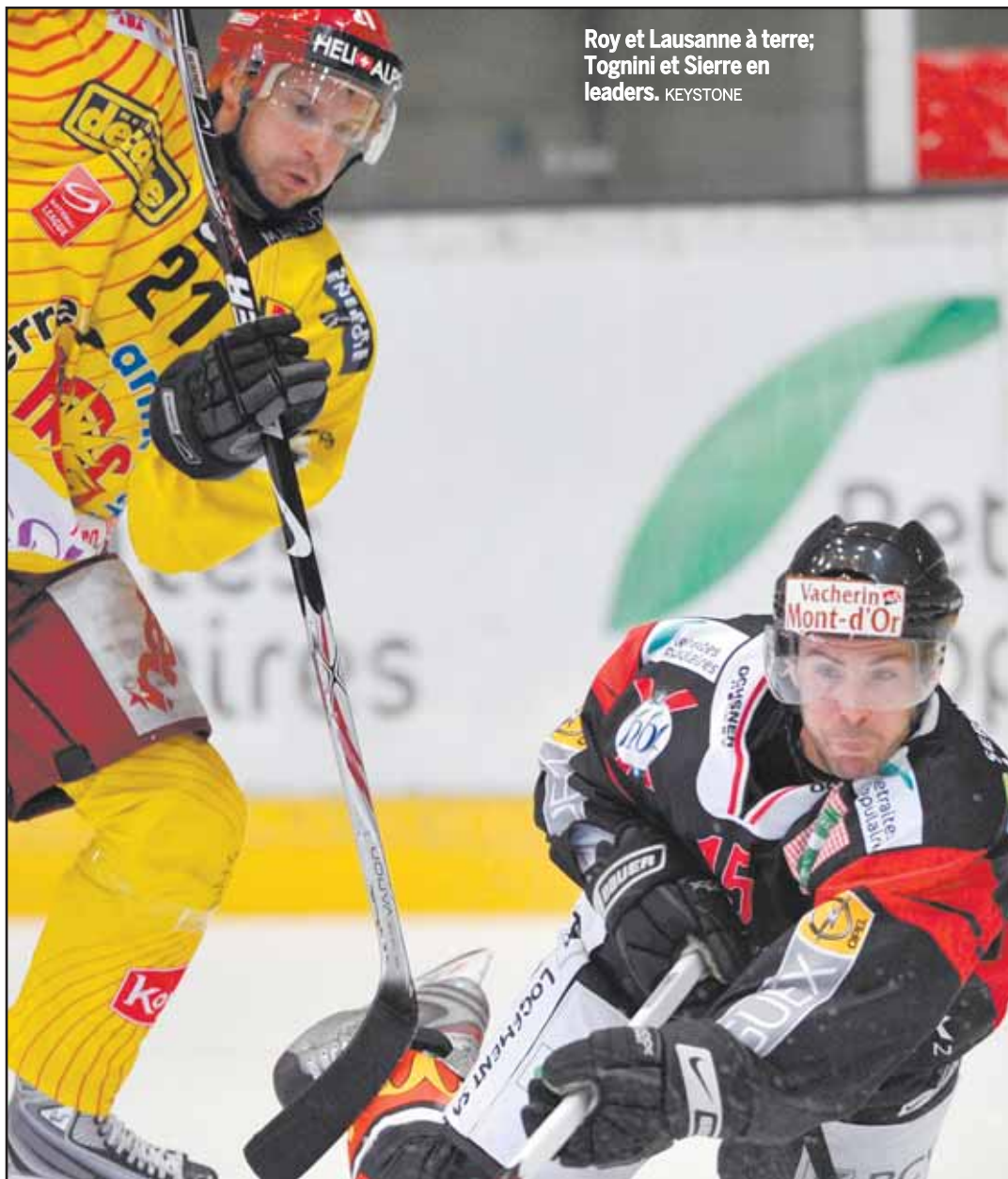
Roy et Lausanne à terre; Tognini et Sierre en leaders.

LAUSANNE-SIERRE-ANNIVIERS 1-4 ► Sierre confirme qu'il n'est pas un leader au rabais. Il réalise une performance remarquable à Lausanne, le favori en LNB.