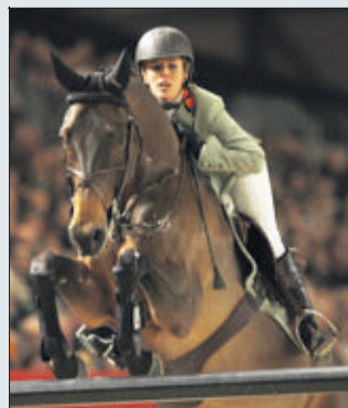
Meredith Michaels Beerbaum. Une habituée de Palexpo.

■ Participation. La crème du saut d'obstacles figurera in corpore parmi les 45 cavaliers finalistes. Dont la tenante du titre, Meredith Michaels Beerbaum, le champion olympique Eric Lamaze (Can), le champion d'Europe Kevin Staut (Fra) ou le Brésilien Rodrigo Pessoa. Champions d'Europe par équipes, les quatre cavaliers suisses devront se classer dans 18 premiers de la Ligue d'Europe de l'Ouest pour être de la fête.