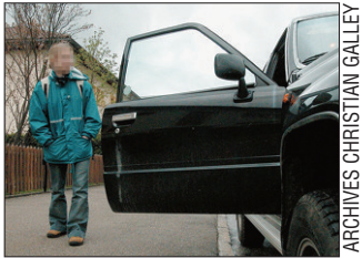
ARCHIVES CHRISTIAN GALLEY