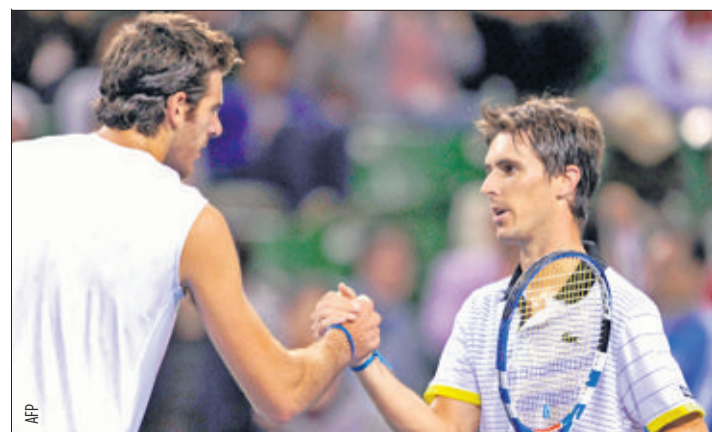
Le géant Del Potro a subi la loi du Français Roger-Vasselin.

■ PATTY SÈCHEMENT BATTUE Patty Schnyder n'a eu aucune chance au 2e tour du tournoi de Pékin. Face à la Polonaise Agnieszka Radwanska (WTA 11), la Bâloise s'est sèchement inclinée 6-4 6-1. Il y a deux jours, la gauchère avait pris le meilleur sur la sœur d'Agnieszka, Ursula. Schnyder n'a cette fois pu s'accrocher que durant la première manche face à la quart de finaliste du dernier Wimbledon. Avec un total de 34 erreurs non provoquées, la Bâloise – retombée au 48e rang mondial – n'a pas pesé lourd dans les débats en deuxième manche. ■