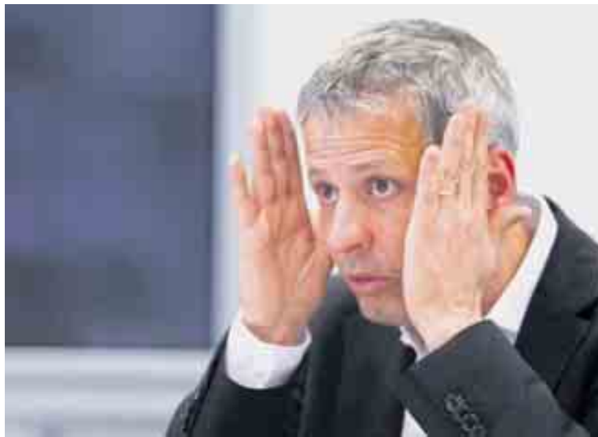
Lucien Favre, 51 anni, vuole soltanto guardare avanti.

tolari inamovibili. Non potevamo tenerli semplicemente per motivi economici. Per gli acquisti non avevamo che 2,9 milioni di euro. Era un po' la stessa situazione vissuta a Zurigo nel 2003/2004. A Natale eravamo ultimi, ma poi arrivammo quarti». In Germania però tutto va più veloce. Non è la Svizzera. La pressione mediatica era troppo pesante. «Non solo per me, ma per tutti nel club». Favre comunque ha un contratto valido sino al 2011, ma parrebbe che si sia trovata la buonuscita attorno ai due milioni di franchi. Il vodese si è rifiutato di confermare. Lo stesso Favre non si aggrappa più di tanto alle attenuanti e riconosce un suo torto: aver accettato troppi compromessi da quando è arrivato sulla panchina dell'Hertha nel luglio 2007. «Non si costruisce una squadra con le idee degli altri. È stato il mio grande errore. Saprei ricordarmi la lezione in futuro». L'altro errore che ha commesso è stato quello di non firmare con il ricco Wolfsburg questa estate. I campioni tedeschi gli avevano offerto il posto del partente Magath.