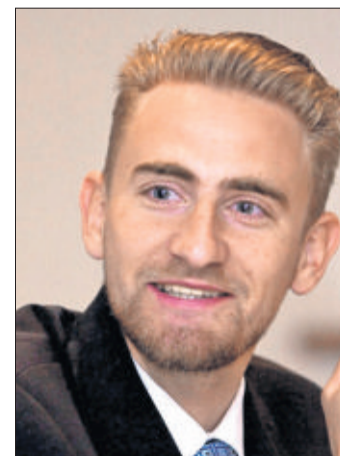
Frank Vandembroucke. D c d 34 ans.

En 2005, il avait tenté de mettre fin à ses jours. A la recherche d'une équipe, il avait assuré ces derniers jours vouloir revenir dans le peloton, estimant être encore capable de gagner des courses.