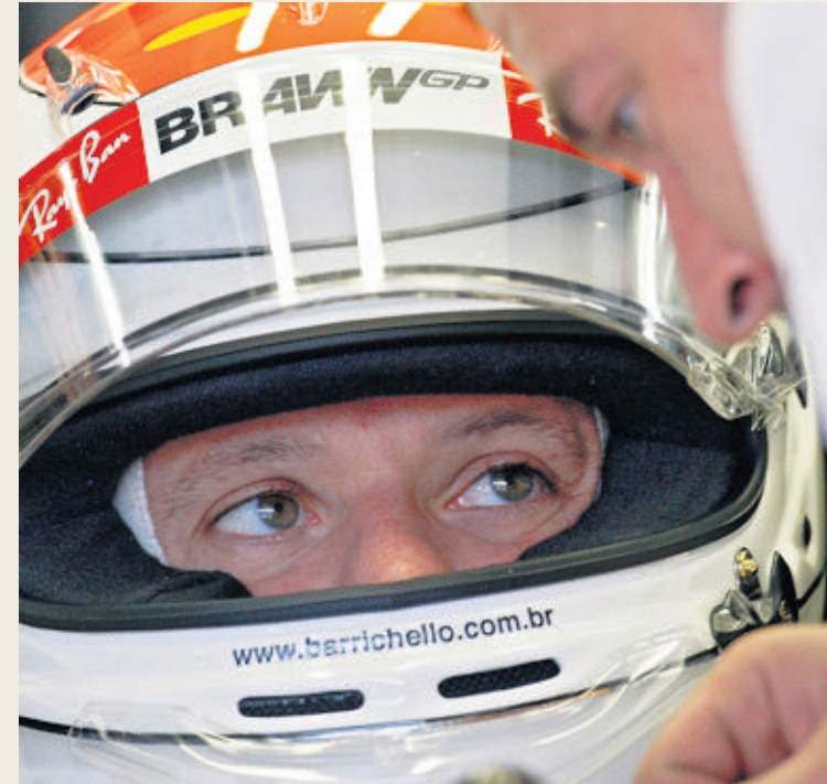
Rubens Barrichello: en piste pour Williams dès la saison 2010.

Rubens Barrichello s'est engagé avec l'écurie Williams et quittera Brawn GP à l'issue de la saison 2009, affirme la presse brésilienne. Le pilote brésilien «a déjà signé son contrat avec Williams pour la saison 2010, avec une option – pour les deux parties – de prolonger l'accord une année de plus», a annoncé le quotidien Folha de São Paulo. Rubens Barrichello touchait un salaire de 2 millions au sein de l'écurie Brawn. Chez Williams, cette somme devrait être multipliée par quatre, en plus d'une prime pour chaque victoire. Barrichello, qui compte 71 points, est actuellement deuxième au classement des pilotes derrière son coéquipier, le Britannique Jenson Button (85 points). Le transfert devrait être annoncé officiellement après le Grand Prix du Brésil, samedi à São Paulo. Son nouveau coéquipier devrait être l'Allemand Nico Hulkenberg, 22 ans, qui est aujourd'hui le pilote essayeur chez Williams. ■ si