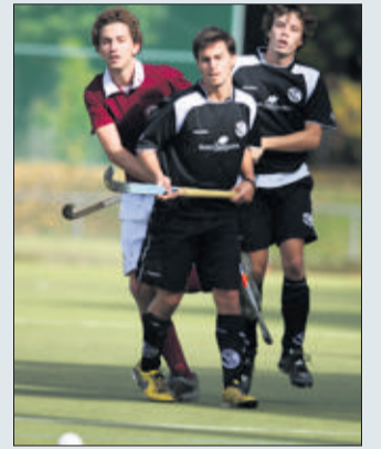
Vite joué. Entre «Grenat» et hommes en noir, il n'y a pas eu photo.

Black Boys: Fenner; Goumaz, M. Apothéloz, Pourrat, Foulk; Tommasi, M. Olivieri, Betti; Aebischer, Aguilar, Bertossa. Ont galement joué: Q. Olivieri, B. Apothéloz, Gual.