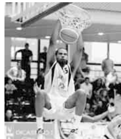
"Schiaccione" di Abukar. (fotogonnella)