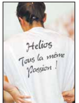
Passion, oui. Mais à montrer sur le terrain. HOFMANN

► L'adversaire: «Nous avons remporté notre première confrontation au début novembre (ndlr: 79-72), notre seul succès cette saison. On connaît bien les Vaudoises, je les ai d'ailleurs encore vues la semaine dernière contre