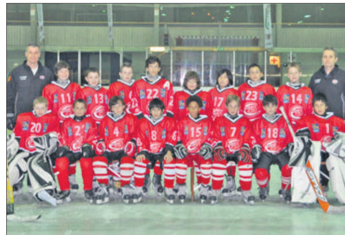
HC Trois-Chêne. Ces jeunes joueurs vont vivre une expérience mémorable.