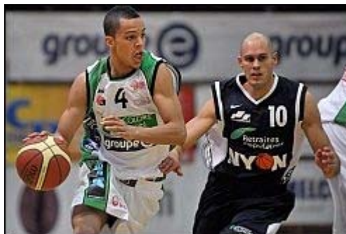
Nyon n'a pas résisté face à Fribourg Olympic.

Dominateurs en début de rencontre, les Fribourgeois ont bouclé le premier quart-temps avec une marge confortable de quatorze points. Un écart que Nyon allait peu à peu réduire, jusqu'à passer en tête en tout début de deuxième mi-temps. Loin de paniquer, Olympic reprenait le match à son compte et ne le laissait plus filer.