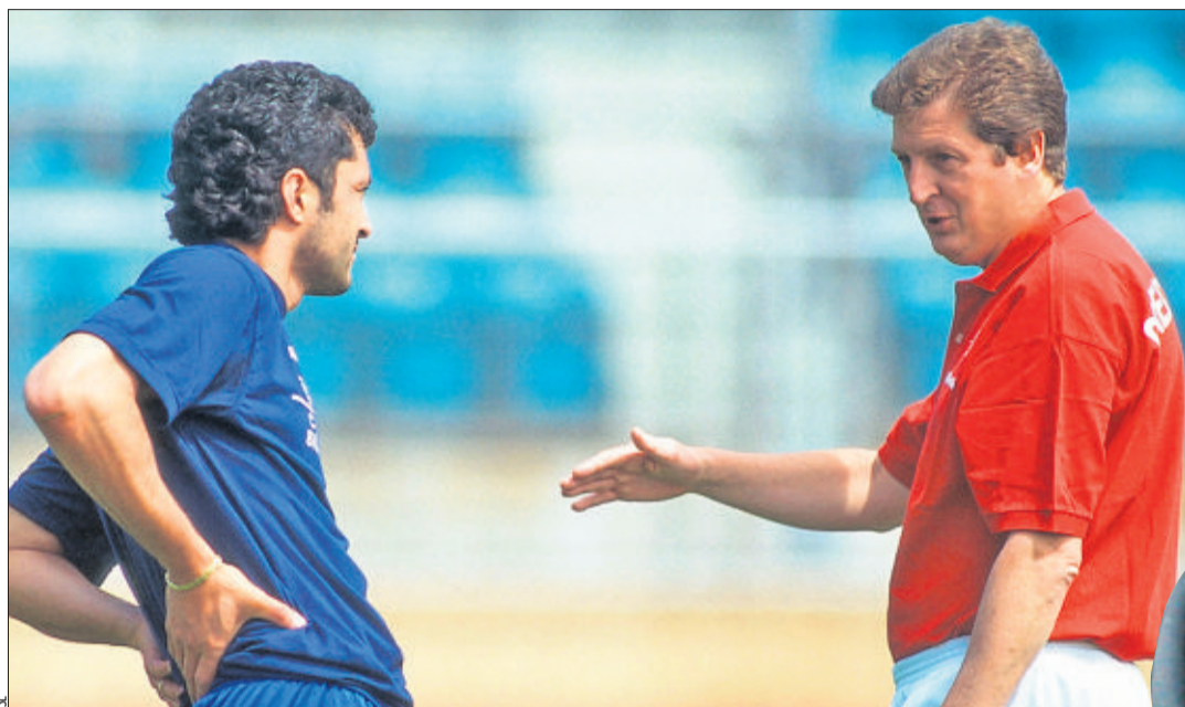
Roy Hodgson en pleine discussion avec Kubilay Türkyilmaz avant Suisse-Italie (0-1) le 19 juin 1995, à la Pontaise.

Narrer ces faits de gloire c'est rappeler que la Suisse était servée de rendez-vous majeurs depuis vingt-huit ans. C'est aussi souligner la fragilité et la relativité de la vie. Appliquées au parcours d'un entraîneur, ces notions prennent une résonance particulière, la renommée épousant une courbe de forme sinusoidale. S'agissant de Roy Hodgson, le raccourci est saisissant. Précédé d'une solide réputation