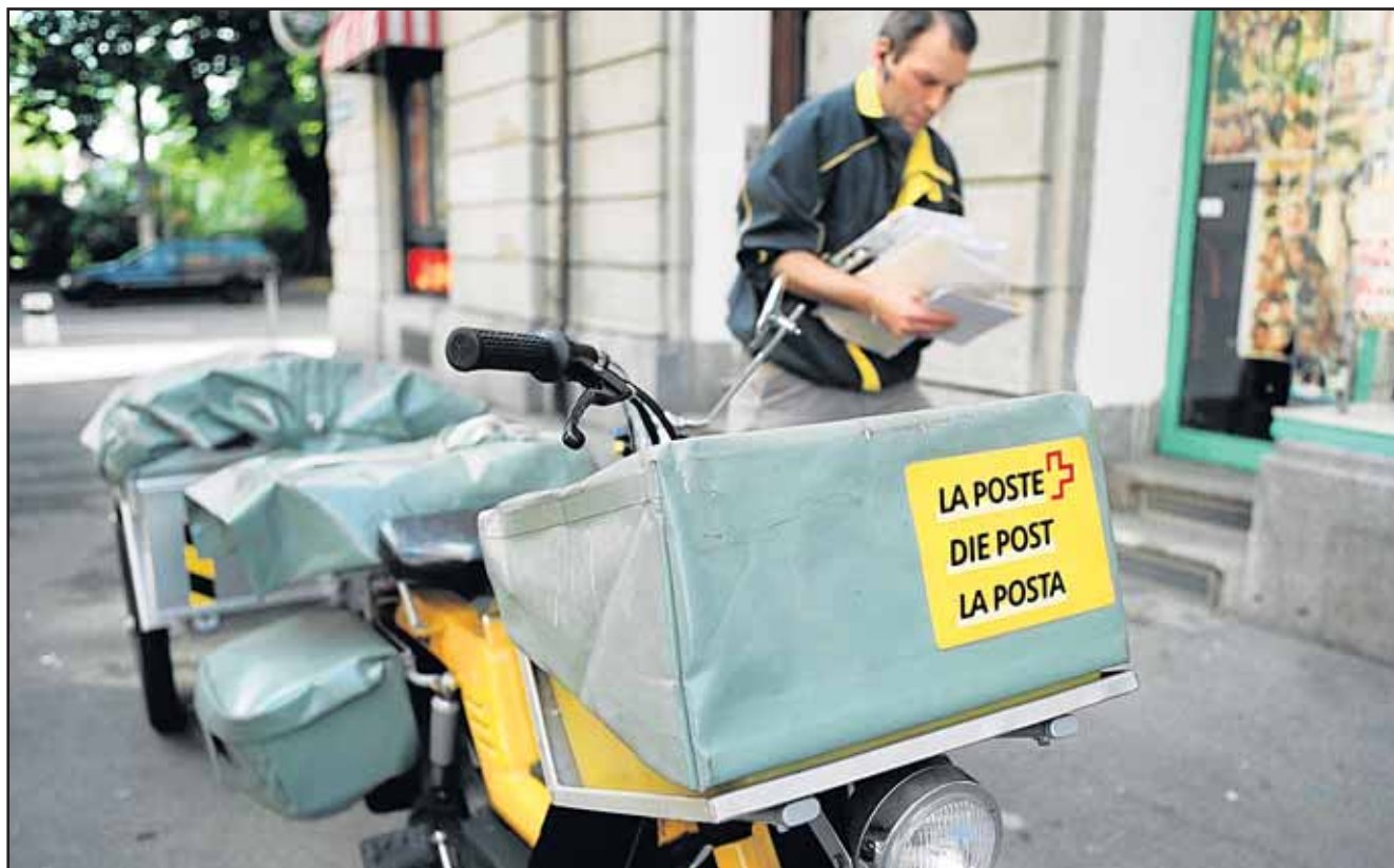
Coup de sac à La Poste: la nouvelle direction veut donner davantage d'autonomie aux différentes unités du géant jaune.