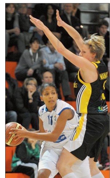
Caroline Turin et Nyon ont fait plus que résister face à Saarlouis. Elles espèrent vaincre Ibiza ce soir. A. Voelin