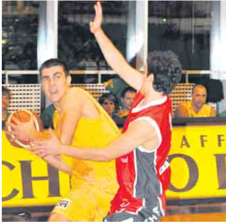
La SAV Vacallo di Lukovic (a sinistra) ha staccato il biglietto per la semifinale. (Demaldi)