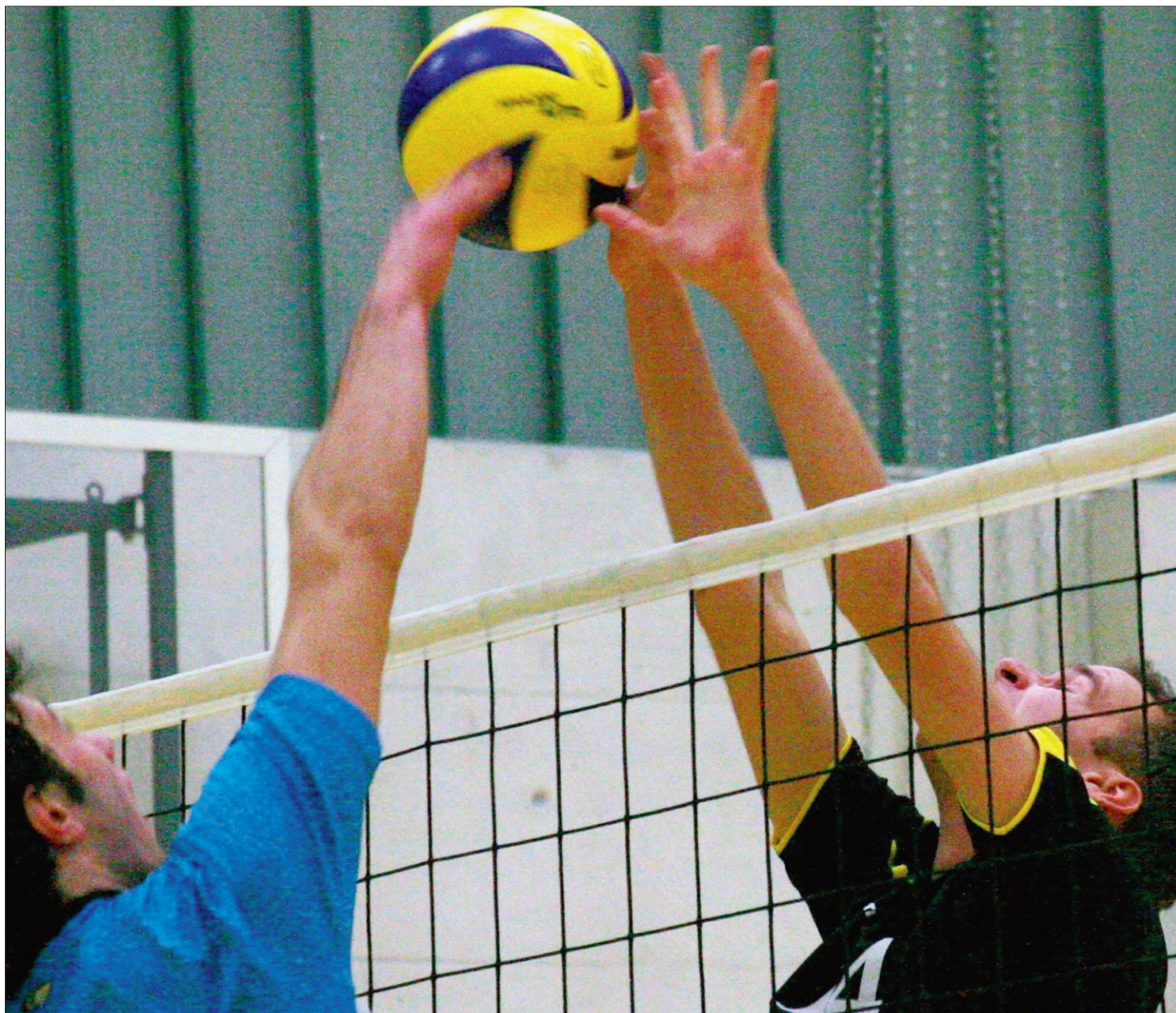
Ganz (en noir) et les Aubonnais, pourtant derniers du classement de 1 re ligue, ont fait douter Chênois, le leader, vendredi à Pré-Baulan. Céline Reuille

Les «noir et jaune» entamaient la seconde manche sur un rythme plus soutenu et régattaient en tête. Littoral servait mieux et le bloc parvenait enfin à retenir les frappes des ailiers genevois. Mais Chênois grappillait point après point, revenant à égalité à 18 partout, pour s'adjuger une balle de 2 e set. Littoral ne tremblait pas, renversait la tendance et s'octroyait la seconde manche sur le fil (26-24). On a enfin réussi à gagner un set au coude à coude, s'amusait Baumgartner. C'est plutôt réjouissant, sachant que c'est la première