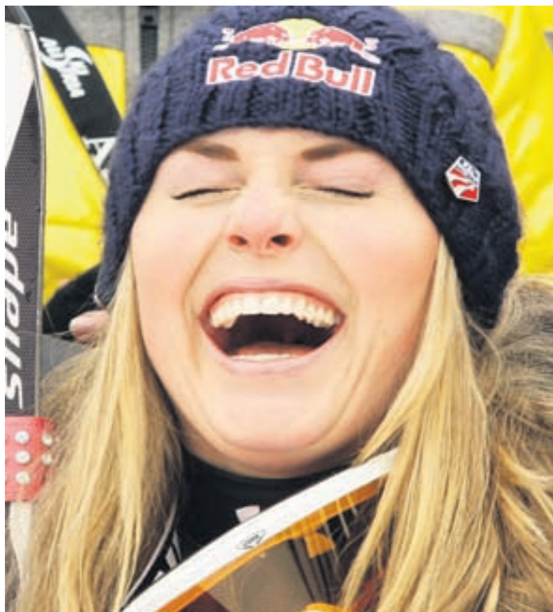
Freude herrscht. Benjamin Raich und Lindsey Vonn hatten in dieser Saison schon reichlich Grund zum Feiern und zum Lachen.