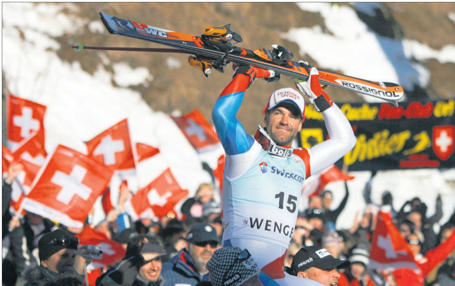
JOUR DE GLOIRE Didier Défago porté en triomphe après sa victoire sur la descente du Lauberhorn. Le Valaisan remettra le couvert une semaine plus tard sur la Streif! La pression sera sur ses épaules ce week-end. WENGEN, LE 17 JANVIER 2009