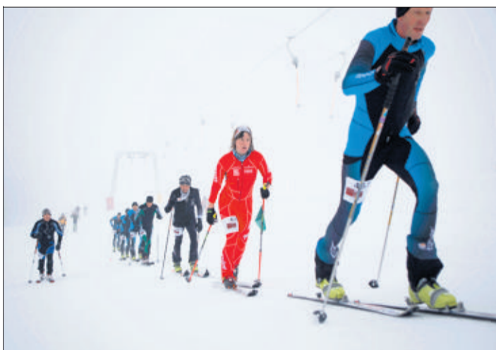
279 coureurs ont pris le départ de ce 3 e Vertical Trophée, malgré des conditions climatiques loin d'être idéales.