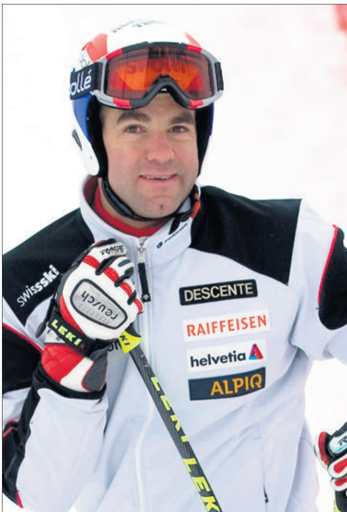
Didier Défago. Le Valaisan s'efforce de ne pas rester prisonnier de ses souvenirs.

En ce sens, Défago s'efforce de ne pas rester prisonnier de ses souvenirs, expliquant qu'il a eu suffisamment de temps cet été pour profiter et jubiler. Comme s'il avait tourné la page après avoir inauguré sa