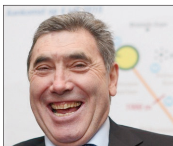
HONNEUR Eddy Merckx sera honoré par le Tour.

La première étape, le 4 juillet, reliera Rotterdam à Bruxelles. L'arrivée sera jugée au bout d'une ligne droite de 1600 mètres à l'ombre du stade Roi Baudouin. «Je remercie ASO. Pour l'honneur qui m'est fait, bien sûr, mais aussi pour