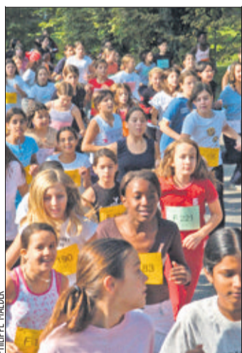
Les femmes courent avec plus de légèreté sur les terrains glissants.

Le Cross de Vidy essaie aussi d'attirer la gent féminine. Les concurrentes représentent près d'un tiers du peloton. «Par rapport aux hommes, les femmes se déplacent avec plus de légèreté et d'élégance, poursuit Raymond Corbaz. Elles ne courent pas en force. Cette discipline