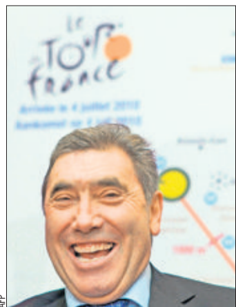
Eddy Merckx fêtera ses 65 ans cette année.

«Je remercie l'organisation du Tour pour l'honneur qui m'est fait, bien sûr, mais aussi pour