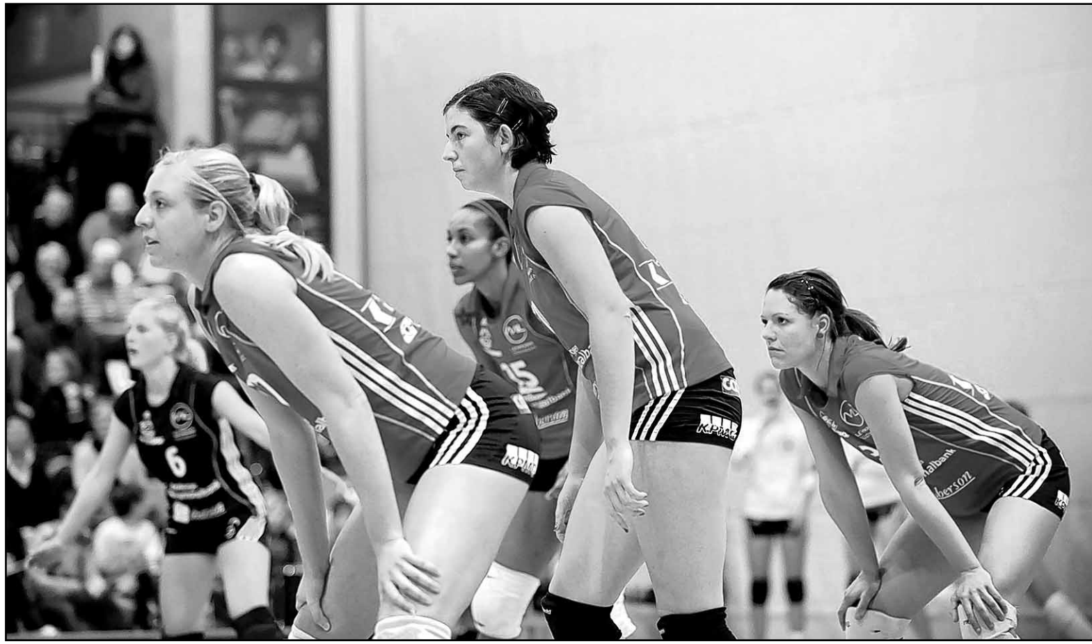
A l'affût, les Singinoises se préparent à disputer les play-off. CORINNE AEBERHARD

LNA DAMES • Avec leur nouvelle Américaine, les Singinoises s'imposent en trois sets secs à Bienne. Leur place en play-off est assurée, trois rencontres avant la fin.