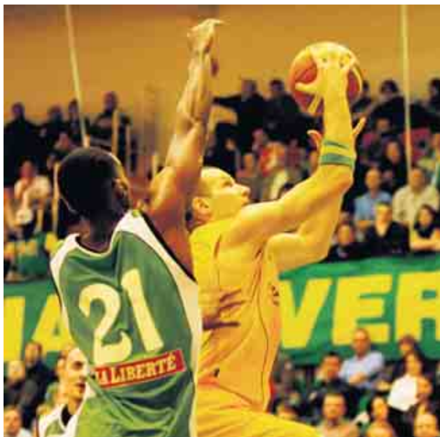
Neppure un Draughan già performante è riuscito a frenare la SAV in semifinale. (Gonnella)

Starwings - SAV Vacallo 10 aprile a Friborgo