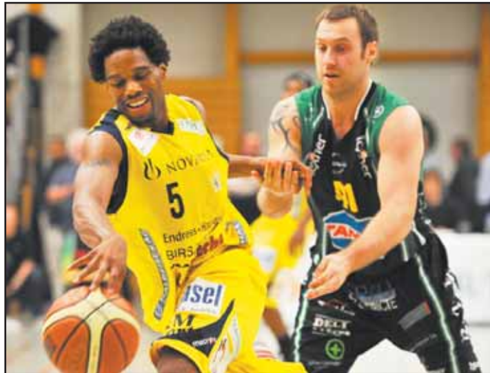
Brown échappe à Porchet. Starwings était trop fort.