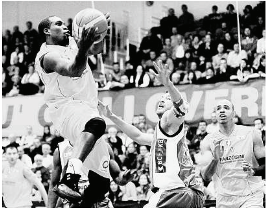
IN EVIDENZA Gibson della SAV (a sinistra) cerca il varco giusto nella difesa ospite.