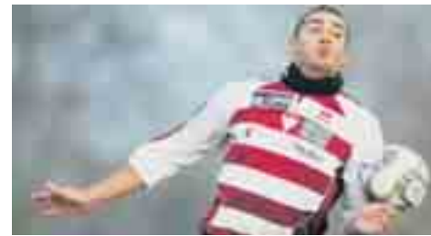
Censi; Sermeter, Lustrinelli, Mijatovic. BELLINZONA, 2° TEMPO: Zotti; Siqueira-Barras, Lima, Mangiaratti, Thiesson; Hima, Edusei, Mehmeti; Feltscher, Ciarrocchi, Conti. NOTE: arbitro Ferrari.

Bellinzona - Team Ticino 2-0 RETI: 62' Ciarrocchi 1-0; 88' Conti (rigore) 2-0. BELLINZONA, 1° TEMPO: Gritti; Djuric, La Rocca, Cinquini, Raso; Ciaramitaro, Kasami, G.