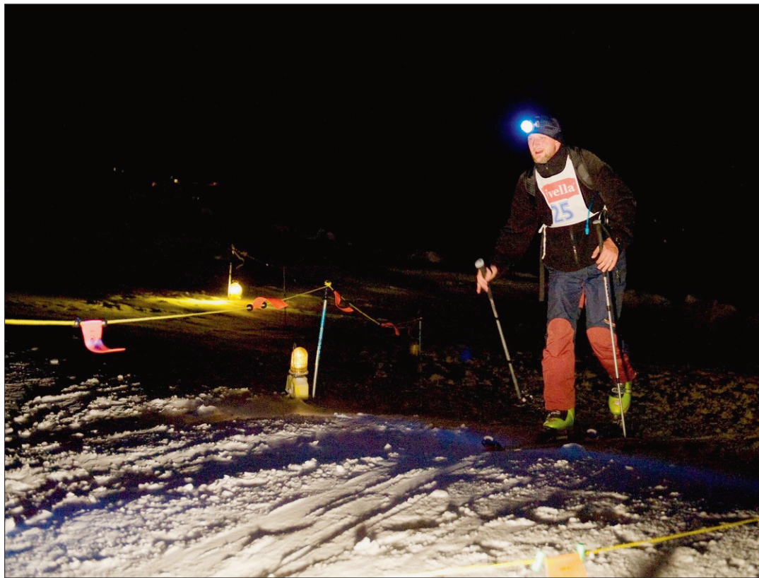
DANS LA NUIT Le Trophée du Chasseral, une véritable aventure!

Les raquetteurs ne sont pas en reste. Seule différence avec les skieurs, ils éviteront la descente et rejoindront l'hôtel du Chasseral en longeant la crête depuis l'antenne. Les 4,15 km de long et les 670 m de déni-