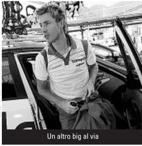
Un altro big al via

Sabato il GP Insubria (181 km) scatterà alle 10.30 da Campione d'Italia per concludersi alle 14.50 circa a Pieve Vergonte nella provincia Verbano Cusio Ossola. A Lugano (178 km) partenza da Piazza Riforma alle 11.30 e dopo avere percorso 15 giri previsti (GPM ad Albonago) l'arrivo avverrà sul lungolago (Piazza Manzoni) alle 15.55 circa.