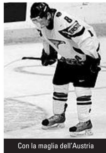
Con la maglia dell'Austria

Ha inoltre disputato i Mondiali Under 18 e Under 20 con l'Austria, risultando nel 2008 il miglior difensore del torneo U18 (del quale fu anche il mi-