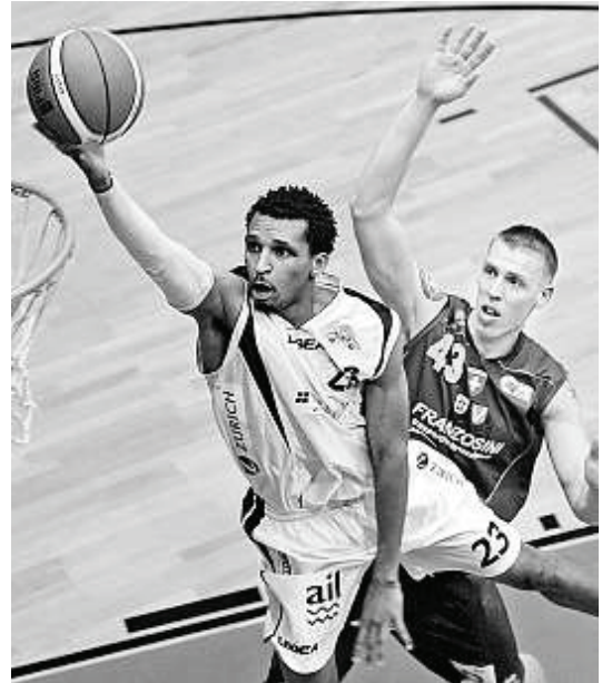
A PRESTO... Efeverberha (a sin.) batte in entrata Schneidermann. Entrambe le squadre si augurano di incontrarsi sabato. (fotogonnella)