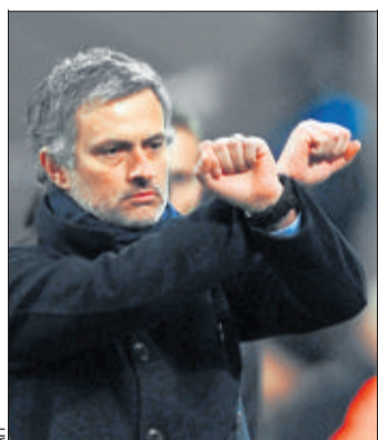
Mourinho , des mains menottées qui suscitent la polémique.

Voilà pour le dernier épisode d'une saga qui pourrait s'intituler «Mourinho contre le reste de l'Italie». Car depuis son arrivée en 2008, celui que les Anglais surnomment «Special One» est en train de se mettre la péninsule à dos. Le charme de ce beau ténébreux, qui agissait au cours de ses premières semaines, s'est très vite estompé au fur et à