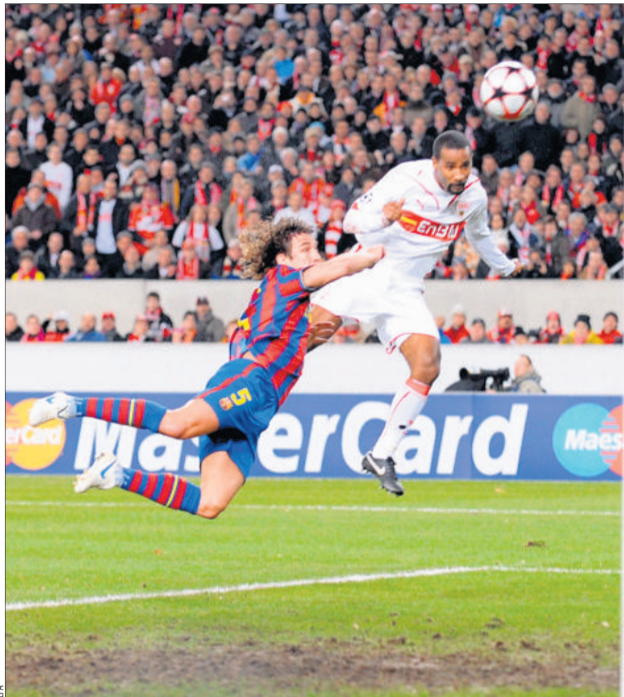
OUVERTURE DU SCORE Cacau a inscrit un superbe but de la tête pour Stuttgart. Mais les Allemands n'ont pas pu conserver leur avantage face au Barça. STUTTGART, LE 23 FÉVRIER 2010

Cette réussite modifiait totalement le scénario de la partie: