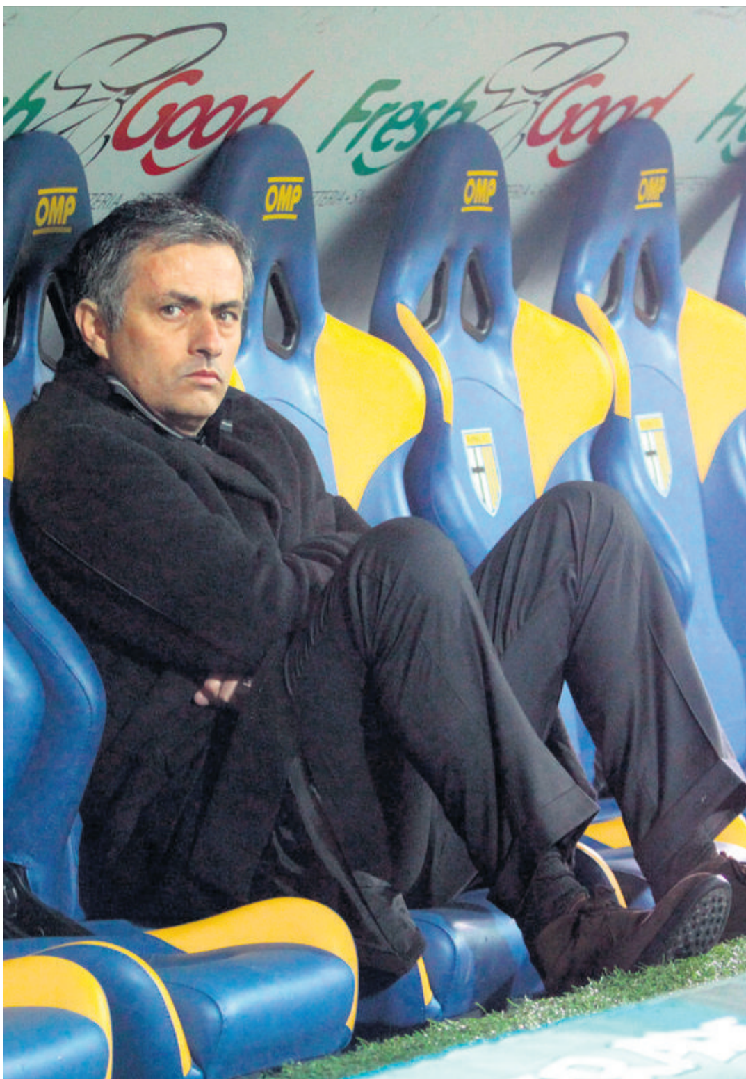
Jose Mourinho. Seul et contre tous, ou presque, le Portugais est la cible de toutes les critiques en Italie. Il sait néanmoins qu'un exploit contre Chelsea ferait taire ses détracteurs.