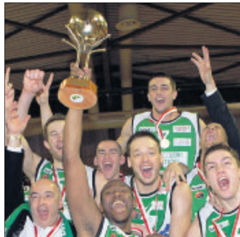
Fribourg Olympic a conservé son bien, pour un seul petit point.

■ Dames, finale: Nyon - Sierre 55-60 (23-44).