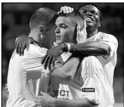
En inscrivant le premier but, Ben Arfa a mis l'OM sur la bonne voie.

Auteur des deux buts de Stuttgart contre Eintracht Francfort (2-1), Cacau a mis un terme à une semaine de folie durant laquelle il a marqué sept fois. Cette nouvelle victoire de l'équipe dirigée par Christian Gross lui permet d'occuper désormais le 8 e rang. SI