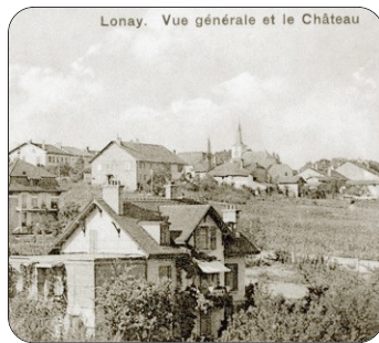
Lonay. Vue générale et le Château