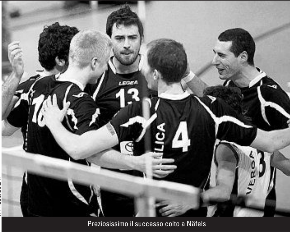
Preziosissimo il successo colto a Näfels

Chiusura di stagione con vergogna per il Bellinzona, che lascia mesta la LNA dopo aver concesso un forfait che chiude sul 3-0 a favore del Toggenburgo il playoff contro la relegazione. Sotto 2-0 nella serie, le bellinzonesi non si sono presentate in trasferta per gara-3.