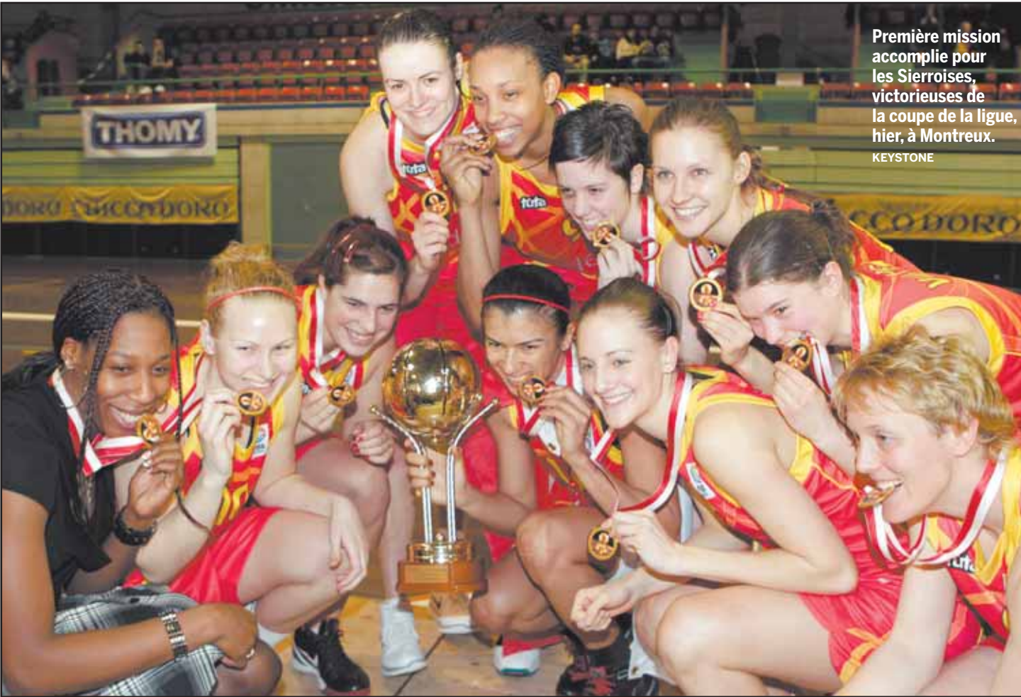
Première mission accomplie pour les Sierroises, victorieuses de la coupe de la ligue, hier, à Montreux.