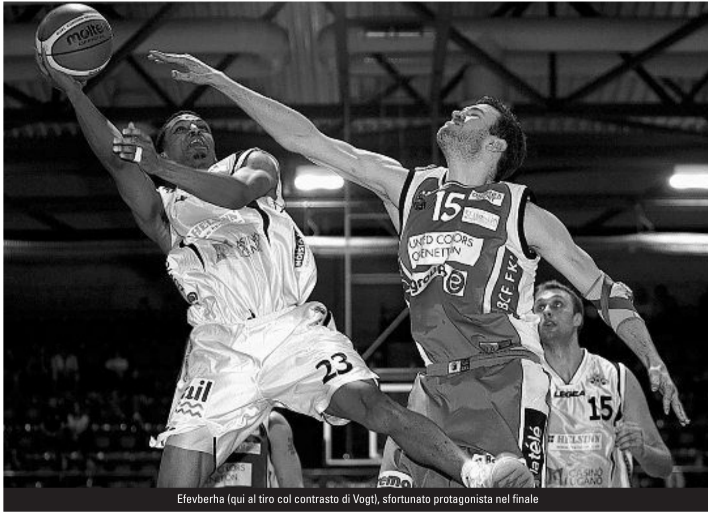
Efevberha (qui al tiro col contrasto di Vogt), sfortunato protagonista nel finale

Il Lugano ha poi rifiutato di partecipare alla premiazione: non un gesto di fairplay, ma almeno non ipocrita. Poi si posso-