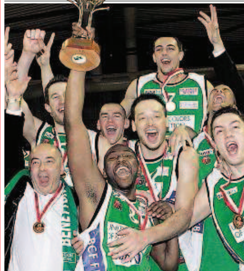
VITTORIA! I giocatori dell'Olympic Friburgo, dopo aver battuto in finale i Lugano Tigers, alzano la Coppa della Lega.