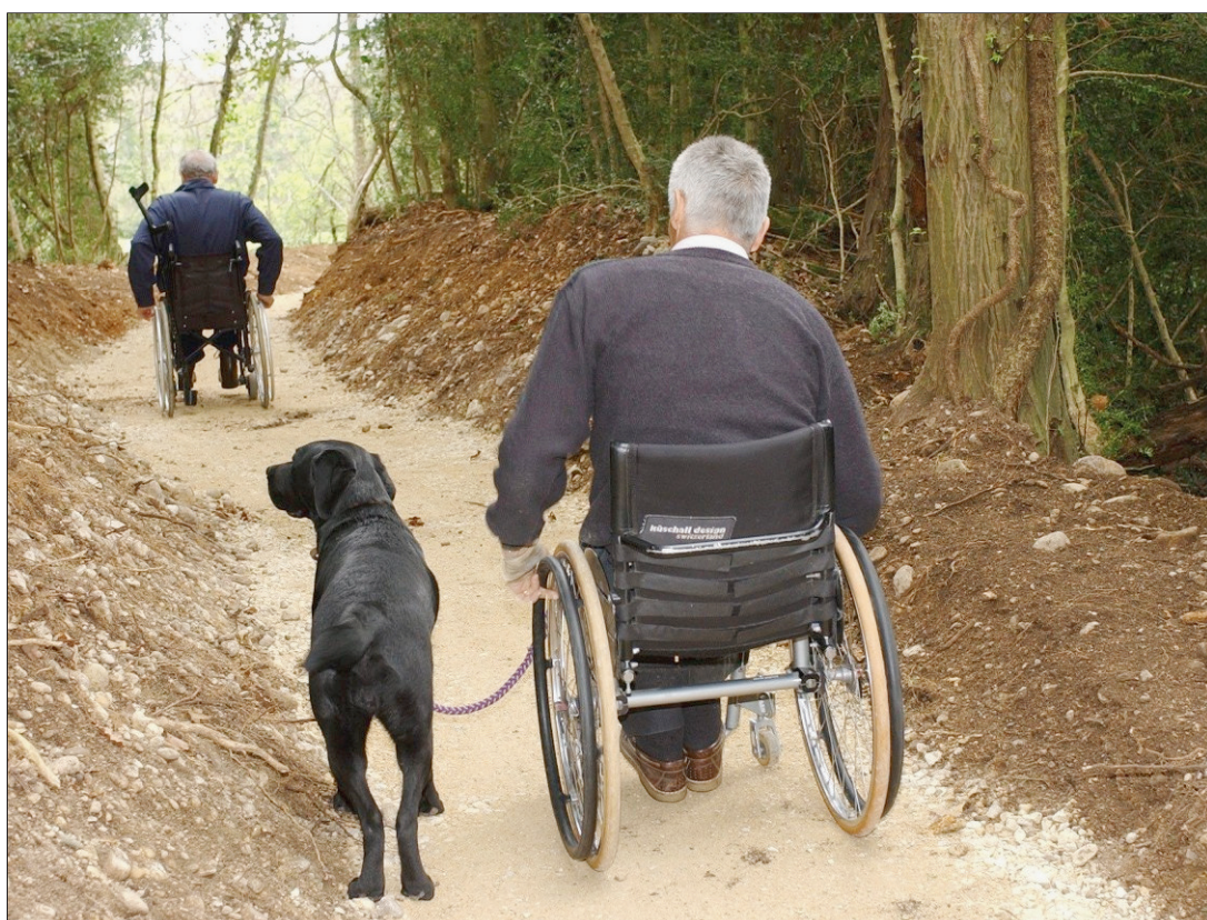
Archives Michel Perret

La quinzaine de membres de l'association Procap, section de Nyon se sent trahi. L'association qui vient en aide aux handicapés a été victime d'importantes malversations. Le préjudice s'élève à plusieurs dizaines de milliers de francs. Une plainte pénale a été déposée contre l'ancienne présidente. p.3