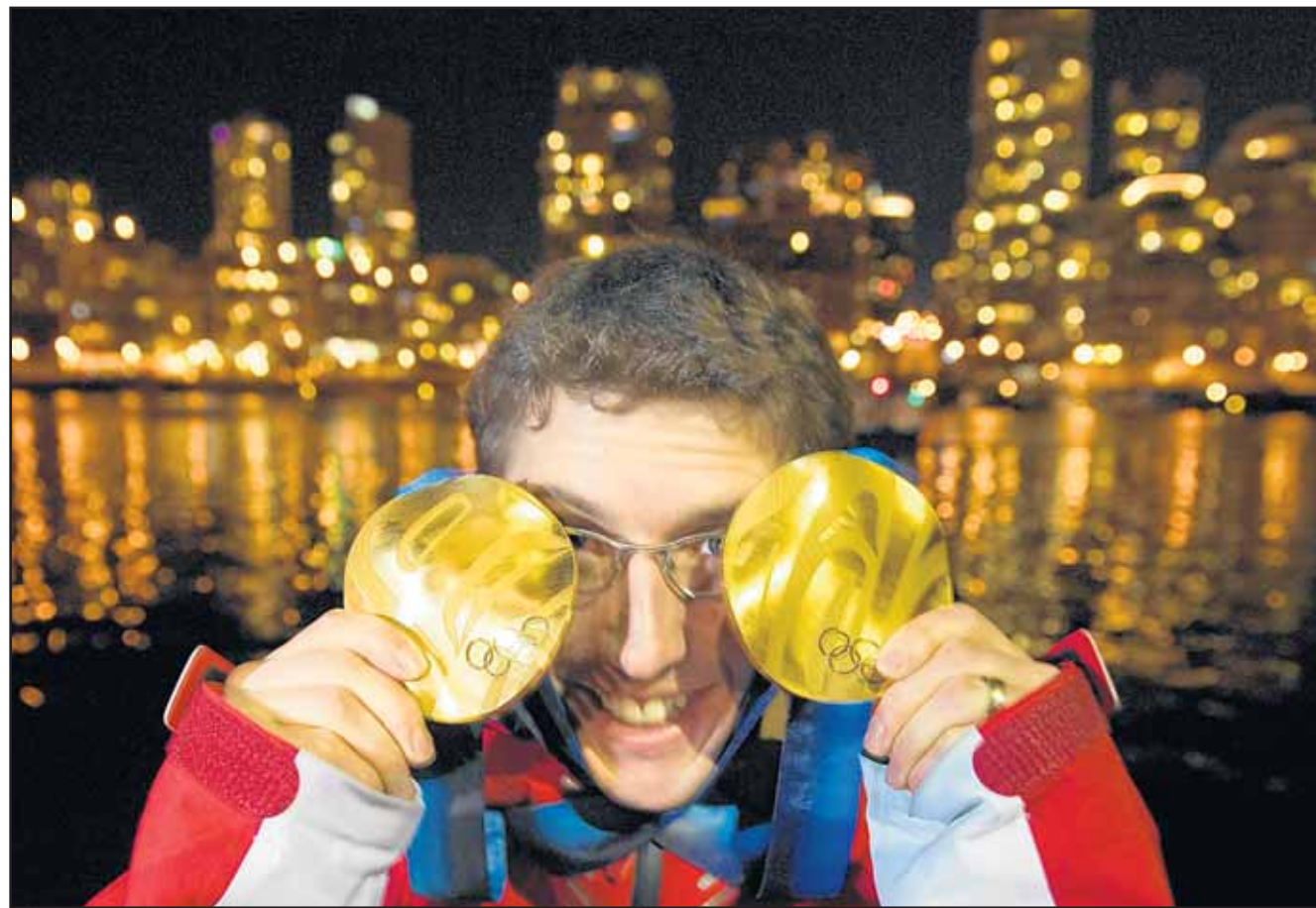
Comme la délégation suisse, Simon Ammann a un penchant pour les médailles d'or.