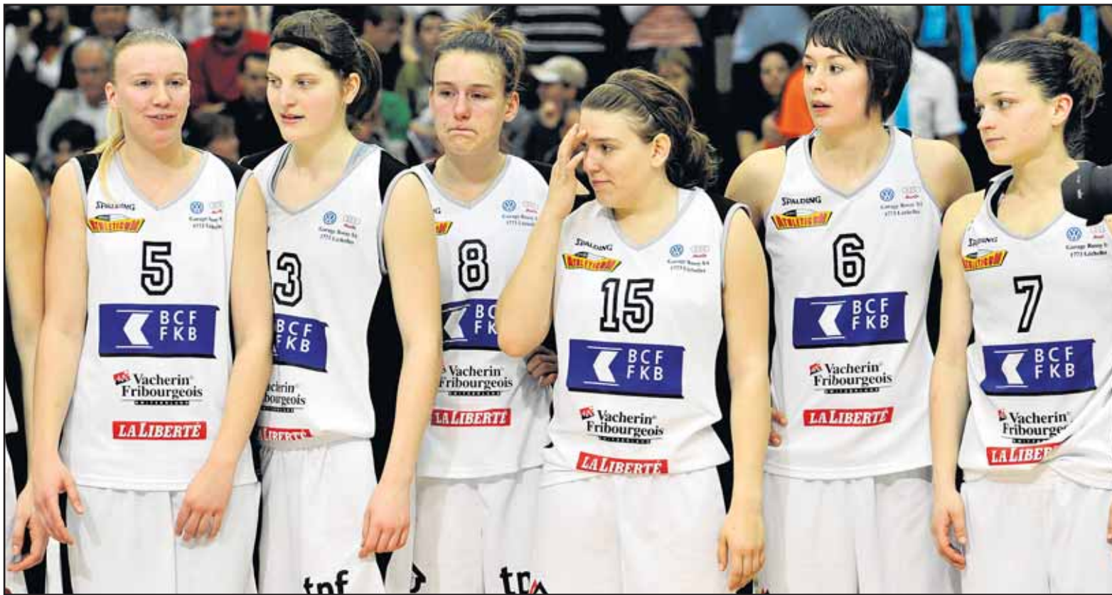
La déception se lit sur les visages des Elfes. Leur finale de Coupe de Suisse ne restera pas au rayon des bons souvenirs. CHARLY RAPPO

BASKETBALL • Les Fribourgeoises n'ont pas fait le poids face à Sierre en finale de la Coupe de Suisse. Après un bon quart, les Elfes se sont complètement effondrées.