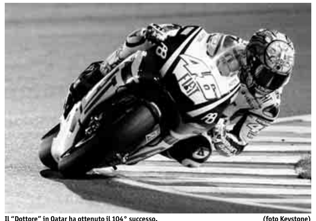
Il "Dottore" in Qatar ha ottenuto il 104° successo.

SUPERBIKE A Valencia vittorie di Haslam (Suzuki, ora leader del Mondiale dopo 6 delle 16 manches stagionali) e Haga (Ducati). Ai vertici anche Biaggi (Aprilia) con un 2° e un 3° posto.