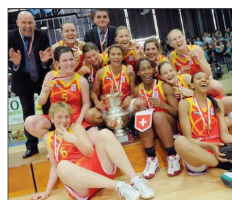
ET DE DEUX Sierre a remporté son deuxième titre de la saison après la Coupe de la Ligue.

Champion de Suisse en titre dames, Sierre a logiquement conquis son deuxième trophée de la saison, un peu plus d'un mois après avoir battu Nyon en finale de la Coupe de la Ligue et une semaine avant d'entamer la finale des play-off face aux mêmes Nyonnaises.