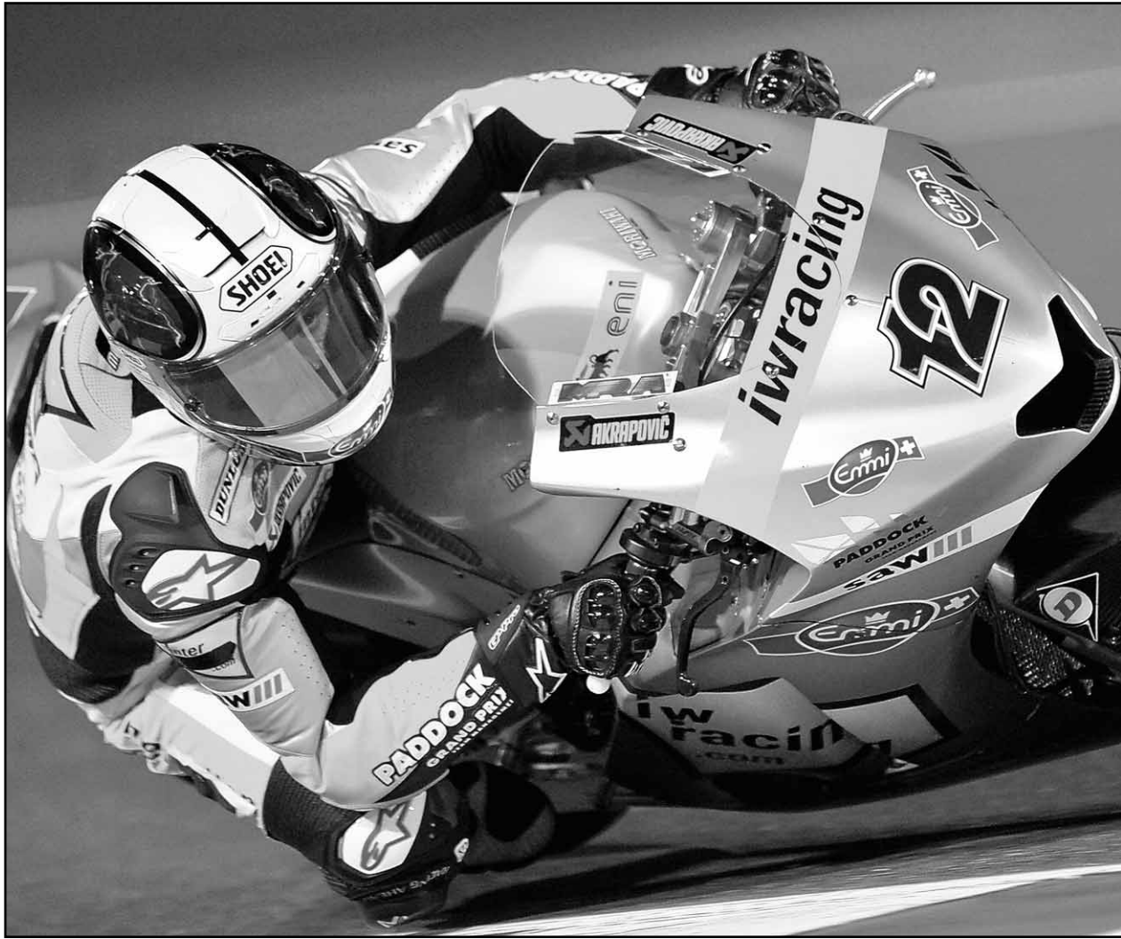
Sur le circuit qatari, Thomas Lüthi a pu signer le meilleur tour en course.

Le Zurichois de 20 ans a complété le «petit chelem» helvétique en entrant lui aussi dans les points. Il a réussi à