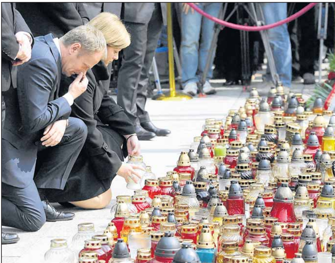
Le premier ministre Donald Tusk, hier, lors d'une messe en hommage aux 96 victimes du crash aérien de samedi à Smolensk.

TRAGÉDIE AÉRIENNE • A l'image du premier ministre, Donald Tusk (photo), les Polonais ont été des dizaines de milliers à venir rendre hommage hier aux victimes de la catastrophe aérienne de samedi, à Smolensk, qui a fait 96 victimes. Le pays s'est arrêté à midi pour observer deux minutes de silence à la mémoire de son président Lech Kaczynski, tué dans le crash avec une partie des plus hauts dignitaires polonais. La population a interrompu ses activités, se recueillant en silence. En fin d'après-midi, le convoi funéraire rapatriant la dépouille du président à Varsovie a été accueilli par une immense foule. Dans le monde entier, les réactions ont été nombreuses durant tout le week-end. > 2/3