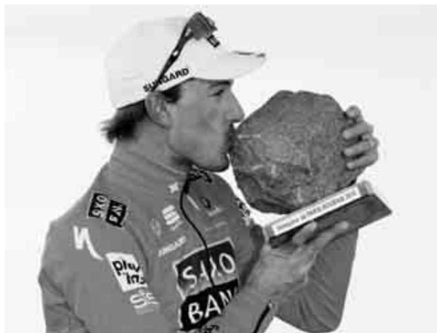
Fabian Cancellara, 29 anni, ha centrato la storica doppietta.

PARIGI-ROUBAIX (259 KM): 1. Cancellara (S/Saxo Bank) 6h35'10" (39,2 km/h); 2. Hushovd (Nor) a 2'00"; 3. Flecha (Sp) st; 4. Hammond (GB) a 3'14"; 5. Boonen (Bel) st; 6. Leukemans (Bel) a 3'20"; 7. Pozzato (It) a 3'46"; 8. Hoste (Bel) a 5'16"; 9. Hinault (Fr) a 6'27"; 10. Roulston (NZ) a 6'59"; 11. Rast (S) a 7'00"; 12. Coyot (Fr) a 7'05"; 13. Veelers (Ol); 14. Klemme (Ger); 15. Wynants (Be); 16. Khalilov (Ucr); 17. Mondroy (Fr); 18. Hunt (GB); 19. Guesdon (Fr); 20. Claude (Fr); poi: 104. Bertogliati (S) a 34'52".