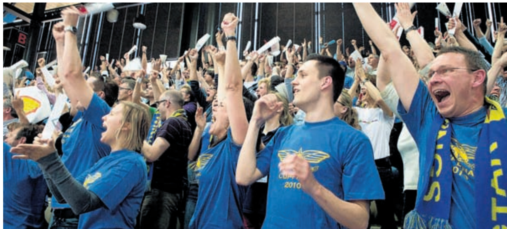
Die grosse Erleichterung. Nach 45 nervenaufreibenden Minuten gibt es auch im Fanblock der Starwings kein Halten mehr.

Ich hoffe schon, dass wir am Montag zurück in die Halle gehen und wieder voll fokussiert sind. Wir wollen immer noch möglichst weit kommen. Doch nach diesem Cupsieg fällt bereits viel Druck weg.