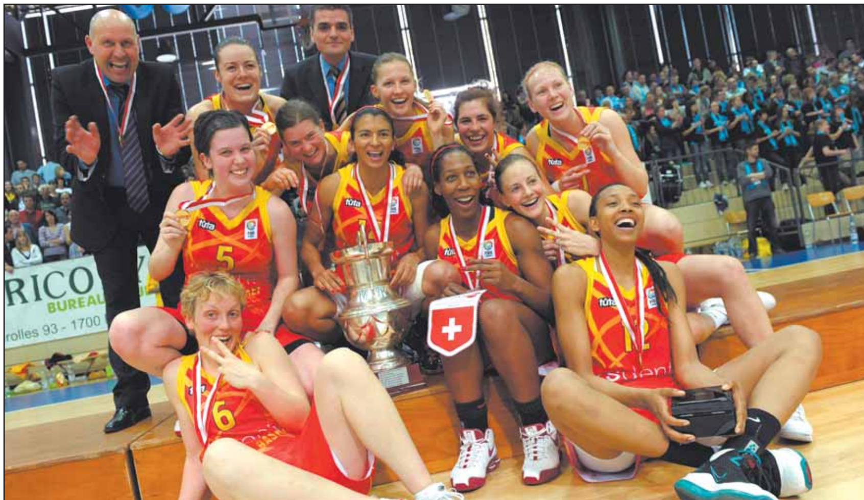
Il n'y a pas eu de mauvaise surprise à Fribourg pour les filles de Sierre Basket, victorieuses de la coupe de Suisse avec une grande facilité.

Coupe de la ligue, coupe de Suisse, il ne manque désormais plus que le titre de champion pour que le tableau sierrois soit complet. Une tâche à laquelle s'attelleront les Valaisannes dès cette semaine. Une fois les émotions de la coupe digérées, une fois leurs esprits retrouvés. «J'ai donné congé aux filles jusqu'à mardi. Le temps de fêter et de récupérer quelque peu. Ensuite, on attaque la dernière partie saison, avec la lutte