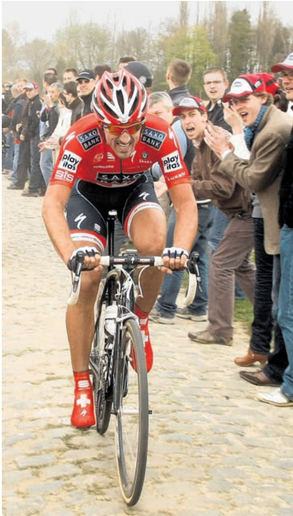
Allein durch die «Hölle des Nordens». Paris-Roubaix-Sieger Fabian Cancellara.

RAST ELFTER. Nicht wegen der 27 Abschnitte mit Pflastersteinen, aber auch nicht wegen der schlechten Witterung war diese 108. Auflage von Paris-Roubaix schwer, sondern wegen des Gegenwindes. Das erste Feldchen, das im Ziel eintraf, umfasste 28 Fahrer und wies sieben Minuten Rückstand auf. Gregory Rast erreichte als einziger neben Cancellara klassierter Schweizer Fahrer den 11. Platz.