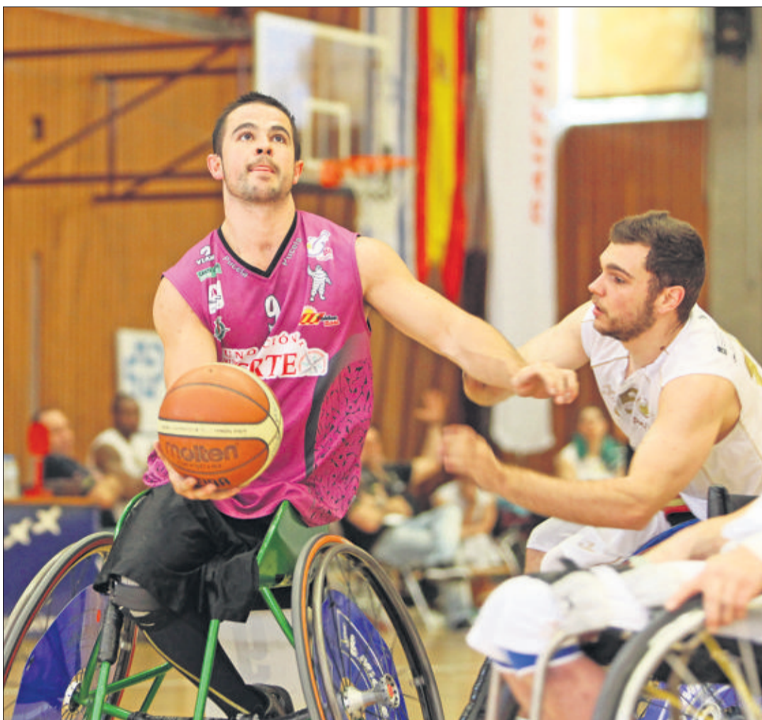
Une finale de haut niveau. Les Espagnols se sont royaumés à Champs-Frêchets. (GEORGES CABRERA)

«Le niveau est très relevé. Nous n'avons pas l'habitude, en championnat, d'aligner des matches si rudes en si peu de temps. Il nous manque la maîtrise dans les moments chauds. De plus, l'arbitrage en Coupe d'Europe est très différent de ce que nous connaissons et nous avons eu du mal à nous y habituer. Mais jouer un tel tournoi chez nous, c'est tout simplement merveilleux», confie le technicien, dont les joueurs ont flanché dimanche dans le dernier quart face à Hyères.