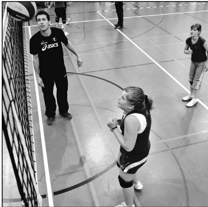
Appliqués, les internationaux ont prêché par l'exemple à Bulle. Ils ont aussi remis quelques cadeaux aux participants.