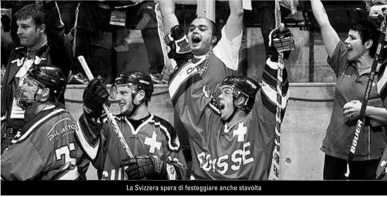
La Svizzera spera di festeggiare anche stavolta

che si disputerà in tre tempi di 20'. Le regole applicate all'inline hockey sono molto simili a quelle dell'hockey su ghiaccio, anche se le partite vengono disputate con una pallina di plastica dura, e con quattro giocatori di movimento più un portiere. La Federazione Svizzera di Inline Hockey (FSIH), è oggi composta da 41 club suddivisi sull'insieme del territorio nazionale e può contare su quasi 3'000 tesserati. Durante i tre giorni del torneo, al Palamondo sarà a disposizione una fornitissima mescita. Altre informazioni sul sito www.sayalu.ch .