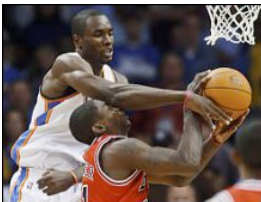
Oklahoma City s'est imposé 105-96 mercredi face aux Chicago Bulls.

Oklahoma City s'est imposé 106-95 mercredi face aux Chicago Bulls. Thabo Sefolosha a brillé face à son ancienne équipe, même s'il n'a inscrit que 1 point: l'arrière vaudois du Thunder s'est fait l'auteur de 4 contres, 4 rebonds, 4 passes décisives et 2 ballons «volés». Les deux champions du monde du Thunder, Kevin Durant et Russell Westbrook, ont inscrit respectivement 30 et 28 points.