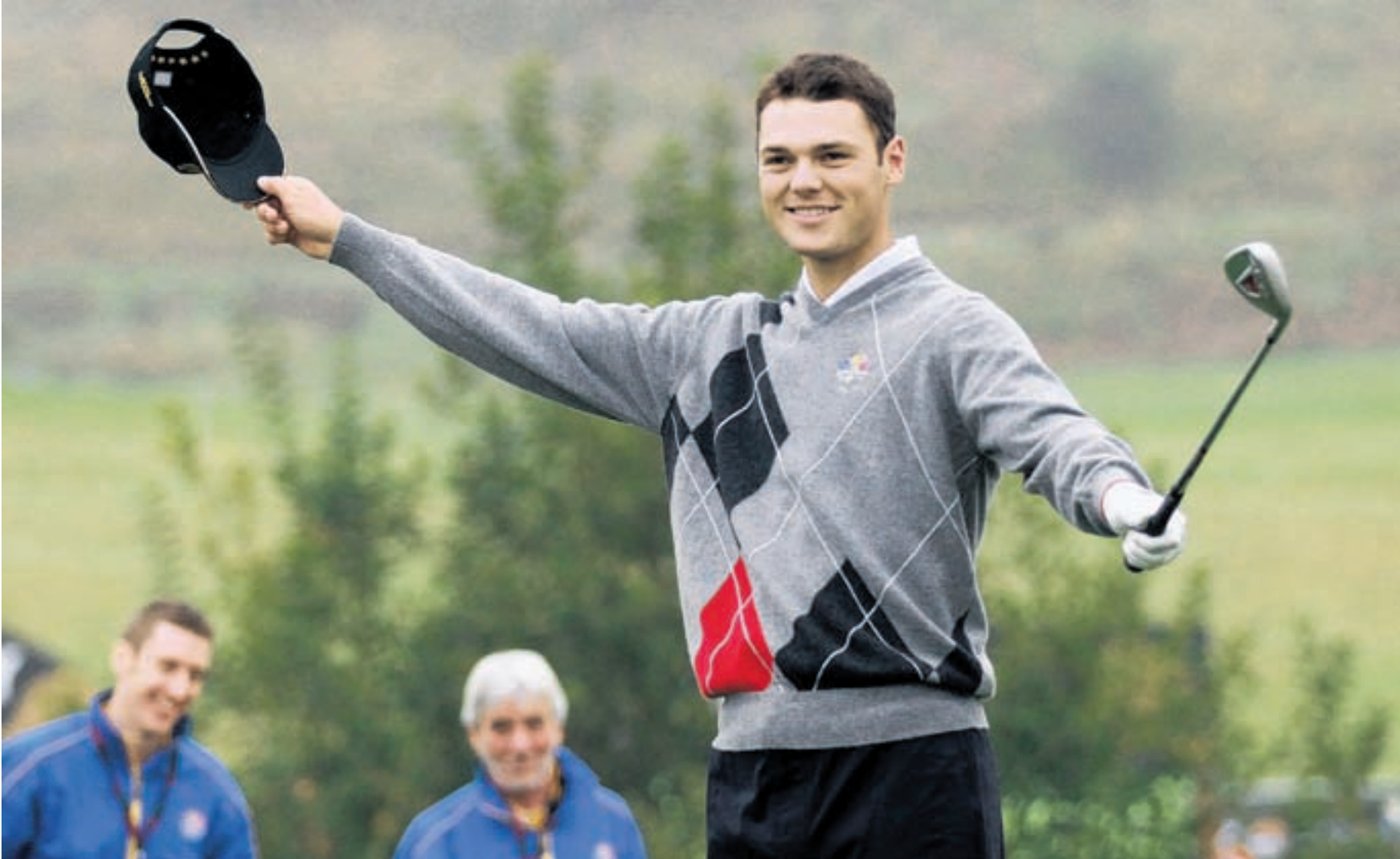
«Er macht kaum einen Fehler zweimal.» Martin Kaymer mit Mütze und Schläger in Siegerpose – hier beim Ryder Cup in Newport.

Die Lobeshymnen haben einfache Gründe: Kaymer hat zuletzt, wie mit stoischer Selbstver-