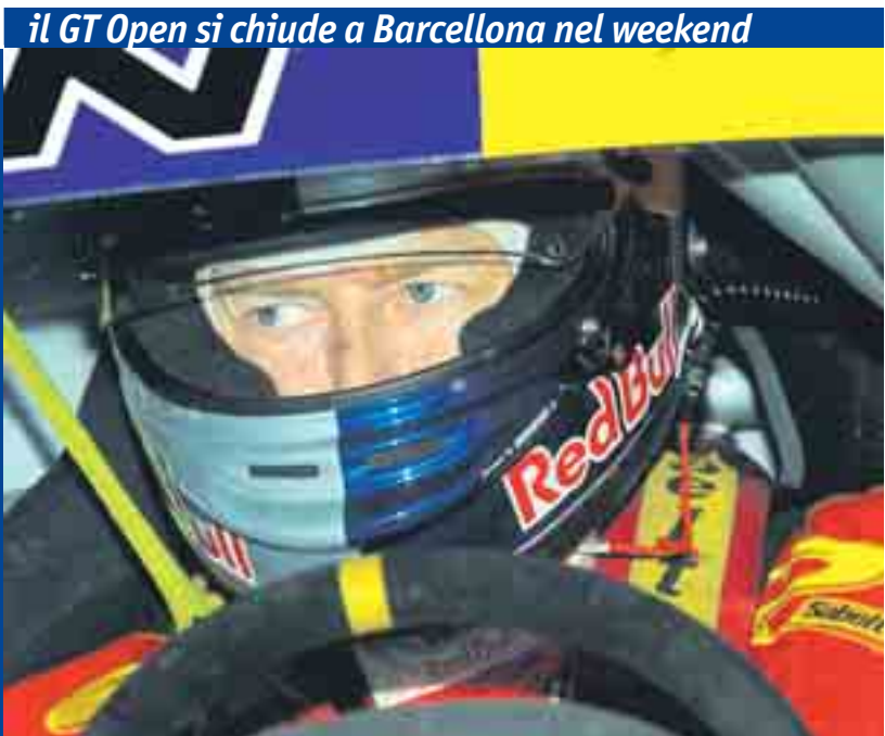
il GT Open si chiude a Barcellona nel weekend