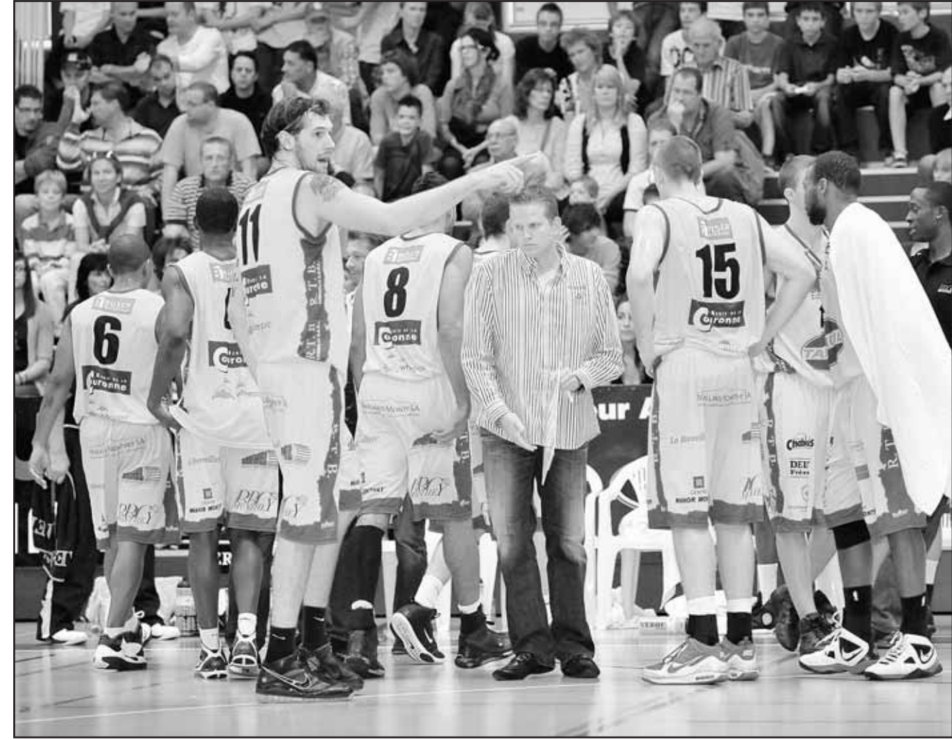
Le BBC Monthey navigue en eaux troubles. Il doit retrouver au plus vite une âme et un collectif. CLERC

3 Existe-t-il un véritable état d'esprit dans ce groupe? Les premières sorties laissaient présager de bonnes choses. Certes. Depuis deux rencontres, la tendance s'est in-