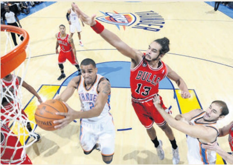
Thabo Sefolosha devance son ancien coéquipier chez les Bulls de Chicago, Joakim Noah.

NBA. Matches de mercredi: Oklahoma City Thunder (avec Sefolosha/1 point) - Chicago Bulls 105-96. Cleveland Cavaliers - Boston Celtics 95-87. New Jersey Nets - Detroit Pistons 101-98. Philadelphia 76ers - Miami Heat 87-97. Toronto Raptors - New York Knicks 93-98. Memphis Grizzlies - Atlanta Hawks 104-119. Minnesota Timberwolves - Sacramento Kings 116-117. New Orleans Hornets - Milwaukee Bucks 95-88.