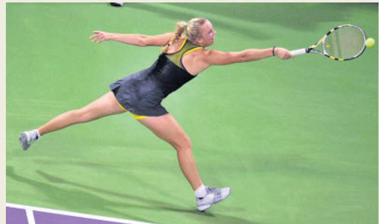
Caroline Wozniacki est assurée de terminer l'année à la place de No 1 mondiale.

La Danoise Caroline Wozniacki et l'Australienne Samantha Stosur, pour leur première participation dans cette compétition, ont assuré leur participation aux demi-finales du Masters à Doha, avant même la dernière journée. Wozniacki est certaine en plus de finir l'année au rang de No 1.