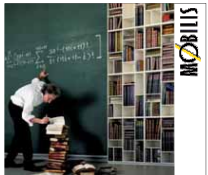
Mobilier contemporain - Sortie autoroute 1728 Rossens - 026 411 36 76 - www.mobilis.ch

nisait pour ses troupes de camarades une soirée «à la Girardet» où la délicatesse des plats époustouffait les plus étrangers aux merveilles du palais... L'homme en question, qui pratiquait le vélo de course entre deux services, n'était alors qu'un second couteau, si l'on ose dire... Mais déjà la voie de la célébrité lui était toute tracée: il s'appelait Philippe Rochat et avait pour coutume de dire que son plat préféré était... la fondue sous les filets (de camouflage)! PAB