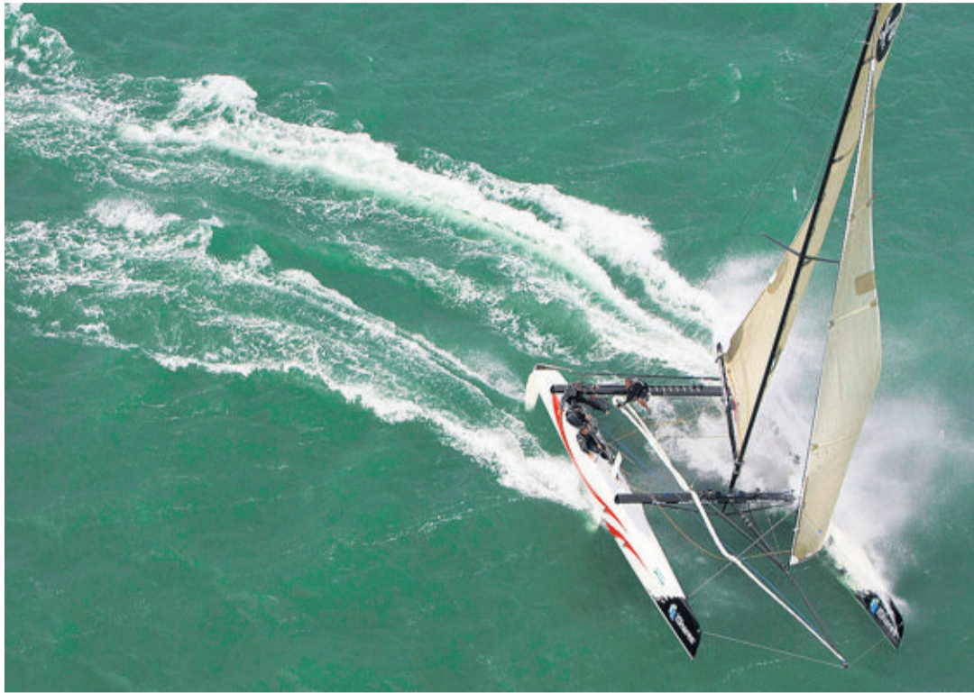
Alinghi change de cap et se concentrera désormais sur le circuit des Extreme 40 Series.

Sur ce point, les Américains possèdent trois ans d'avance sur tout le monde. Au lieu de diminuer les coûts pour les challengers comme il en était question au départ, on parle déjà d'une campagne à 70 ou 80 millions de dollars. Dans la situation économique mondiale actuelle, ce n'est pas viable. Les Britanniques de Team Origin et les Allemands de Team Germany ont déjà jeté l'éponge. Il est probable que BMW Oracle et leur manager Russell Coutts réagissent à cette nouvelle défection d'Alinghi, forcément plus marquante.