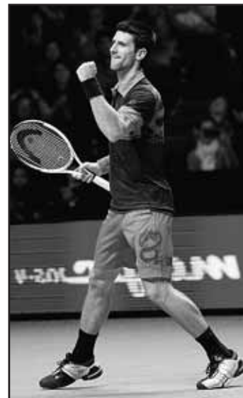
Novak Djokovic a facilement écarté Andy Roddick.

De son côté, Rafael Nadal a validé sa qualification en s'imposant 7-6 (7/3) 6-1 contre Tomas Berdych. L'Espagnol disputera samedi sa troisième demi-finale dans ce tournoi des Maîtres. Il a perdu les deux premières à Shanghai face à Roger Federer. La troisième l'opposera dès 14 heures (15 heures en Suisse) à Andy Murray. Même si l'Ecossois évoluera sur un revêtement qui l'avantage, Rafael Nadal aborde cette rencontre dans la peau du favori.