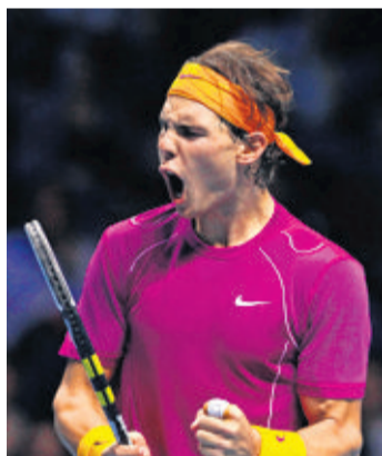
Rafael Nadal disputera aujourd'hui sa troisième demi-finale au Masters.

Hier, Rafael Nadal a franchi un premier cap qui doit l'emmener vers les cimes. Vainqueur de Tomas Berdych (7-6, 6-1), il a viré en tête de son groupe. Devant Djokovic, qui affrontera donc Federer ce soir en demi-finale. Nadal, lui, a obtenu le droit de défier Andy Murray, porté par