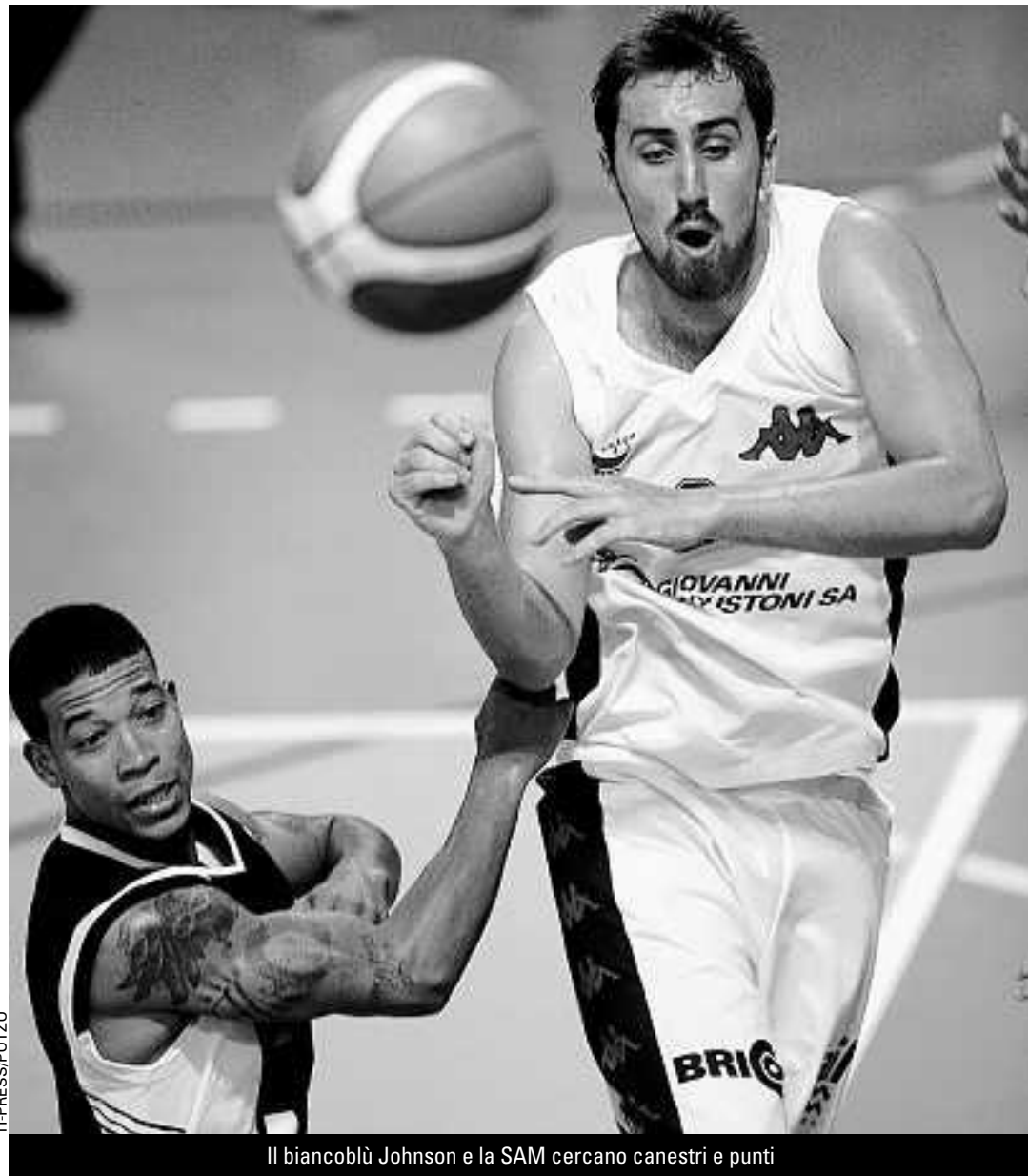
Il biancoblu Johnson e la SAM cercano canestri e punti

Il Lugano, reduce dalla trasferta lusitana che ha lasciato un po' di amaro in bocca per