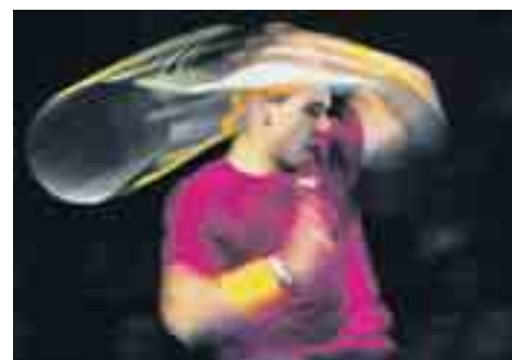
A fuoco c'è solo la sua rabbia...

Tre su tre anche per Rafael Nadal. Nonostante i dolorosi ricordi dello scorso anno - neppure un set vinto - e una lunga pausa di cinque settimane per curare la sua spalla, il numero uno mondiale disputerà le semifinali dei Masters londinesi. Dopo essere riuscito a rimediare all'iniziale passivo contro Andy Roddick lunedì e a liquidare Novak Djokovic mercoledì, ieri il maiorchino ha battuto anche Tomas Berdych, con il risultato di 7-6 6-1. Bellissimo il primo set, giocato da entrambi su altissimi livelli. sul 6-5 15-15 in favore di Berdych, Nadal è esploso contro una decisione dell'arbitro, che non ha fatto rigiocare un punto vinto dal ceco grazie all'"occhio elettronico": mai visto l'iberico tanto arrabbiato, ma poi ha ritrovato in fretta la concentrazione. «Carlos Bernardes è uno dei migliori arbitri del mondo, ma a volte sbagliano anche i migliori...», ha poi sottolineato Rafa. Oggi alle 15.00 in semifinale troverà Andy Murray su una superficie adatta alle caratteristiche dello scozzese, ma il favorito resta comunque lui, il mancino di Manacor. E tutti intanto sognano già la finalissima (domani alle 18.30 circa) tra Nadal e Federer. «Tra Murray e me però ce la giocheremo a dipendenza della forma di giornata.