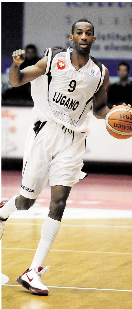
ATTENZIONE AGLI ERRORI Il Lugano di Draughan sarà impegnato a Boncourt: Whelton vuole evitare di perdere troppi palloni.