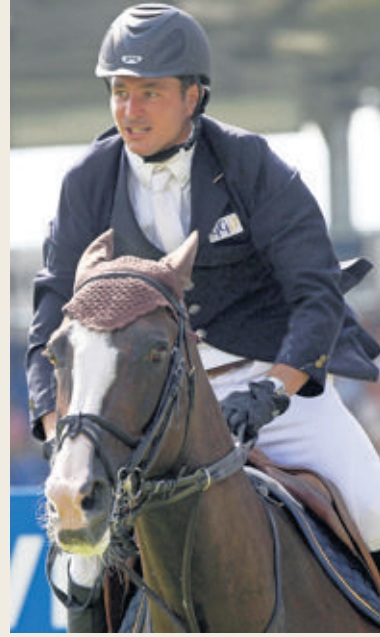
Pius Schwizer (à g.) et Steve Guerdat terminent l'année en beauté.