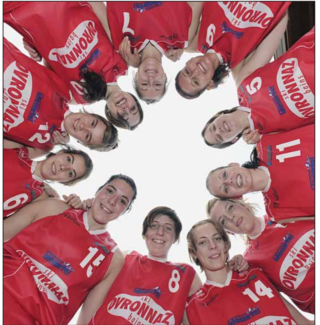
Les filles de Martigny sont sur la bonne voie. Elles restent en course pour le titre de LNB. BITTELIA

La suite: Martigny a perdu ses quatre premiers matches de peu, avant de trouver la faille début février contre Lausanne. L'équipe reste en course pour le final four qui réunira le top 4. «Nous prenons partie après partie. Sans se fixer de buts précis. Bien sûr, ce serait sympa d'accrocher le final four, mais nous verrons rapidement si cela est possible. De toute façon, la promotion n'est pas du tout à l'ordre du jour.»