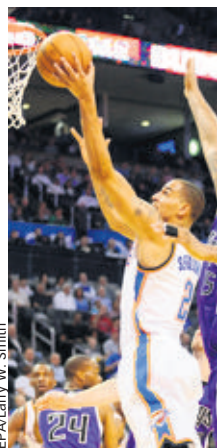
EPALARY W. SMITH

Championnat de NBA. Les matches de mardi soir: Phoenix Suns - Utah Jazz 102-101. Memphis Grizzlies - Philadelphia 76ers 102-91. Oklahoma City Thunder (avec Sefolosha/9 points) - Sacramento Kings 126-96. Chicago Bulls - Charlotte Bobcats 106-94. Indiana Pacers - Miami Heat 103-110. Golden State Warriors - New Orleans Hornets 102-89.