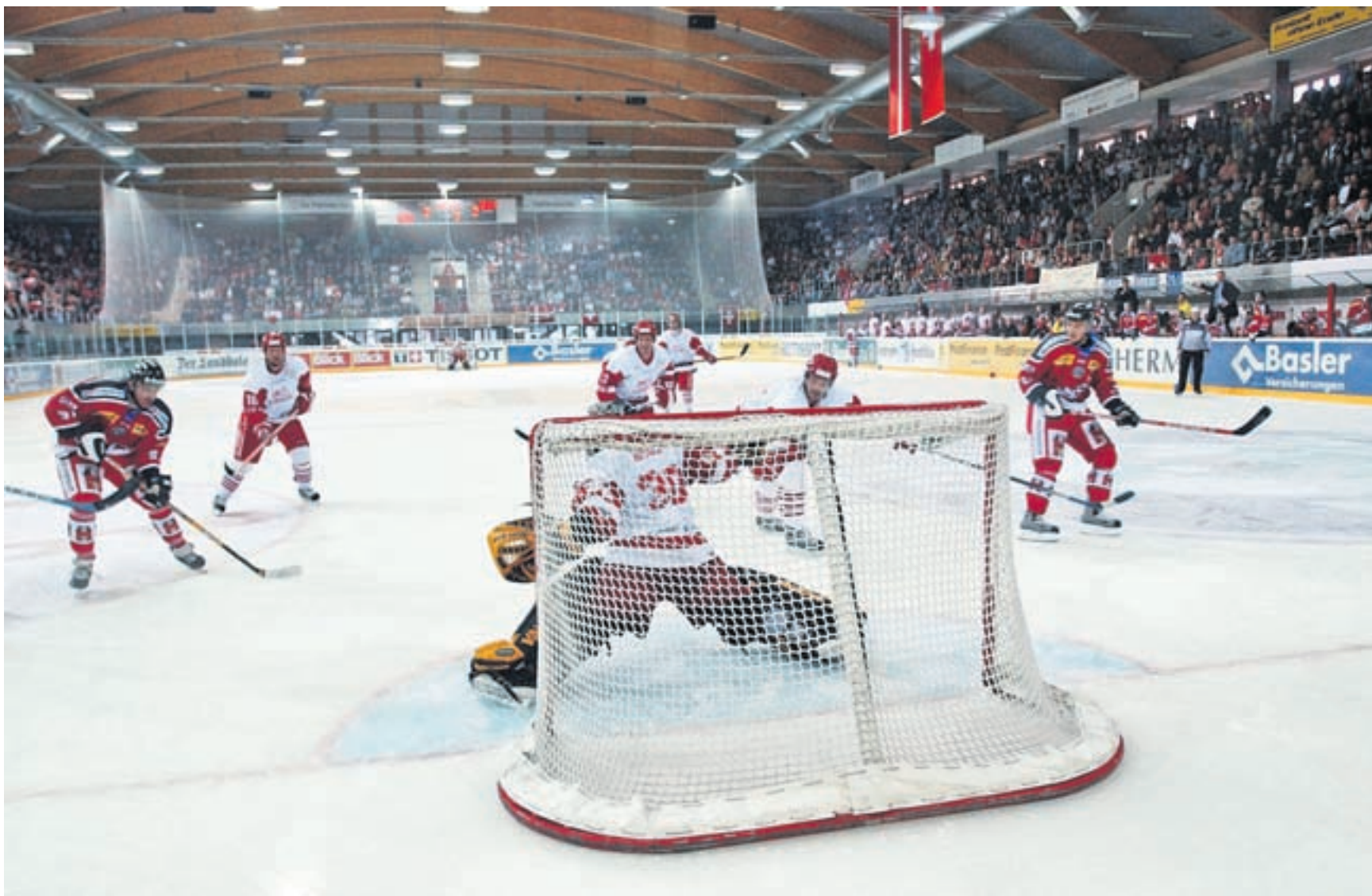
Winterthur im Zentrum. Wo bislang ein Erstligist spielte und das Nationalteam ab und an testete, soll künftig das Herz des Schweizer Hockeys schlagen.