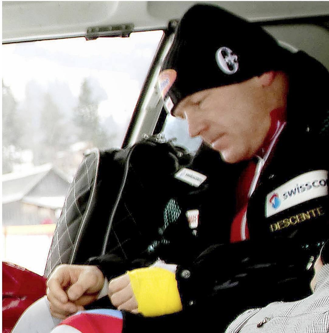
Après le pouce droit l'an dernier, c'est le gauche qui a dit «pouce» hier à Didier Cuche.

En cas d'opération, et sauf imprévu, Didier Cuche devrait donc avoir largement le temps de se rétablir pour les prochaines épreuves de vitesse, à Kvitfjell (2 descentes et 1 super-G) du 11 au 13 mars. Actuellement en tête du classement de la Coupe du monde de descente avec 65 points d'avance sur Michael Walchhofer