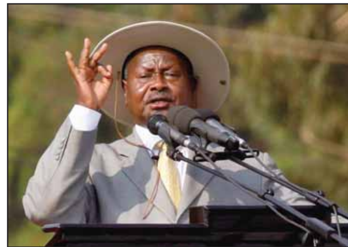
Le président Museveni va se succéder à lui-même.

Tacticien dans l'âme, autoritaire dans le sang, le président ougandais Yoweri Museveni sera demain candidat à sa réélection. Au fil de 25 ans de pouvoir, il a vaincu plus de dix rébellions et écarté ses opposants, offrant au pays une stabilité jusque-là inédite.