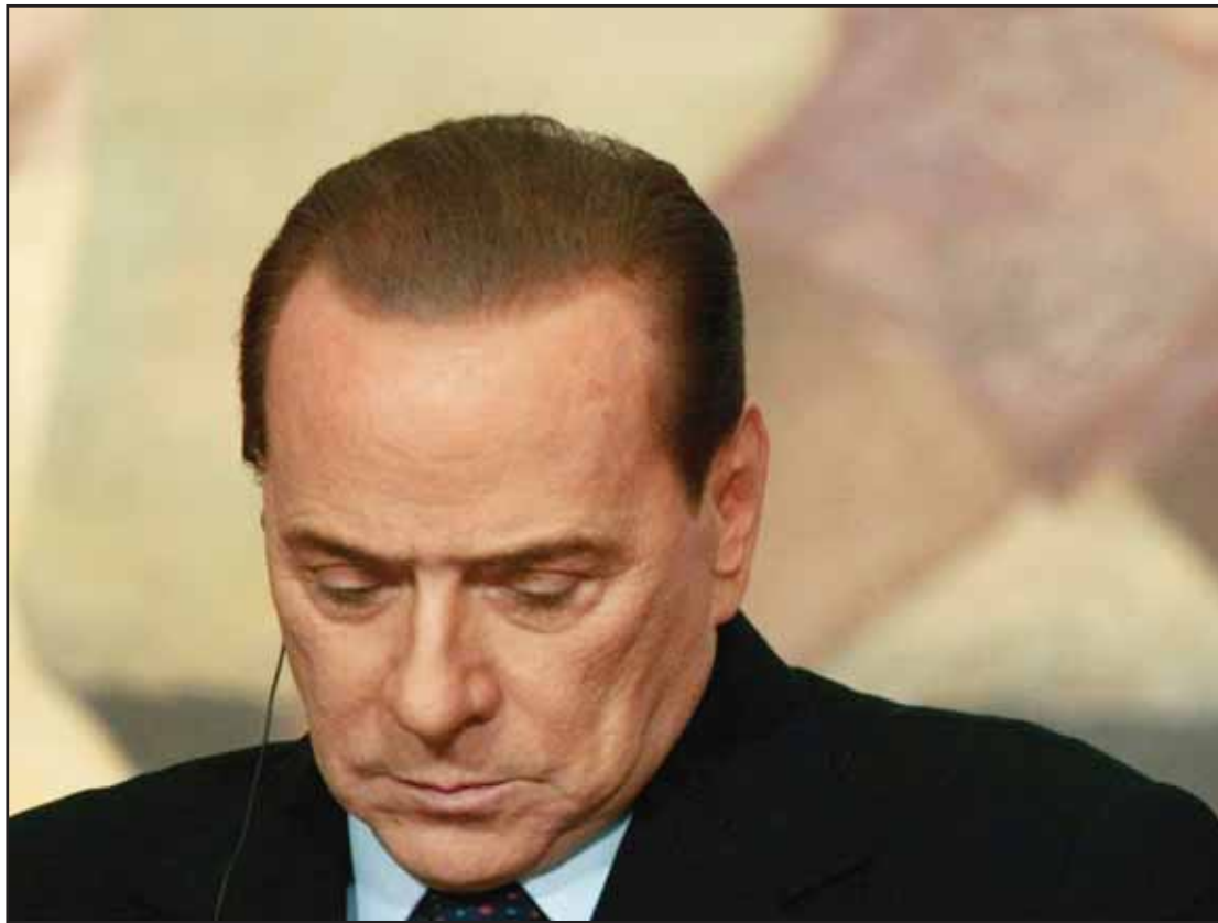
Le premier ministre italien n'entend pas se laisser juger sans réagir.