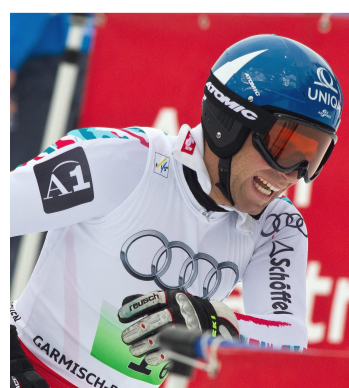
Coup dur pour Raich, qui grimace de douleurs.

Parti à la faute pendant l'épreuve par équipes, Raich (32 ans) a été victime d'une déchirure du ligament croisé