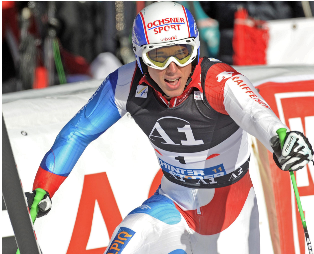
Affaibli depuis de longs mois, Carlo Janka espère bientôt retrouver un nouveau souffle.