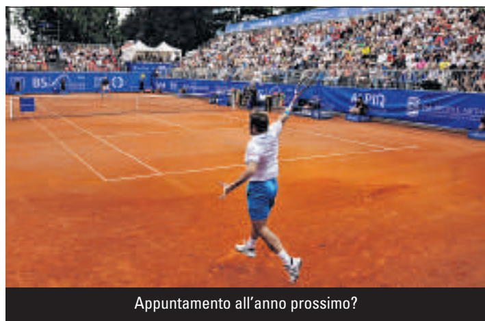
Appuntamento all'anno prossimo?

Del resto la Formula 1 è più di un semplice sport. È una realtà che ha esteso i confini in tutto il globo, se si pensa che sono 187 i Paesi che ne hanno acquistato i diritti televisivi, 40 quelli che seguono le corse con inviti sul posto e complessivamente una stagione viene seguita da qualcosa come 527 milioni di persone.