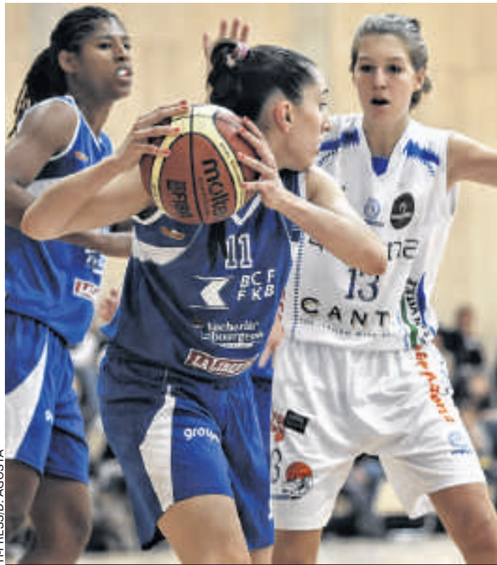
Nessuno sconto dalle romande

La formazione di casa ha evidenziato una superiorità