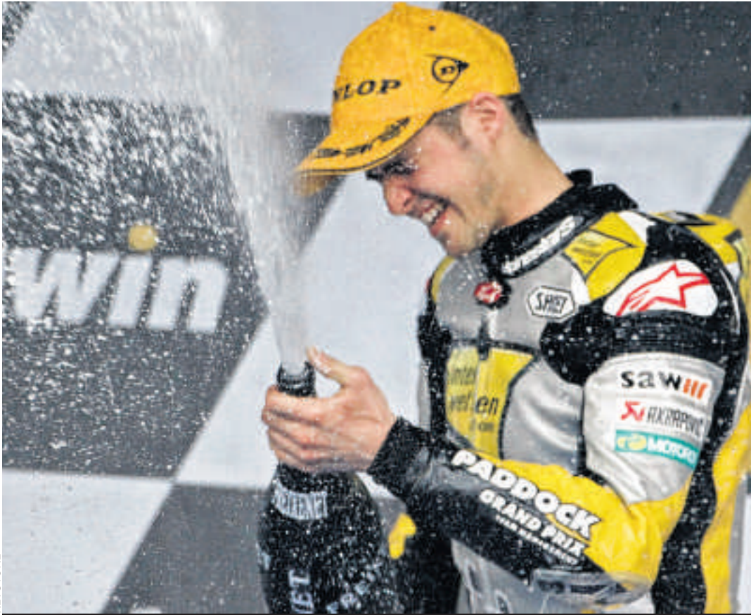
Lüthi festeggia: secondo nel GP di Spagna e secondo nel Mondiale

Nelle 125 Nicolas Terol ha rinnovato l'appuntamento col successo, anche se stavolta ha dovuto impegnarsi a fondo per spuntarla. A metterlo alle strette è stato in particolare Hector Faubel, che tuttavia nell'ultimo giro è stato vittima di una caduta e ha compromesso la sua gara, chiusa poi all'undicesimo rango. Giulian Pedone non ha invece chiuso la gara, caduto nel corso del nono dei 23 giri.