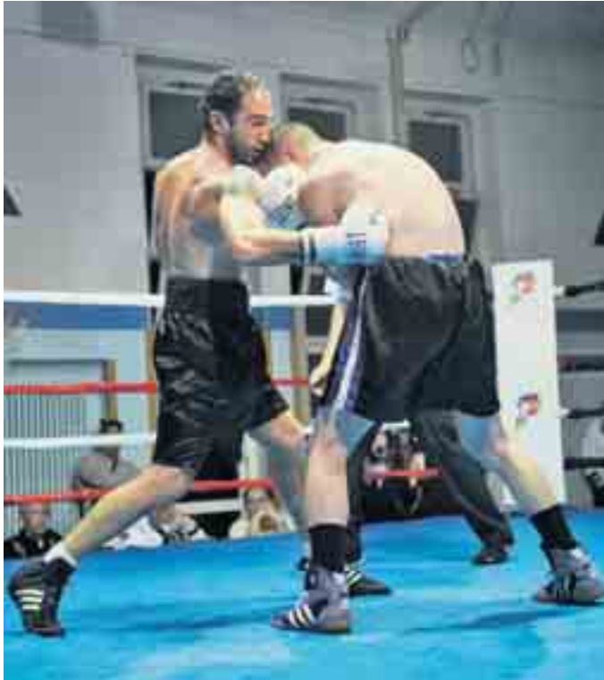
Belge: «I primi due round sono stati difficili».

BOXE Alla riunione di Ascona ha brillato pure la stella di Kopilenko, vincitore per KO – Successo pure per Krasniqui