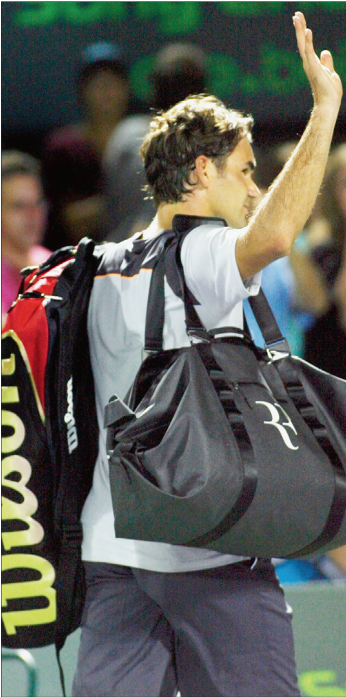
ROGER Désormais, c'est Rafael Nadal et Novak Djokovic qui occupent solidement les avant-postes de la scène du tennis mondial.

Son objectif principal dans la Principauté sera de remporter un maximum de matches. Il refusait de dire s'il viserait une place en demi-finale ou en finale. «Après huit mois sur des courts en dur, on a toujours besoin de temps pour adapter son jeu de jambes et son mental à la terre battue. Mais cela me fera le plus grand bien de pouvoir disputer de plus longs échanges en variant plus.» S'il le dit.. /si