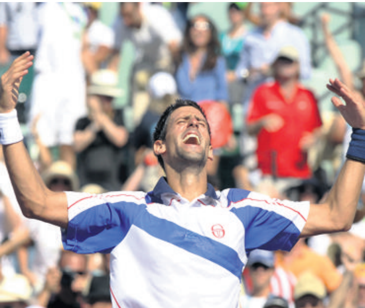
Novak Djokovic, le meilleur tennisman actuel du circuit.

Nole aura mis 3h21' pour prendre la mesure d'un Rafael Nadal très proche de sa meilleure forme. Il forçait la décision en empochant cinq points d'affilée dans le jeu décisif, s'offrant ainsi quatre balles de match. Rafael Nadal effa-