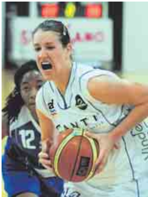
Quattordici punti per la Jakab a Friborgo.

PLAYOFF LNAF La squadra diretta da Rezzonico nulla può contro un avversario nettamente più solido