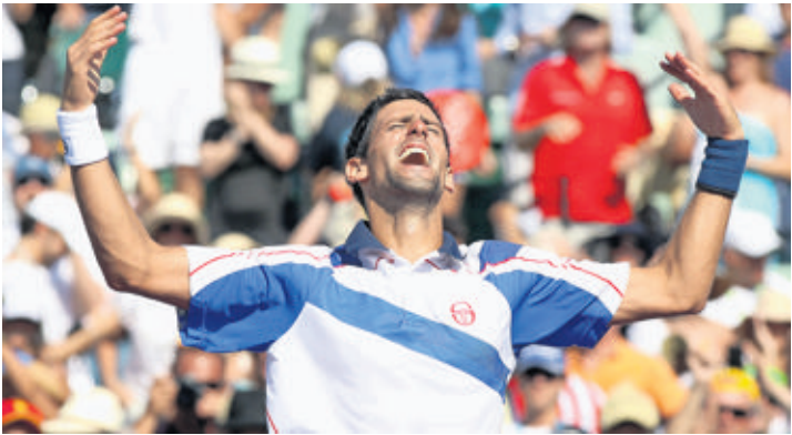
Novak Djokovic en est désormais à 24 victoires d'affilée.

Vendredi soir, Roger Federer n'avait pas existé en demi-finale devant Nadal. Le Bâlois s'est incliné 6-3 6-2 en 1 h 19'. «Je n'ai vraiment pas bien joué. C'est décevant. C'était un jour sans pour moi malheureusement. C'est frustrant d'avoir passé deux semaines à Miami et de ne pas avoir su trouver le bon rythme dans cette demi-finale», lâchait-il. Éliminé en Floride comme à Indian Wells au stade des demi-finales, l'homme aux 16 trophées du Grand Chelem quitte les Etats-Unis avec un enseignement majeur: il est bien aujourd'hui le No 3 mondial. SI