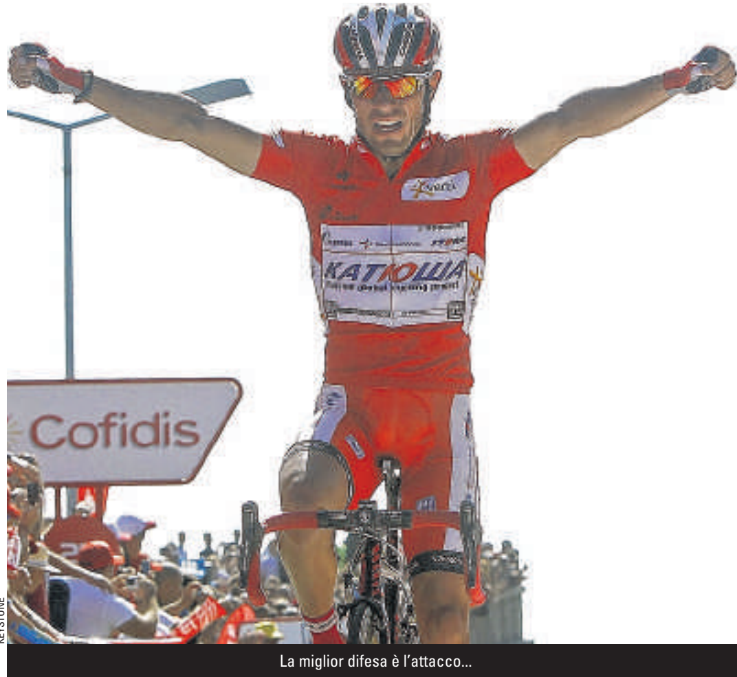
La miglior difesa è l'attacco...

con 13" di margine su Contador, 51" su Froome e 1'20" su Valverde. Come dire che tutto è ancora possibile specialmente considerando quanto attende i corridori nei prossimi giorni. Oggi spazio ai velocisti