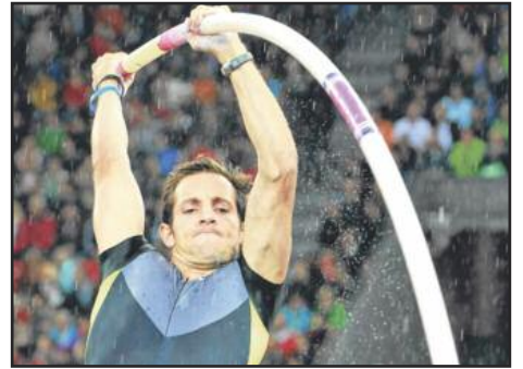
Renaud Lavillenie.

Et, dans la foulée, Usain Bolt parachevait le travail «made in Jamaica» en assurant un 19"66 sur 200 m, à 8 centièmes de son temps d'Athletissima qui avait représenté le 11 e de l'histoire. «Depuis les JO, je cours surtout pour le fun», relèvera Bolt. Avec les deux gars de Kingston, la banalisation des chronos en sprint guette à chaque meeting. Et, à l'applaudimètre, ce sont toujours eux les chéris du stade. Il y a encore du boulot pour David Rudisha et les autres avant d'inverser la tendance. Mais le veulent-ils vraiment? !