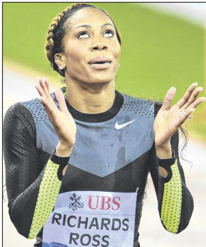
Sanya Richards-Ross: sixième succès à Zurich.