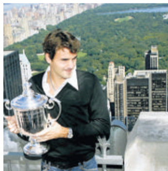
Federer au sommet de l'Empire State Building après son sacre en 2005.