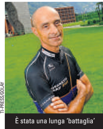
È stata una lunga 'battaglia'