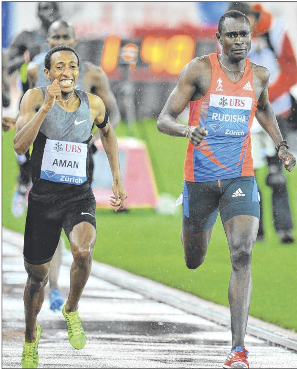
Sensation sur 800 m au Weltklasse: Mohamed Aman coiffe David Rudisha au poteau.

Et Rudisha dans tout ça? A Zurich, il se transformait en Monsieur Météo: «Si le temps n'est pas bon, exclu pour moi de faire une bonne course. J'espérais pouvoir réaliser une course rapide et je suis forcément un peu déçu. C'est vraiment la pluie qui m'a stoppé.»