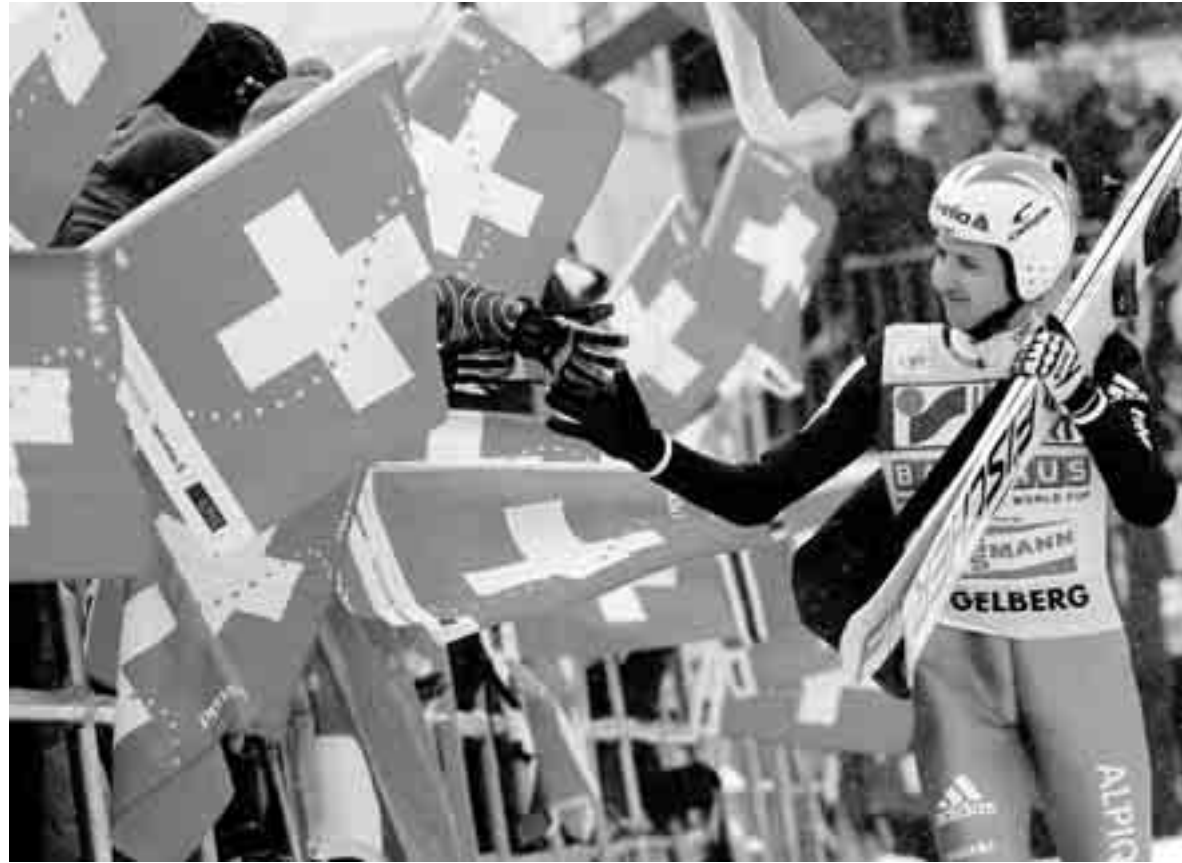
Un tripudio generale del pubblico elvetico accorso in massa ad Engelberg per Simon Ammann.

A 28 anni, Ammann è più motivato che mai, lui che potrebbe per esempio ancora sognare di vincere per la prima volta la generale di CdM. E poi pensa di poter e voler continuare anche dopo i Mondiali di Oslo nel 2011, tappa che dovrebbe sancire invece l'addio di Küttel.