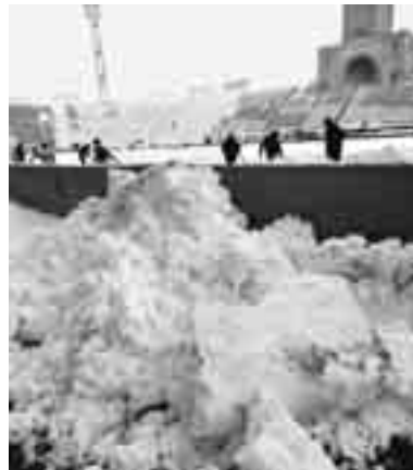
La neve e Roberto Mancini sono i grandi protagonisti del weekend.

LA CLASSIFICA 1. Inter 17/39; 2. Milan 16/31; 3. Juventus 17/30; 4. Roma 17/28; 5. Parma 17/28; 6. Napoli 17/27; 7. Palermo 17/26; 8. Sampdoria 17/25; 9. Genoa 16/24; 10. Bari 16/24; 11. Fiorentina 16/24; 12. Chievo 17/24; 13. Cagliari 16/23; 14. Udi-