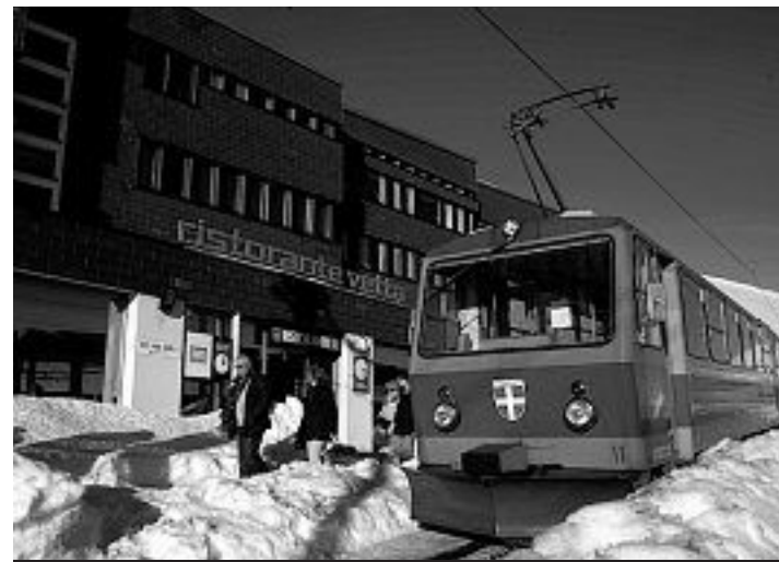
La Ferrovia è già al lavoro