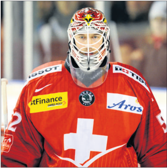
Le portier de Ge/Servette a aussi brillé avec la Suisse. (LAFARGUE)