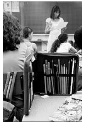
I compiti da svolgere

Capriasca, soluzione in tre tappe per le scuole