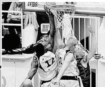
ALTA QUOTA Efeberha (a sinistra) sfugge a Schneidermann, il quale gli rende poi il favore (sopra a destra). A fermarlo ci pensano quindi Sanders e Vandermeer (foto sotto). (fotogonnella)