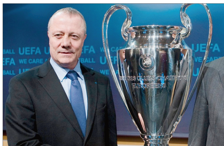
Pour l'ancien avant-centre des Bleus, l'Olympique Lyonnais pourrait venir effectuer un stage sur La Côte à l'avenir.

«Venir en stage de préparation sur La Côte? C'est une possibilité...»