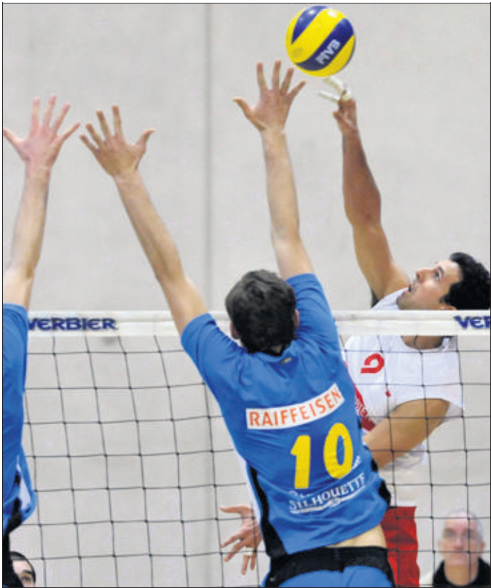
Guerra transperce facilement la défense chénoise.