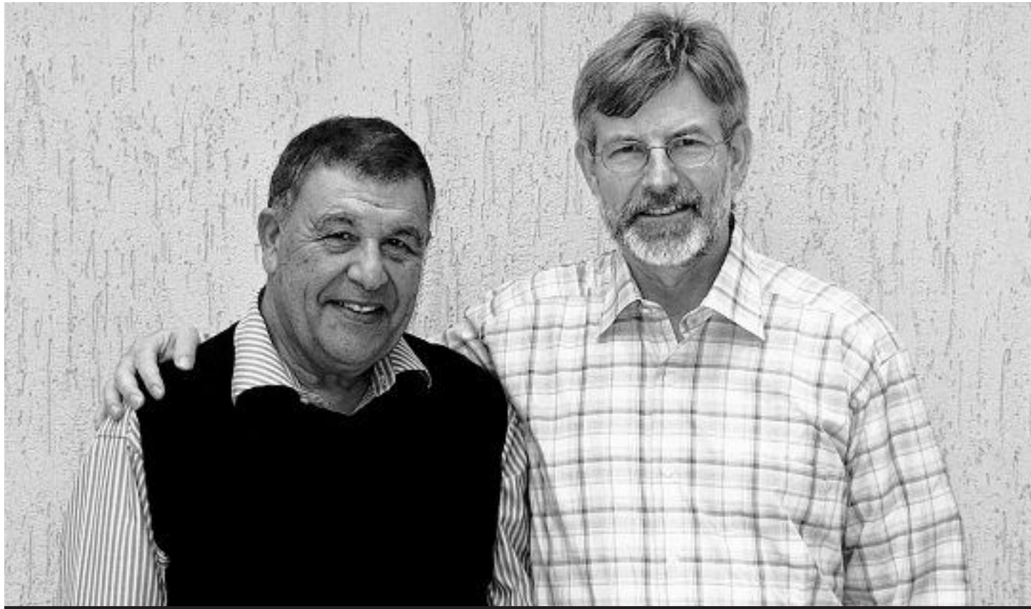
Già giudicati per violazione delle regole sui visti

Tripoli, Göldi e Hamdani saranno giudicati il 2 e il 3 gennaio Accusati dalle autorità libiche di esercizio di attività economiche illegali