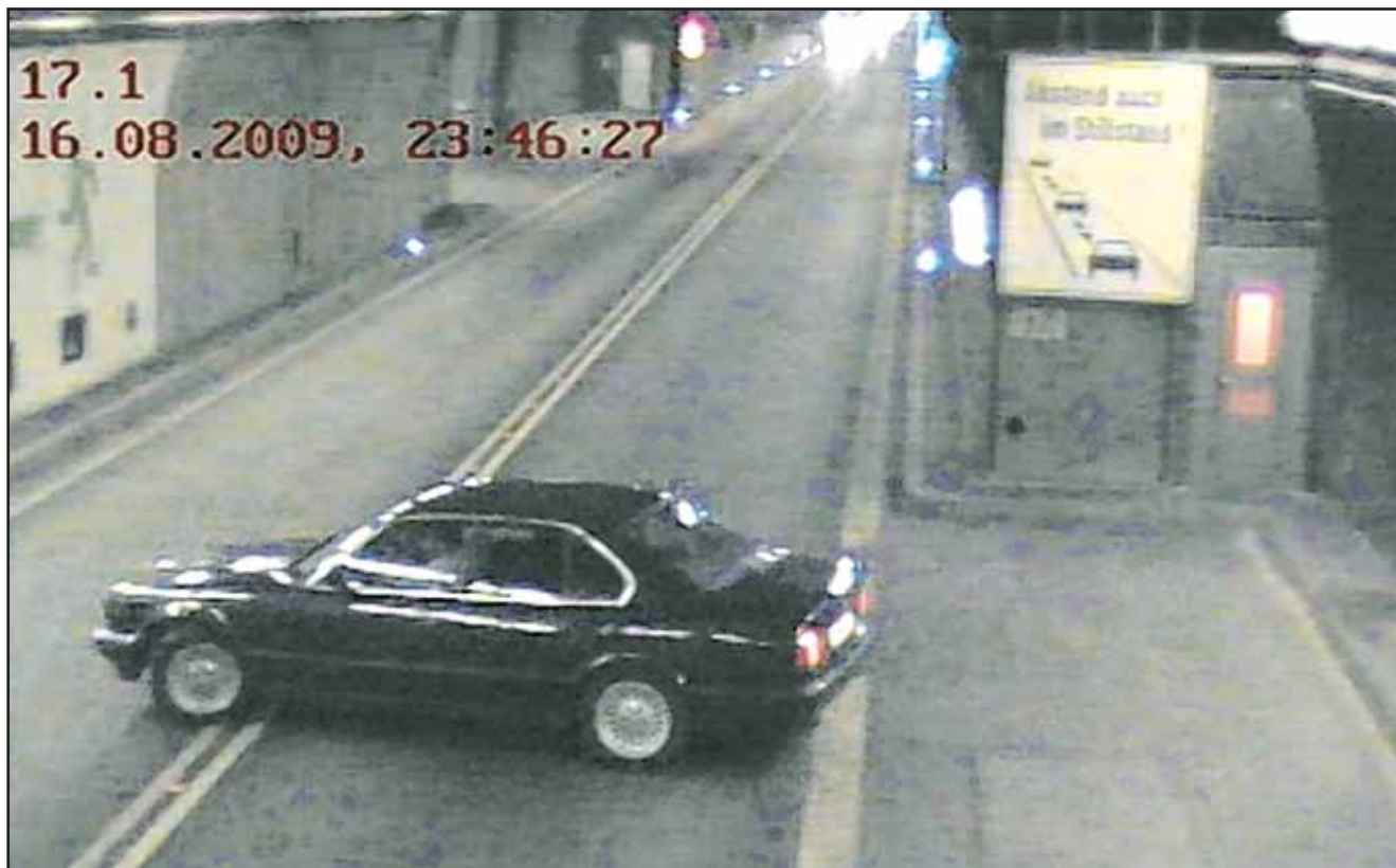
Cette année, des dizaines d'automobilistes ont fait demi-tour dans le tunnel du Gothard, induits en erreur par leur GPS.

CIRCULATION • Accorder une confiance aveugle à la douce voix de son GPS est dangereux. Les failles de ce système de navigation font qu'il ignore certains éléments. Ainsi peut-il conseiller au conducteur de faire demi-tour alors que la signalisation l'interdit.