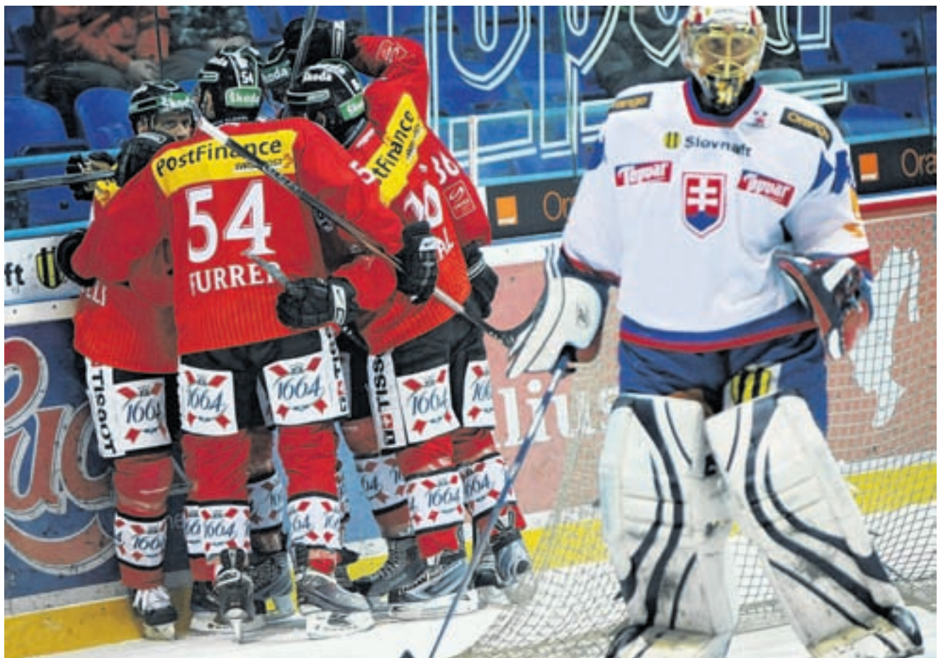
Werbung in eigener Sache. Die Schweizer Eishockeyaner jubeln über ihren Abschlussieg gegen die Slowakei.