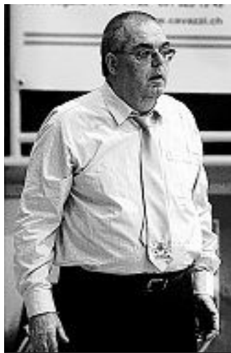
Dopo il derby alle pagine 23 e 28