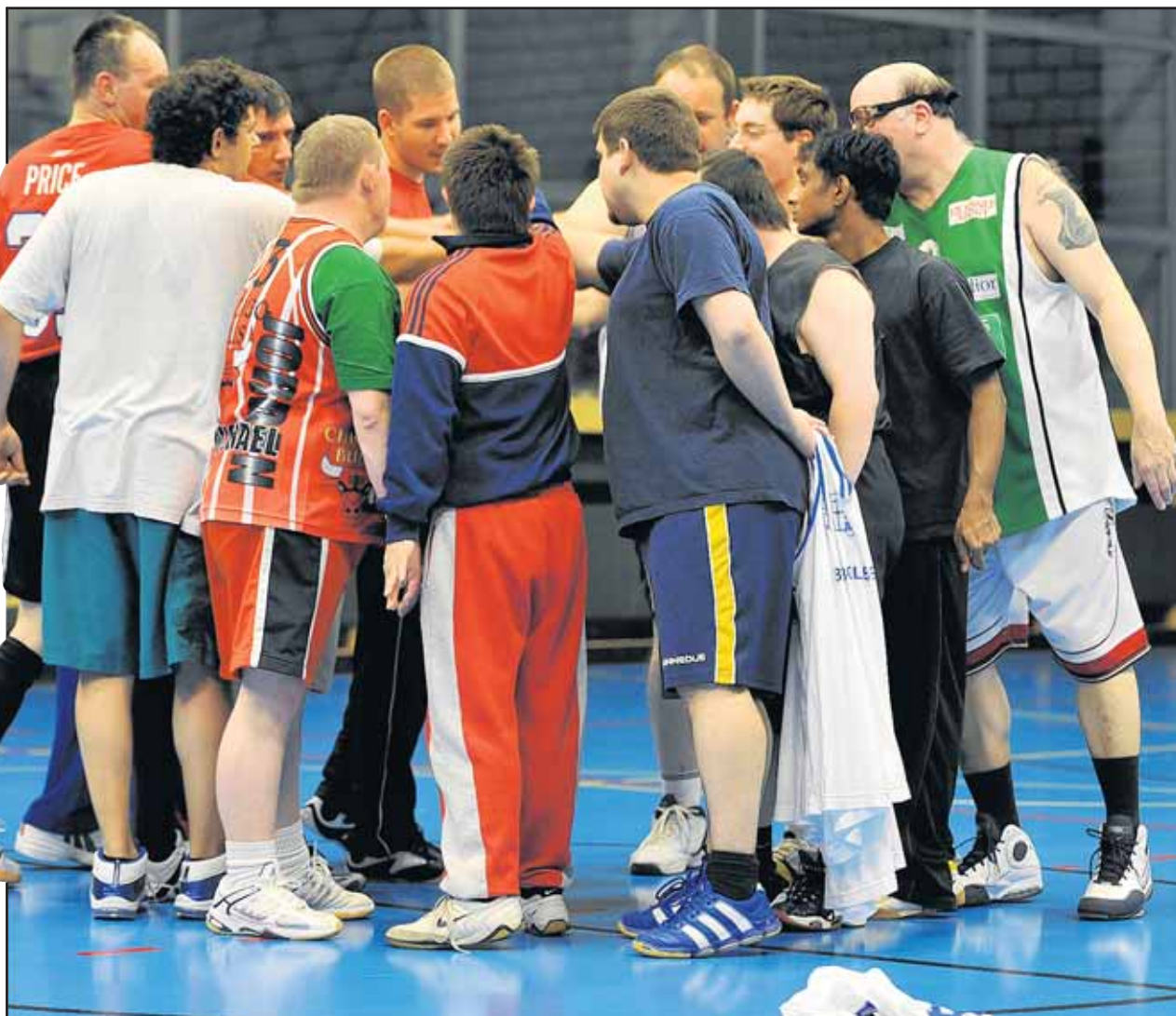
L'équipe des Bolze Stars 2 au complet un soir d'entraînement.

Dimanche dernier a notamment eu lieu une manche du championnat de Suisse de basket à la salle du Platy à Villars-sur-Glâne. Environ 130 personnes ont participé aux deux tournois de ligue C et D. «Les athlètes viennent de toute la Suisse. A la différence du championnat des personnes valides, les équipes, qui peuvent être mixtes, ne se rencontrent pas chaque week-end, mais lors de deux à trois tour-