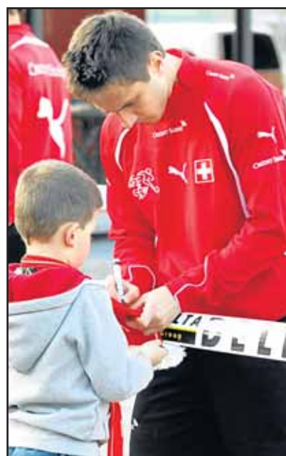
Mario Gavranovic: déjà la cible des chasseurs d'autographes.

L'ancien joueur de Lugano, Yverdon et Xamax ne foulera toutefois pas la pelouse du stade Vasil Levski dès le coup d'envoi, la paire Frei-Streller tenant toujours la corde. Mais Ottmar Hitzfeld ne laissera pas sur le banc un joueur qui, s'il ne dispute ne serait-ce qu'une minute à Sofia, ne pourra définitivement plus porter le maillot de la Croatie, son pays d'origine. «Je souhaite ne plus lire dans les médias ce genre de choses, demande fermement le joueur. Je ne suis pas venu pour être remplaçant ou pour ne jouer que deux minutes. Je ne veux plus parler de ce sujet.»