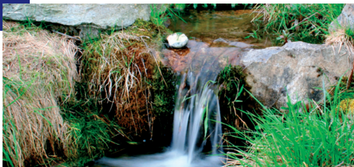
arboretum CEA: partenaire de l'Association de l'Arboretum du Vallon de l'Aubonne

Frais bancaires CHF 0.00 sur votre compte salaire