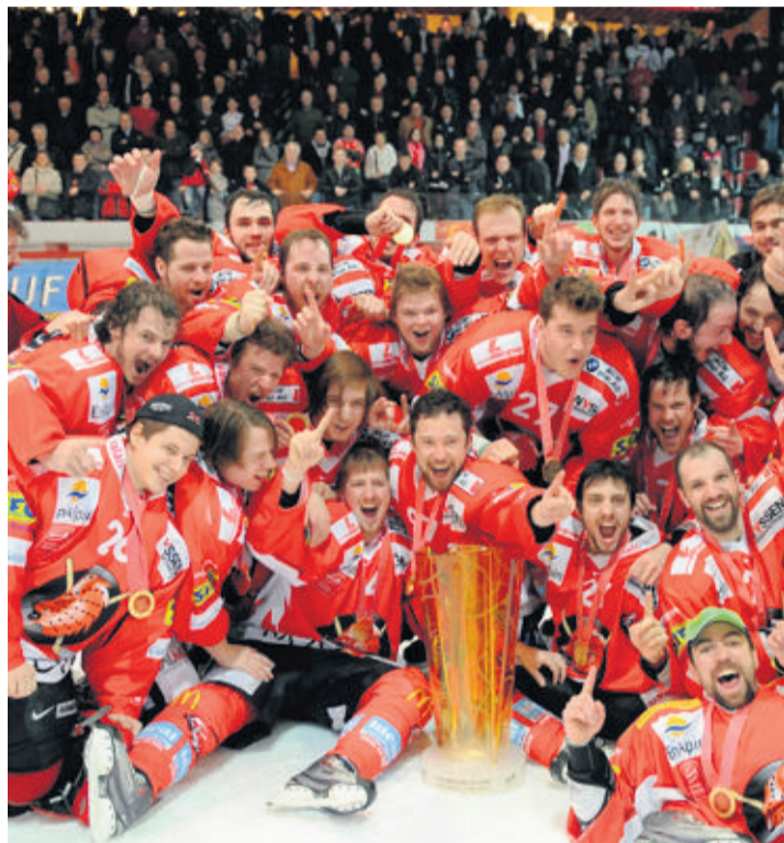
Viège a décroché hier soir le titre de champion de LNB.

parleurs et les vrais acteurs s'est vue depuis avril dernier. Le violent coup de balai des propriétaires des doubles champions en titre avait alors contrasté avec la sérénité affichée par les vaincus. Puis, aux fracassantes déclarations des nouveaux «décideurs» de Malley, ceux de Viège ont préféré afficher leurs ambitions avec une conviction teintée de prudence.