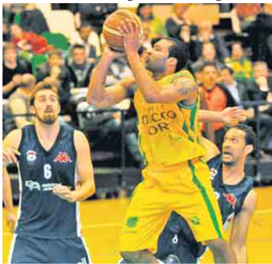
La SAV Vacallo dello scatenato Green ha "schiacciato" la SAM Massagno. (fotogonnella)

Archiviato il derby, stasera all'Elvetico entreranno in scena i Tigers del Lugano, freschi vincitori della Coppa Svizzera. Ospite di lusso l'Olympic Friburgo, squadra che coach Whelton candida «come finalista perché è completa e ha almeno 5/6 giocatori in grado di andare in doppia cifra. Ho concesso due giorni di libero ai giocatori, spero solo che non ci siano infortuni prima dei playoff. Giocheranno tutti molti minuti. Sarà sicuramente una bella sfida». Al termine della partita tra Lugano e Olympic per festeggiare la vittoria in Coppa Svizzera ai tifosi verrà offerta una maccheronata.