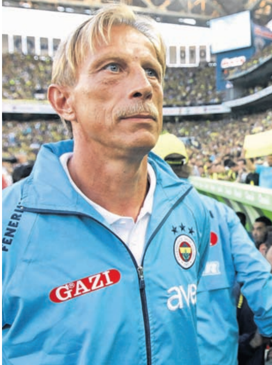
«Bin kein Feuerwehrmann». Christoph Daum beendet seine Arbeitslosigkeit.

Für Daum bietet das Engagement in Frankfurt wieder die Chance, in der Bundesliga Fuss zu fassen. Im Sommer 2010 verliess er den 1. FC Köln für das lukrativere Angebot von Fenerbahce Istanbul. Nun sagt er: «Mein Wunsch ist es, dass der 1. FC Köln und Eintracht Frankfurt drin bleiben.»